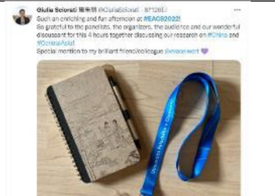
學者展示本館提供文創品