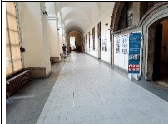
捷克國家圖書館長廊