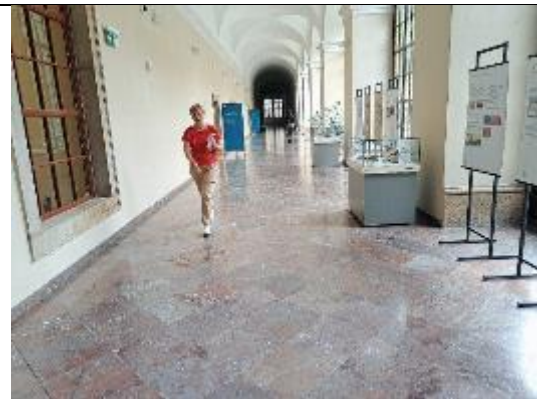
捷克國家圖書館另一側長廊