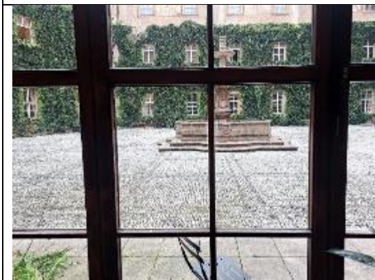
捷克國家博物戶外場地