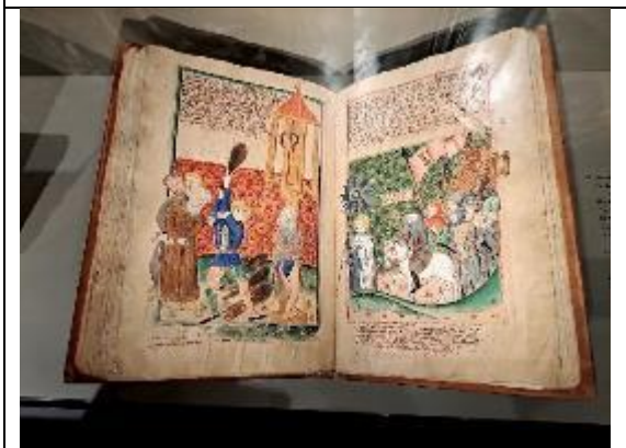
捷克國家博物館典藏許多古籍善本