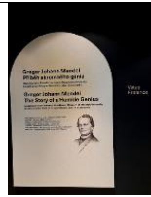
孟德爾博物館展場入口