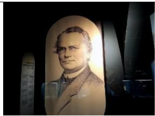
博物館內展場展示不同時期的孟德爾照片