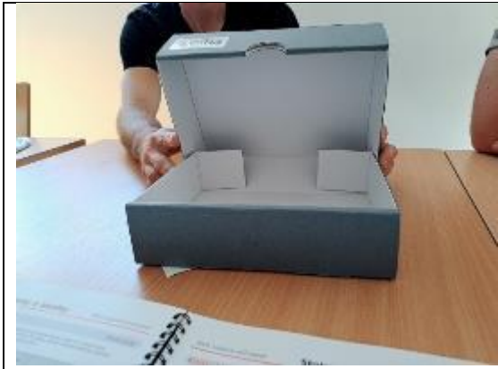
可裝入手稿及古籍之無酸紙盒