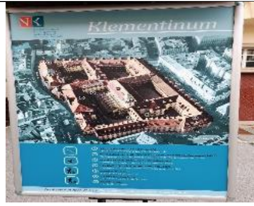
克萊門特學院歷史建築群平面圖