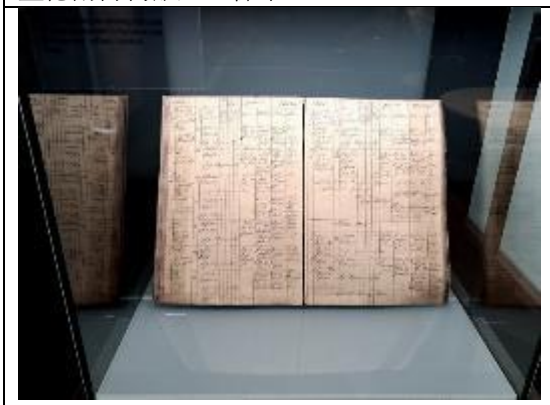
博物館內展示當年孟德爾之手稿資料