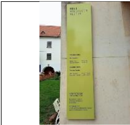
孟德爾博物館入口標示