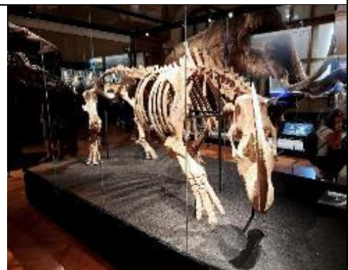
自然科學類蒐藏品為該館核心