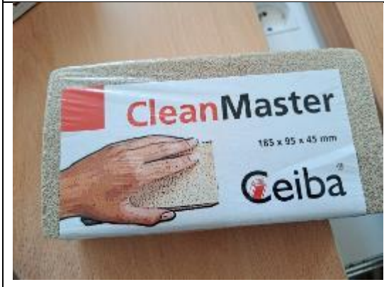
古籍髒污擦拭泡棉