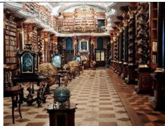
世界最美麗的圖書館—克萊門特學院圖書館