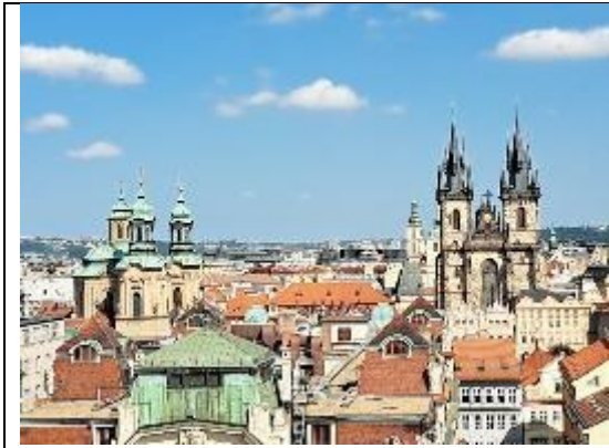
由克萊門特學院圖書館俯瞰布拉格城堡