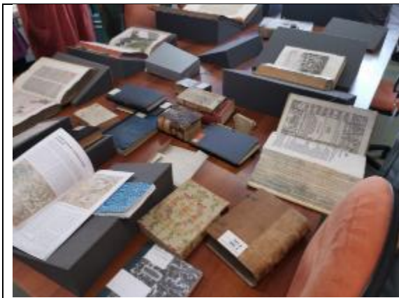
參觀 Olomouc 圖書館特藏