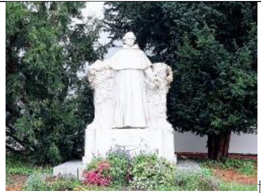
物館外之孟德爾雕像