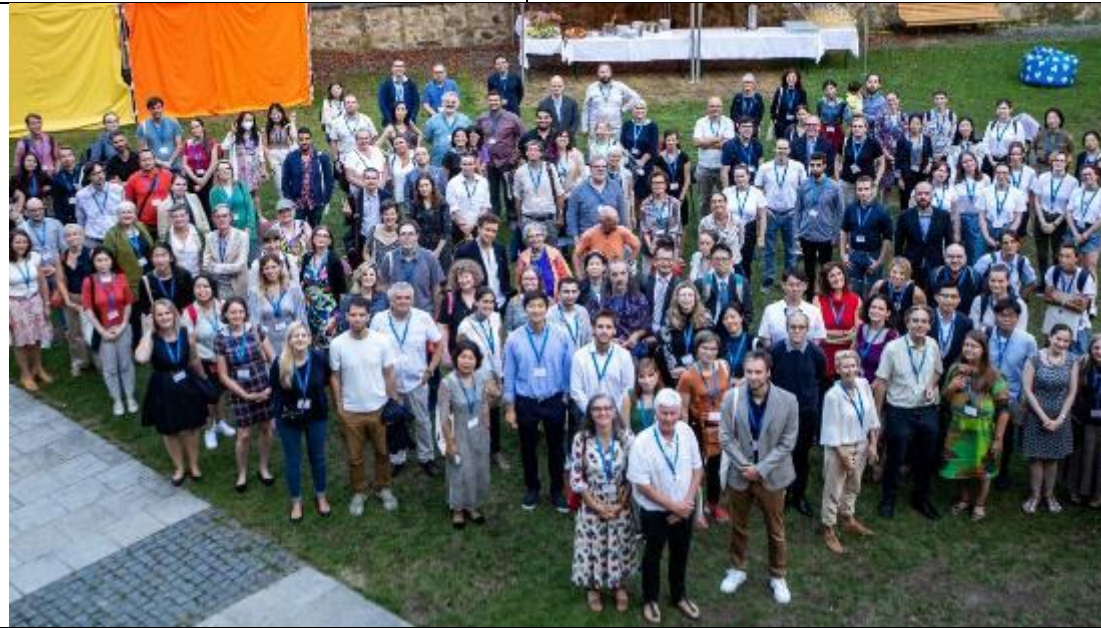
大會晚宴合影