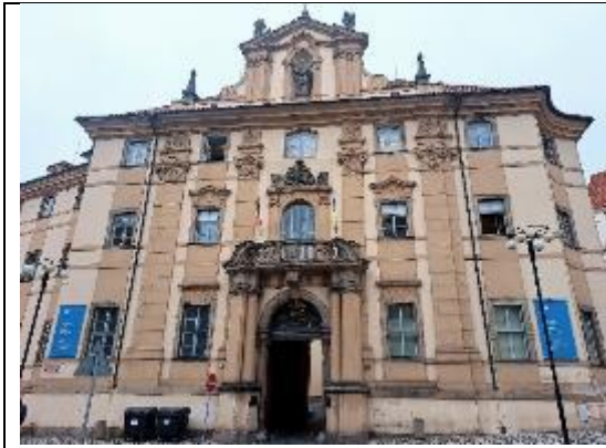
捷克國家圖書館 入口