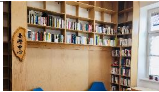
本館捐贈圖書後立即納入亞洲學系 臺灣中心