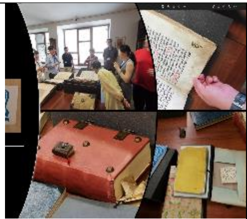
參觀 Olomouc 圖書館特藏