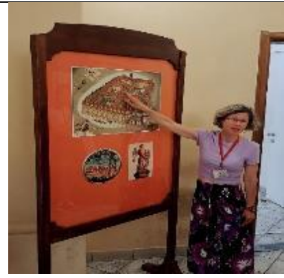
克萊門特學院圖書館導覽員