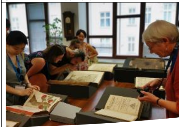
參觀 Olomouc 圖書館特藏