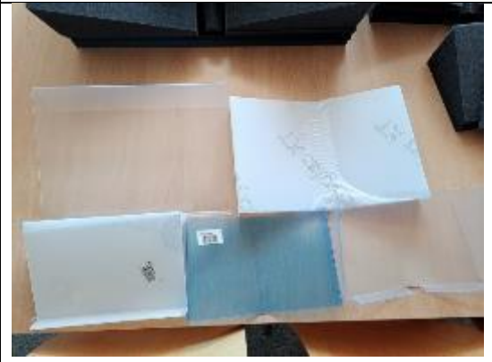
不同形式之古籍展示架