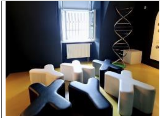
展場內有 XY 染色體製作的裝飾藝術及造型椅