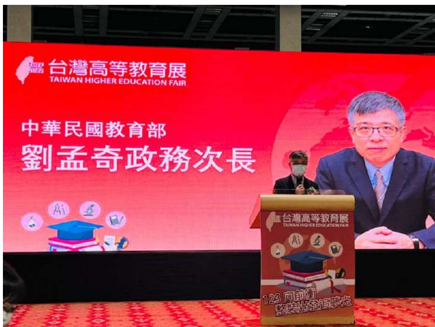
劉孟奇政務次長於高教展開幕典禮致詞