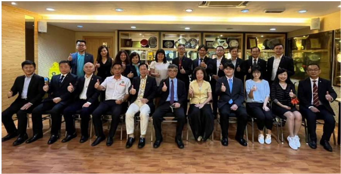
劉孟奇政務次長訪團與留臺聯總團隊合影