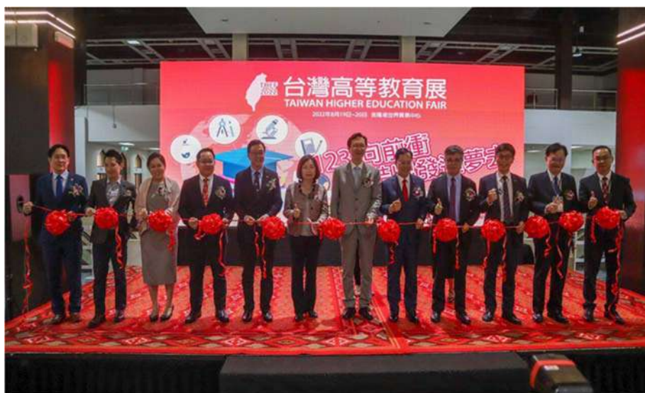
劉孟奇政務次長（右四）與出席嘉賓共同揭開教展序幕

本次高教展駐馬來西亞代表處教育組亦爭取設立一個攤位，除持續向馬國學生、家長及師長推廣留學臺灣、學華語到臺灣以及宣傳教育部人才資料庫計畫等相關訊息。