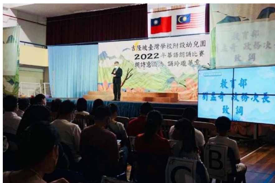
劉孟奇政務次長出席臺校附設幼兒園第 11 屆華語朗誦比賽致詞