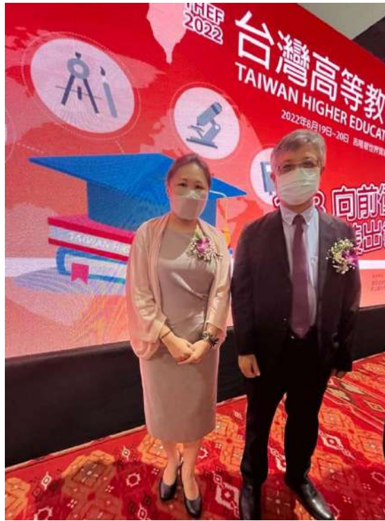
劉孟奇政務次長與教育部第三屆全球留臺傑出校友獎得主柔佛州黃書琪國會議員