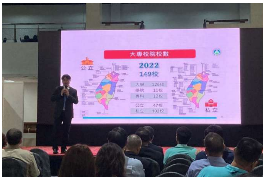
朱司長於高教展現場分享臺灣高等教育現況及相關政策

楊玉惠司長，於高教展期間在會場與出席活動的各地同學會升學輔導人員、師長及學生們分享臺灣高等教育現況及相關政策，內容包括相關高等教育數據、高教政策發展如「高教深耕計畫」、「新南向計畫」、「擴大招收僑外生計畫」、「玉山學者計畫」、「產學攜手合作計畫」、「產業學院計畫」、「產業碩士專班計畫」、「產業合作培育博士級研發人才計畫」等、及技職教育的推動成果與其他僑外生服務事項，受到臺下聽眾的熱烈迴響。