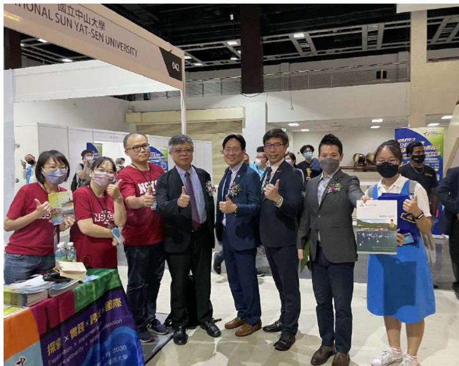
劉孟奇政務次長(左四)與立法院張其祿、鍾佳濱、何志偉委員及及學生們互動