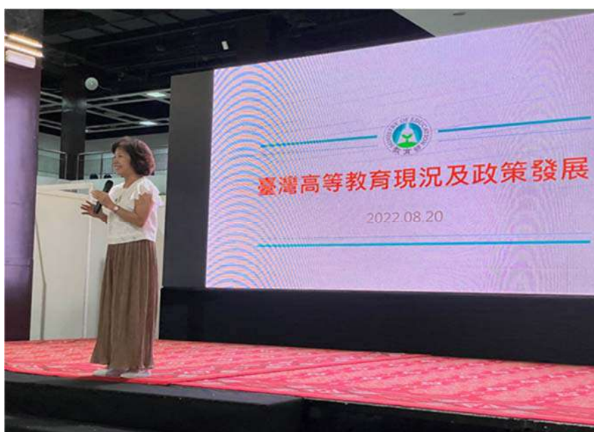
楊司長於高教展現場分享技職教育最新發展