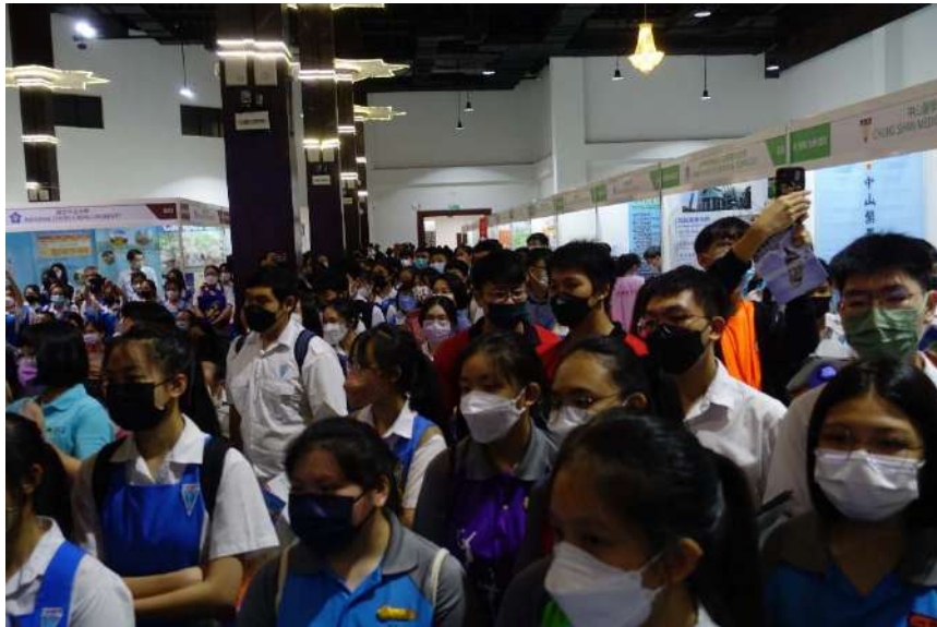
高教展現場人潮不斷，氣氛熱烈