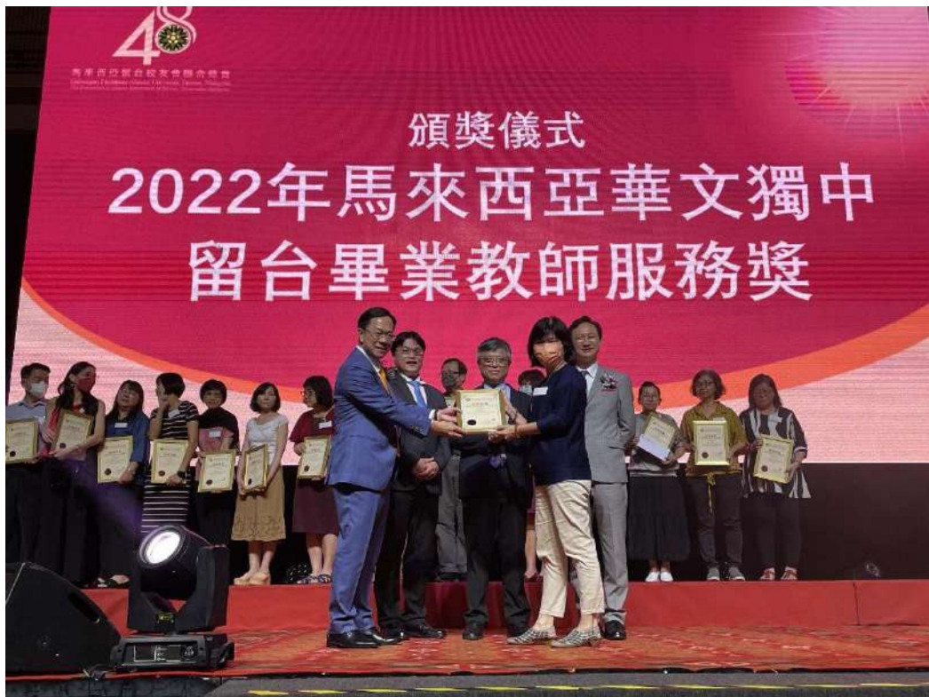
劉孟奇政務次長受邀上臺頒發留臺畢業教師服務獎