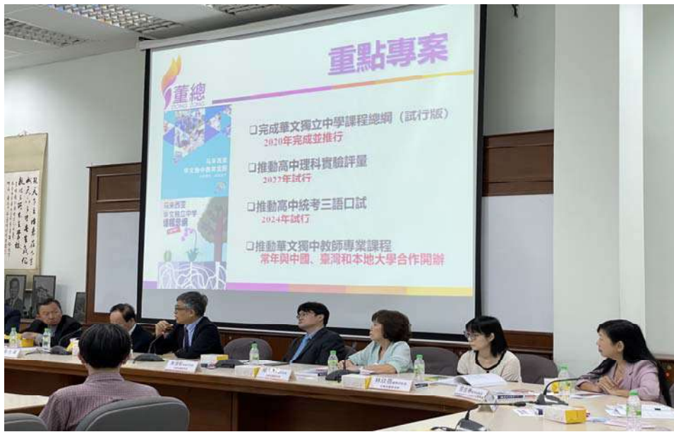
劉孟奇政務次長（右三）與董總代表們座談情形