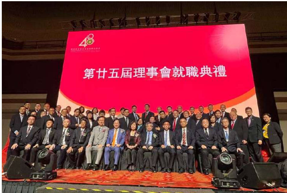
劉孟奇政務次長出席留臺連總第 25 屆理事會就職典禮