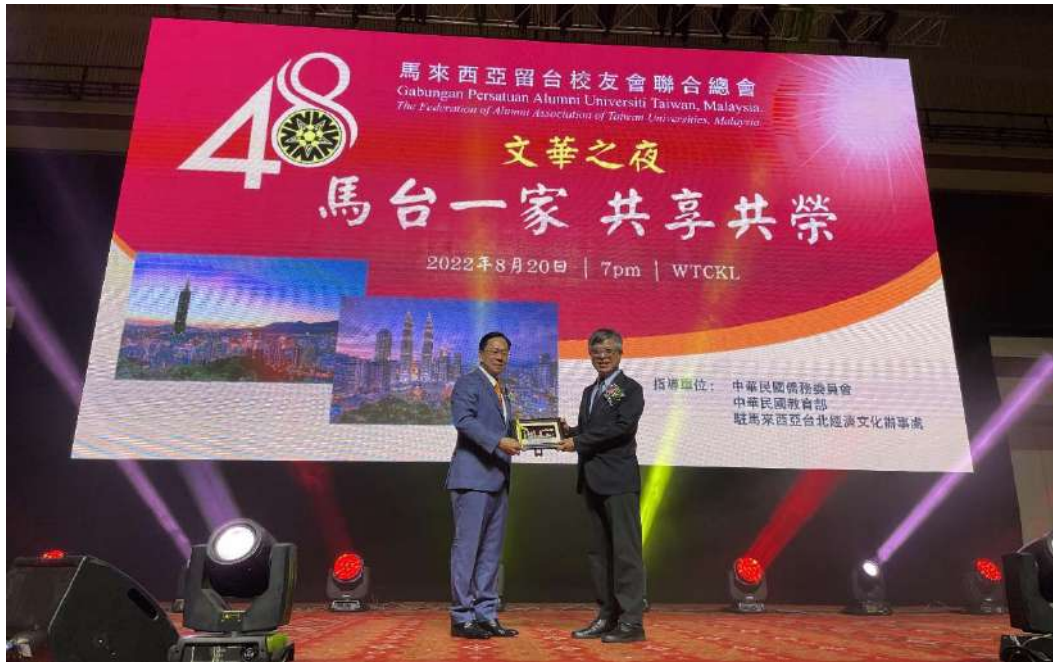
劉孟奇政務次長與大會主席拿督陳榮州總會長互相贈禮紀念合影