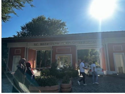
圖一：巴茲米亞蘭醫學院