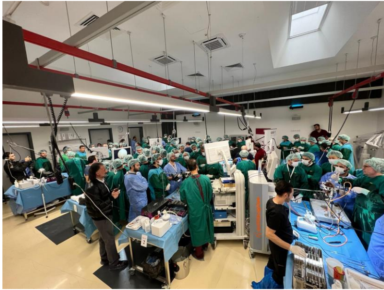
圖四：肩肘大體教學