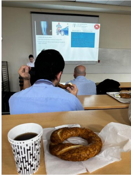
圖七：晨會還有附美味早餐