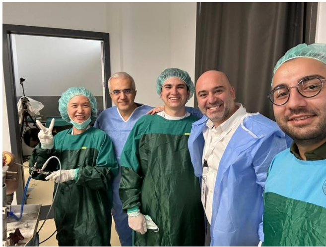
圖五：左起為我、肩肘關節理事