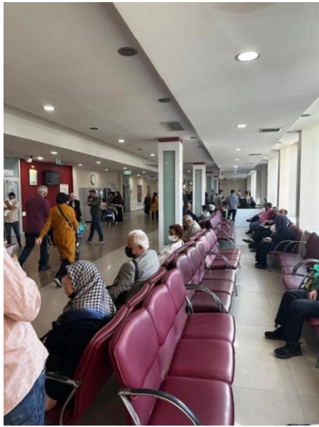
圖二：門診區候診病人