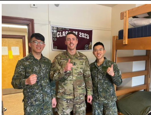
圖十二、與實習連長交換學校臂章並合影