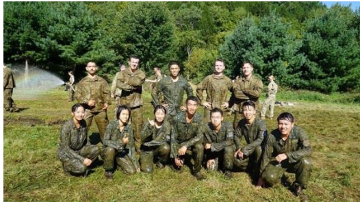
圖三、Dog River Run 從壕溝爬出之合照