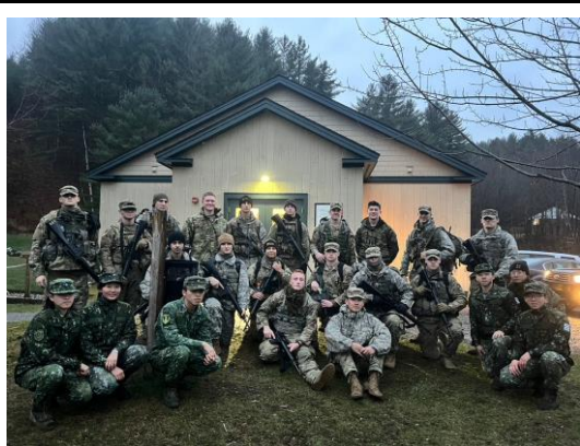
圖十、返國前與遊騎兵全體社員合影