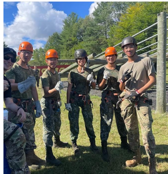
圖四、高山極寒地作戰社團高塔垂降體驗