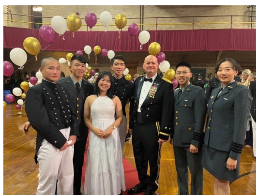
圖七、參與舞會與校長合影