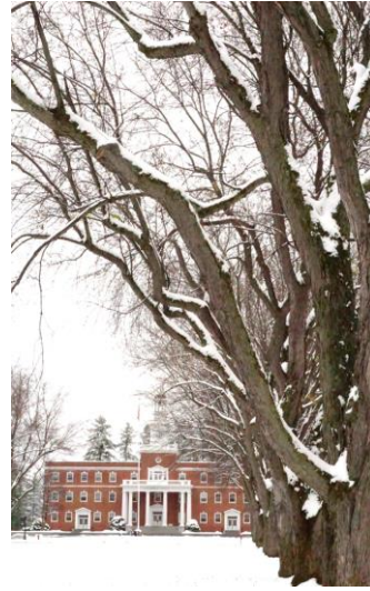
圖二、威爾猛大學冬景