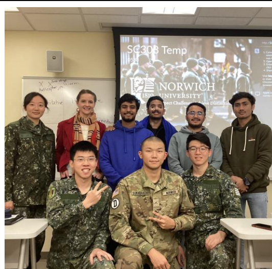
圖十一、與「進階學術英文」教授及同學合影