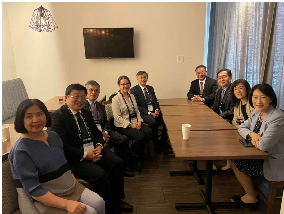
蕭大使與校長座談，照片左起：教育部國際及兩岸教育司李彥儀司長、駐丹佛臺北經濟文化辦事處黃世昌處長、教育部劉孟奇政務次長、駐美國臺北經濟文化代表處蕭美琴大使、國立陽明交通大學鄭子豪副校長、臺北醫學大學吳介信副校長、國立東華大學趙涵捷校長、國立成功大學蘇慧貞校長、國立臺灣大學周家蓓副校長。