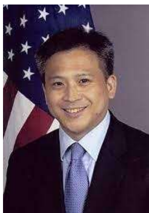
Principal Deputy Assistant Secretary Bureau of East Asian and Pacific Affairs (EAP) Education: Columbia University and the University of Minnesota