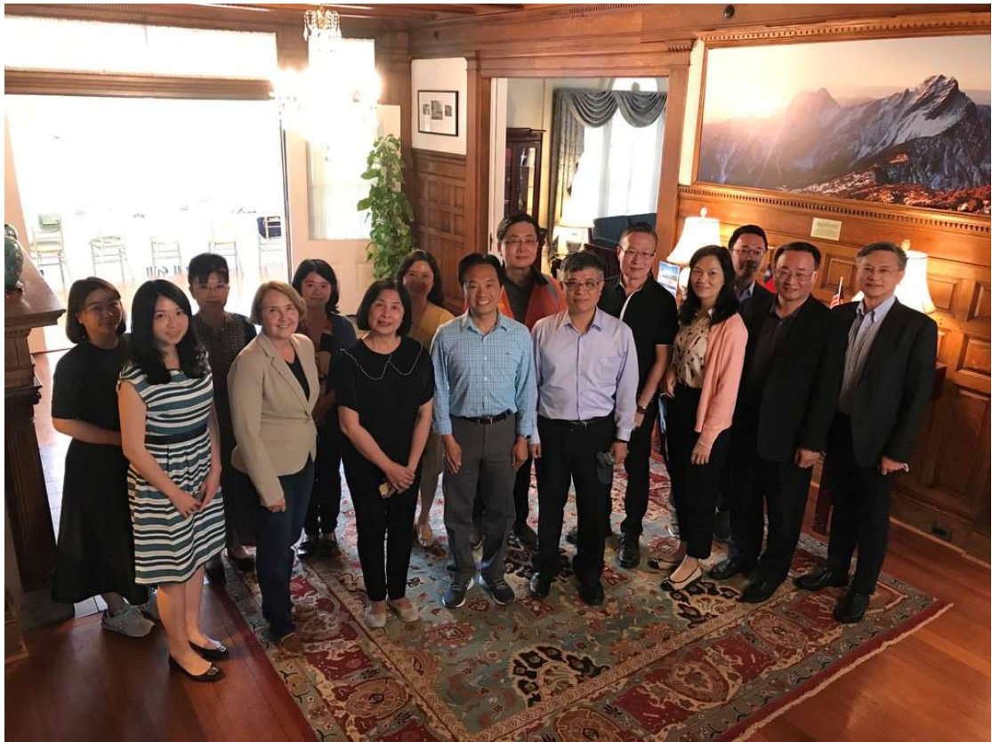
6月4日，訪團成員與駐美代表處鄭公使於雙橡園合影留念。