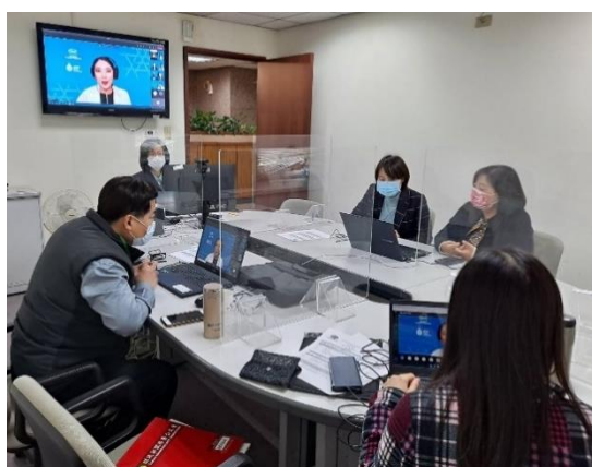
本署參與本年 SCCP 第1次會議情形

主席總結：感謝本次與會者分享意見及積極參與，使會議成果豐碩，如：經濟體因應 COVID-19 疫情之進展及更新事項、疫情後復甦策略、提升 APEC 區域連結性、運用科技並於全球貿易環境提供能力建構，相信經濟體與來賓提出之見解及討論議題，將有助 COVID-19 疫情後 SCCP 工作進展，盼本年 SCCP 第2次會議以實體方式舉辦，歡迎大家赴泰國與會。