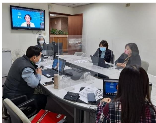
本署參與本年 SCCP 第1次會議情形

主席總結：感謝本次與會者分享意見及積極參與，使會議成果豐碩，如：經濟體因應 COVID-19 疫情之進展及更新事項、疫情後復甦策略、提升 APEC 區域連結性、運用科技並於全球貿易環境提供能力建構，相信經濟體與來賓提出之見解及討論議題，將有助 COVID-19 疫情後 SCCP 工作進展，盼本年 SCCP 第2次會議以實體方式舉辦，歡迎大家赴泰國與會。