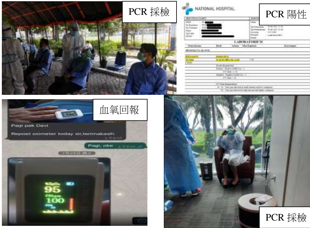
圖 11. 臺印員工染疫情況

c. 防疫措施：為降低接觸風險，臺印公司每月配發足額口罩並強制員工配戴，增設辦公室隔板、收費及管制站櫃台增設擴音設備、定期消毒、每月實施快篩、居家上班、分區分流上班等措施，降低員工於工作環境中群聚感染的風險，以維持公司正常營運人力。