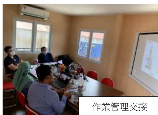
圖 2: 各項業務交接