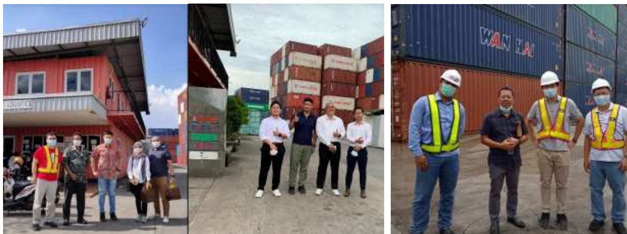
圖 15. 客戶參訪

邀請航商客戶參訪與視導現場實際作業情況，並定期討論作業遭遇困難，相互合作支援事項等。