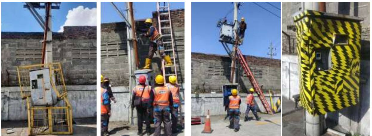
圖 7. 變電箱修復及遷移作業

b. 變電箱遷移作業: 因櫃場入口處變電箱時常遭到拖車撞擊，為避免意外發生及電力中斷影響作業，聯繫電力公司協助調整變電箱位置並黏貼反光貼紙。