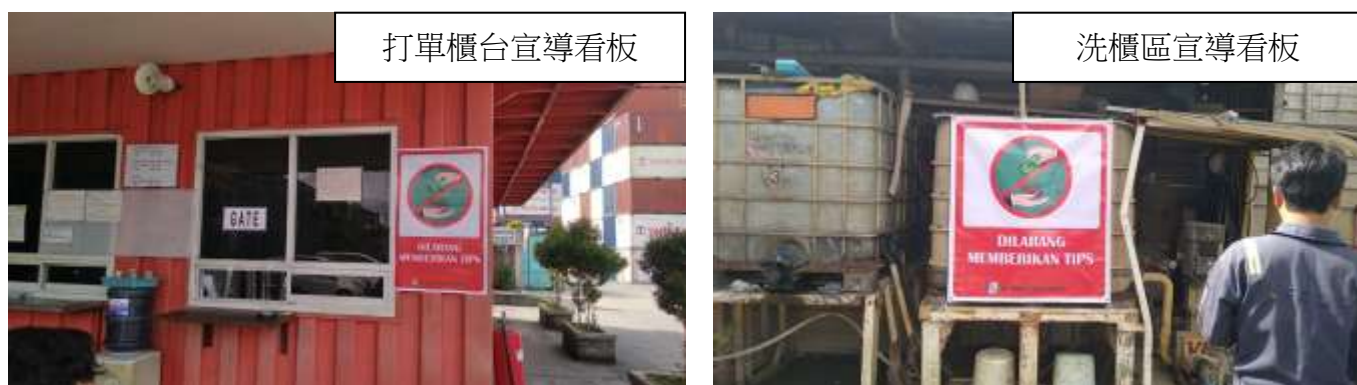
圖 14. 拒收小費看板

110年6月，雅加達地區貨櫃堆場因員工長年向拖車司機索取小費，經拖車司機向印尼總統反映後，指派警察總長取締。共計2家堆場數名員工被逮，被迫暫時停業。為防止此惡習影響臺印公司企業誠信，即刻加強宣導請勿向客戶索取小費及拒收小費，並印製拒收小費看板張貼於場內。