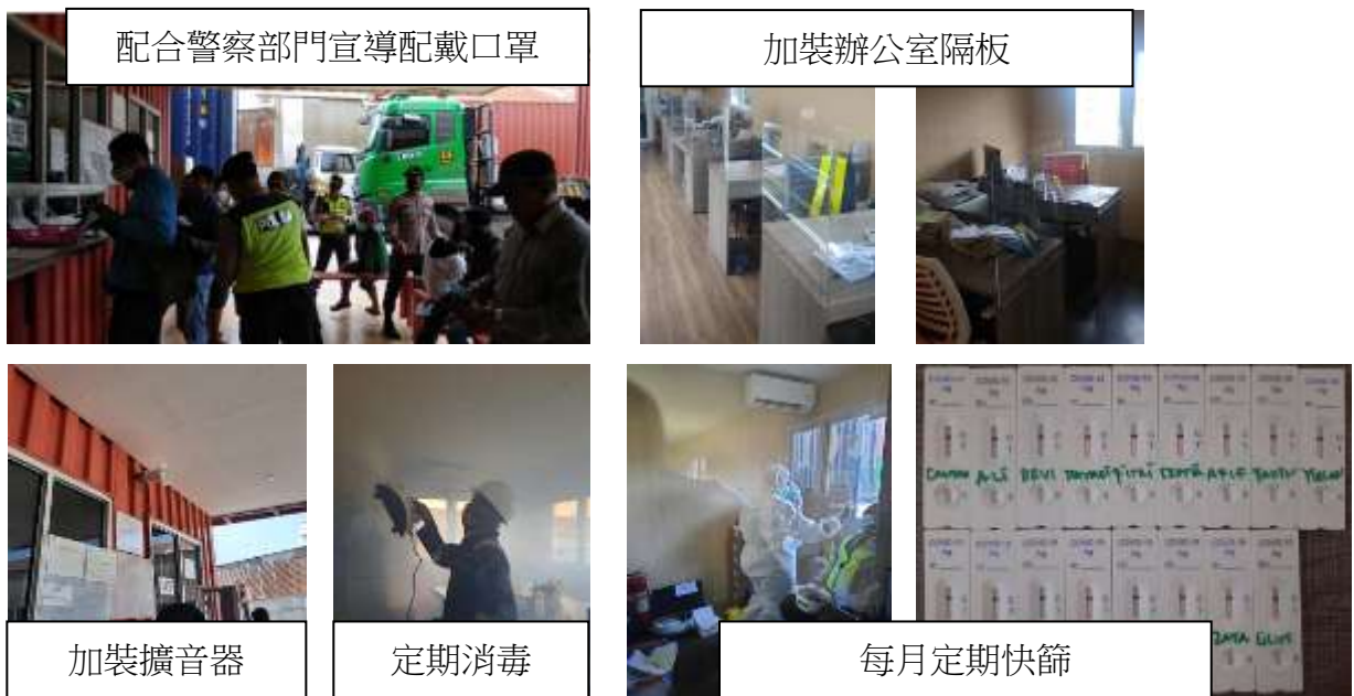
圖 12. 臺印防疫措施

c. 防疫措施：為降低接觸風險，臺印公司每月配發足額口罩並強制員工配戴，增設辦公室隔板、收費及管制站櫃台增設擴音設備、定期消毒、每月實施快篩、居家上班、分區分流上班等措施，降低員工於工作環境中群聚感染的風險，以維持公司正常營運人力。