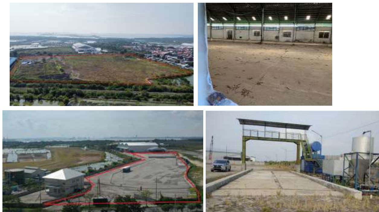
圖 16. 場域勘查

因臺印現址場地無法再拓展營運規模，若未來櫃量增加或朝倉儲業務發展，需另尋適當場地增闢營運面積，故若泗水地區有適合的場地出租或出售，皆前往勘查及留下報價資料等，以便做業務拓展評估。