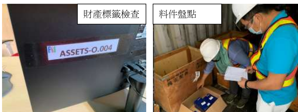
圖 13. 資產及庫存盤點作業

每半年進行一次庫存料件及資產清點，確認庫存料件、油品是否與表相符及資產是否短缺或損壞。