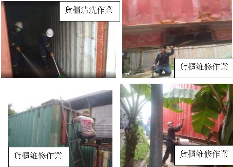
圖 4. 貨櫃清洗及維修作業

(3) 巡視車機保養情況：車機保養包含潤滑油品、濾心定期更換作業(機油、變速箱油、齒輪油、液壓油等)、輪胎更換及實施定期調換輪胎順序以延長使用壽命，及各項機件潤滑保養作業等。