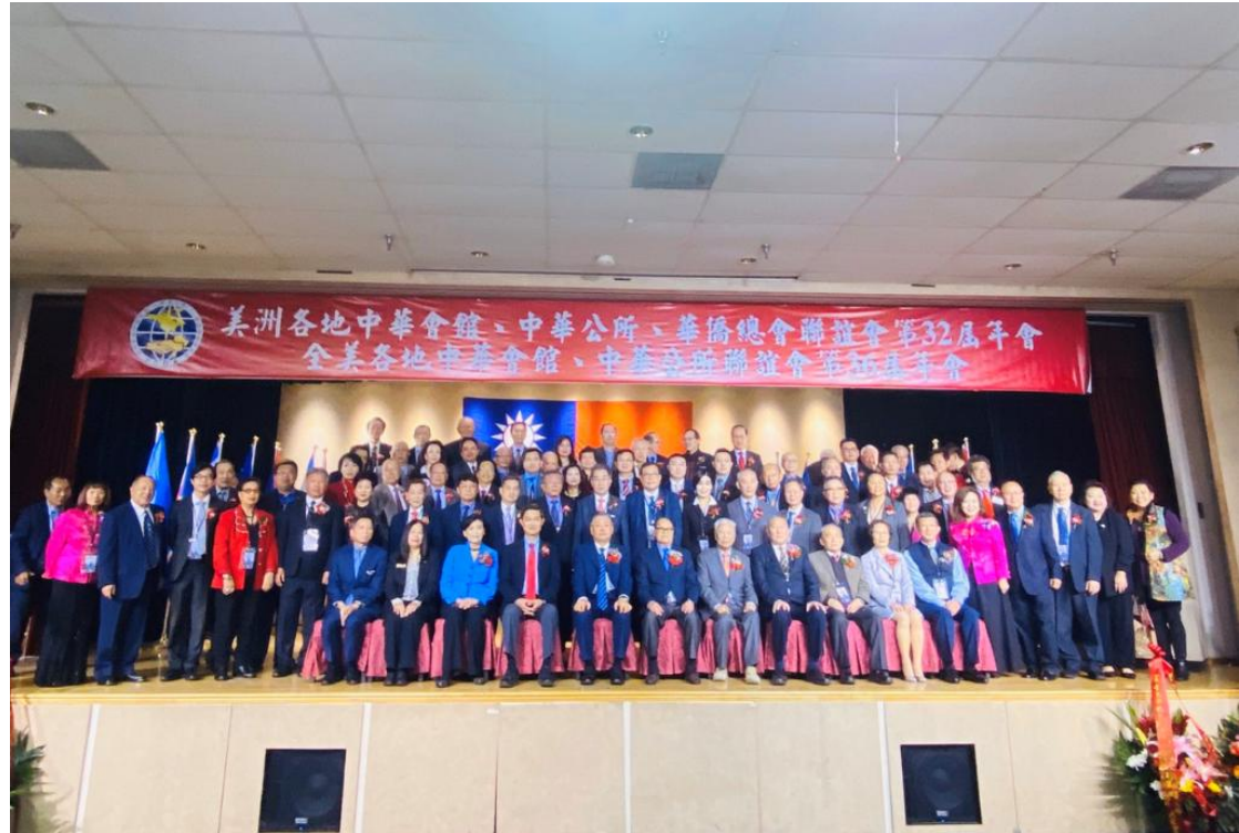
呂副委員長出席美洲年會