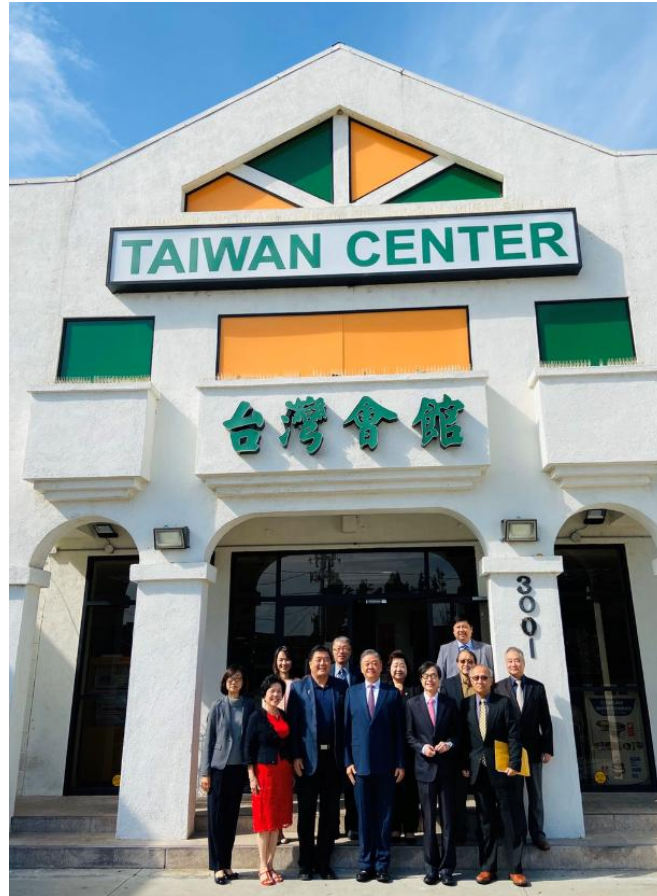
拜會大洛杉磯臺灣會館