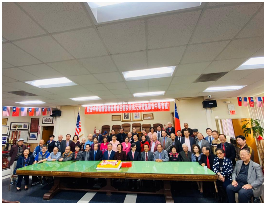
拜會羅省中華會館