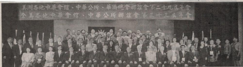
泛美中華會館、中華公所、華僑總會聯誼會，上一次在洛杉磯舉辦是2016年。

強有力的聲音。後來正因為有了會議串聯，全美華人彼此加強溝通，攏成一個拳頭，在主流社會能產生重要影響。