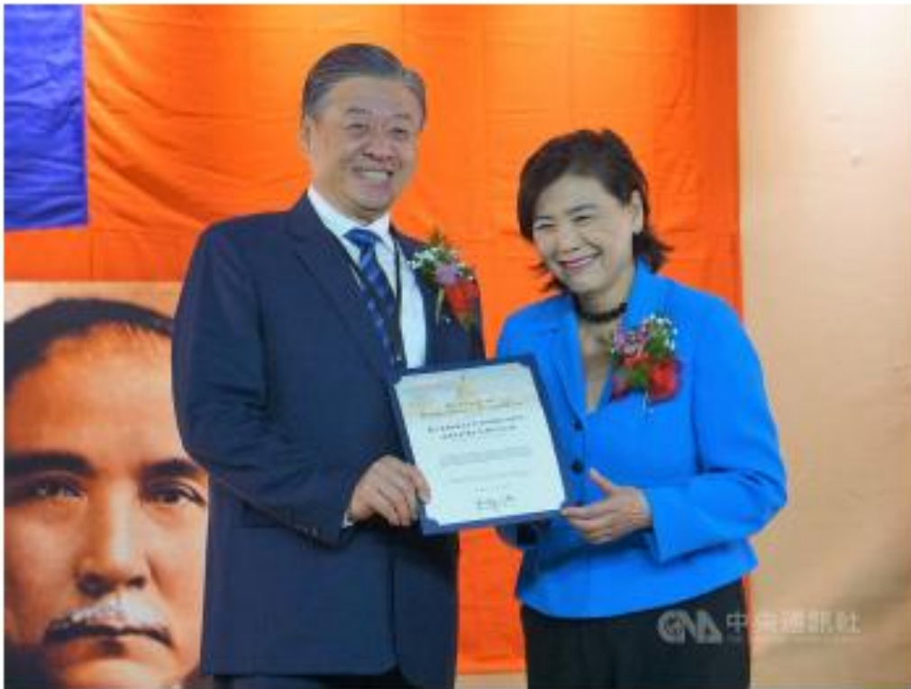
中華民國僑務委員會副委員長呂元榮19日出席美洲各地中華會館、中華公所、華僑總會聯誼會年會，接受美國聯邦眾議員趙美心頒發感謝狀。109年2月20日