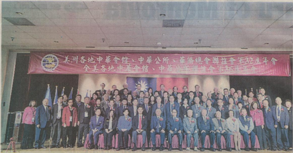
▲2月19日，中華會館、中華公所、華僑總會聯誼會等美洲傳統僑社舉辦年會，100多人出席。

他提到，臺灣的防疫表現在全世界都是非常優秀的，也希望在美僑胞面臨如此疫情衝擊都能顧好身體。◇