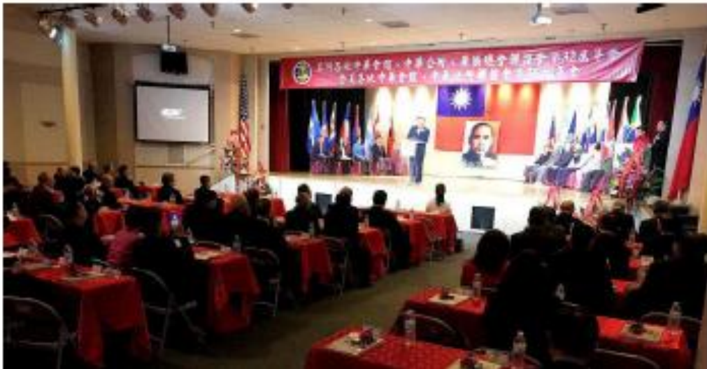
全美各地的傳統僑社領袖19日在洛杉磯集會，發表共同聲明，武漢肺炎疫情擴散之際，支持中華民國參加世界衛生組織（WHO），共同為全球防疫努力。 109年2月20日