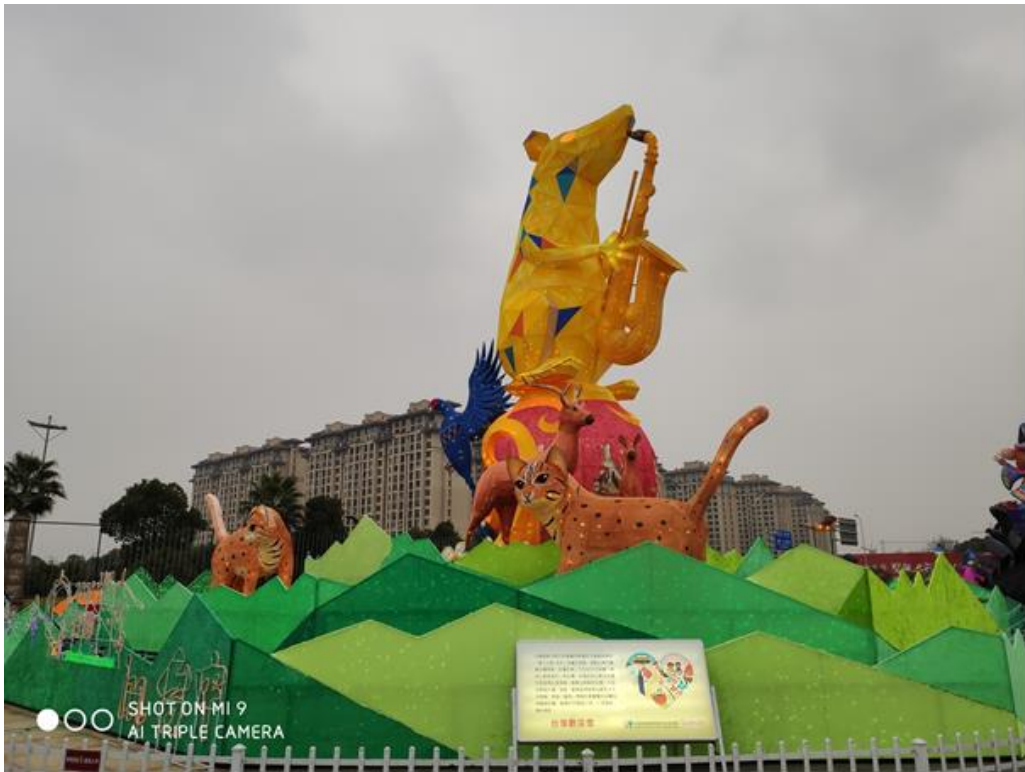
2020 臺灣江蘇燈會主燈開燈前