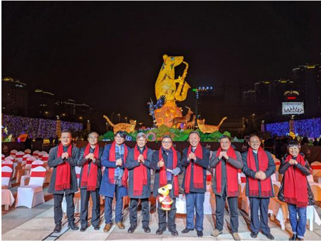
2020 臺灣江蘇燈會交流－開燈貴賓合影