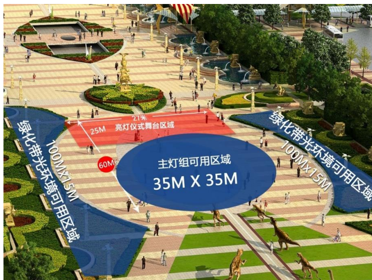
2020 臺灣江蘇燈會場地平面規劃圖

(三) 1 月 18 日代表團中午與常州市文化廣電和旅遊局榮凱元局長針對江蘇燈會活動細節進行簡報並進行意見交換，下午由榮凱元局長陪同考察青果巷一期規劃及修復情形，隨後至「2020 臺灣江蘇燈會交流」燈區燈藝調整、檢視作業暨晚間出席開燈儀式。