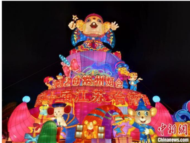
常州的《魔鼠狂想曲》灯组

中新网常州1月19日电 (唐娟 魏佳文)两岸的生肖灯组交相辉映,2000平的麦浪灯海浪漫唯美、20米高的霸王龙灯光交织、硕大的七彩天穹尽显科技魅力……1月18日晚,“第十届江苏·台湾灯会”在常州环球恐龙城迪诺水镇华彩启幕,以彩灯为纽带,用光影做桥梁,传递两岸友好声音。