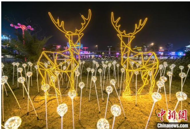
“第十届江苏·台湾灯会”在常州环球恐龙城迪诺水镇华彩启幕

本届“江苏·台湾灯会”每晚17:00-22:00亮灯，将一直持续免费开放至2020年4月6日，现场共设置了“魔灯秘境区”“光动万花筒区”“互动pro区”“潮人打卡区”四大主题板块，在保留往年传统灯组元素的同时，更多的加入了时尚主流科技灯组，在灯组的科技感与参与性上寻求突破，更加注重科技与创意的完美融合。