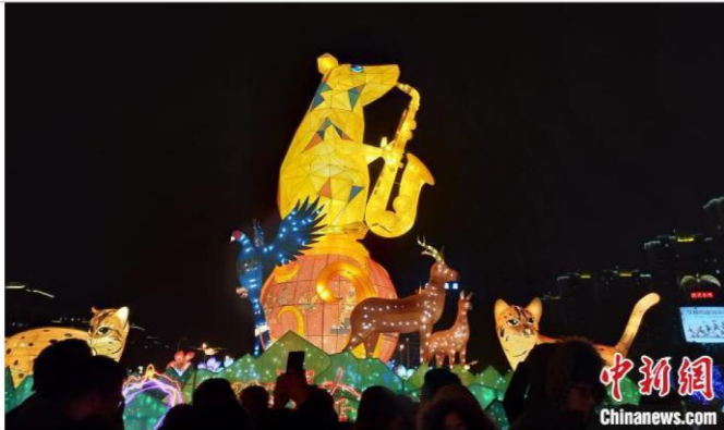
台湾的生肖主灯

本届“江苏·台湾灯会”每晚17:00-22:00亮灯，将一直持续免费开放至2020年4月6日，现场共设置了“魔灯秘境区”“光动万花筒区”“互动pro区”“潮人打卡区”四大主题板块，在保留往年传统灯组元素的同时，更多的加入了时尚主流科技灯组，在灯组的科技感与参与性上寻求突破，更加注重科技与创意的完美融合。