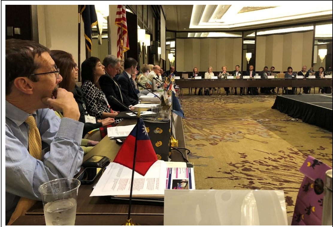
照片說明：美國各州及各國代表論壇(Heads of Delegation Forum)現場照片