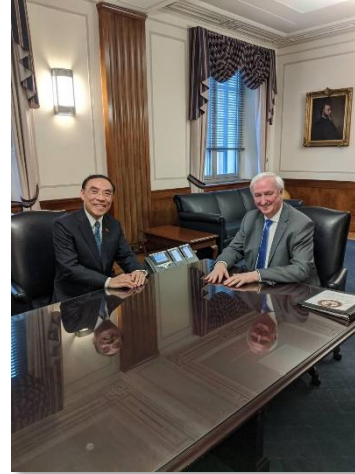
蔡部長與 Rosen 副部長在雙方通話時所使用之電話機前合影