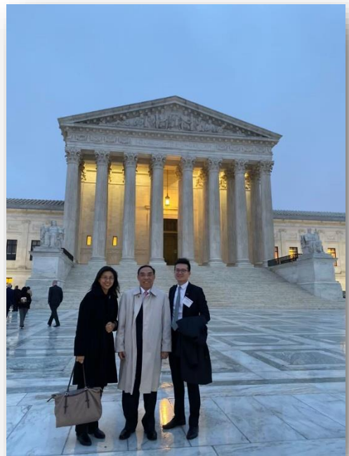
最高法院參訪合影