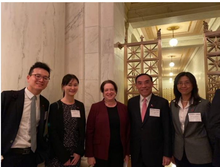
代表團與大法官 Elena Kagan 合影

今日論壇最後一站行程是前往美國最高法院，由大法官 Elena Kagan 在大法庭內接見州檢察長，一一回答州檢察長的提問。大法官 Elena Kagan 是歷年來第四位的女性大法官，在被美國前總統歐巴馬提名前，擔任了六年哈佛法學院院長，於 2010 年 5 月 10 日被提名為大法官，經過參議院同意於同年 8 月 7 日就職。由於本次活動是交流性質，州檢察長們並未提問具體法律問題，反而像好奇的學生向大法官請教工作情形，例如與其他大法官的互動、對於州檢察長在法庭表現的評價等，想要揭開大法官的神秘面紗。蒙大拿州檢察長 Tim Fox 也藉此向 Elena Kagan 大法官介紹來自臺灣的代表團，Elena Kagan 大法官誠摯表示歡迎。