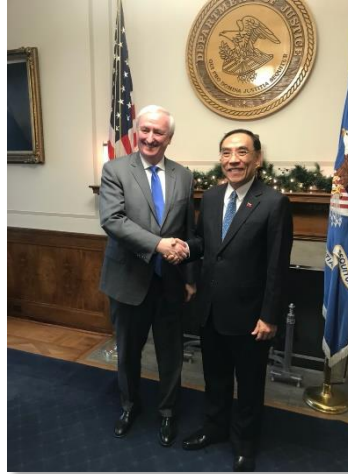
Rosen 副部長與蔡部長在副部長辦公室相見合影