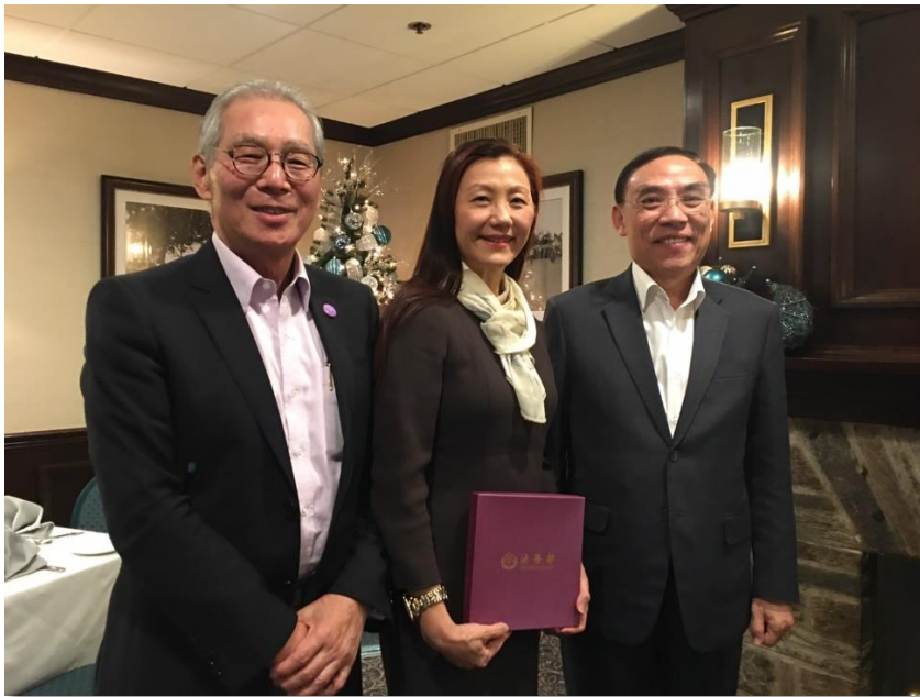
蔡部長與高大使夫婦於餐廳交換紀念品合影

訪團飛抵華府當天中午，我國駐美代表處高碩泰大使夫婦在 Kenwood Golf Country Club's restaurant 宴請代表團成員，並就首次參加全美州檢察長協會首都論壇交換意見。高大使為外交部基層公務員出身，曾擔任外交部北美司司長、我國駐世界貿易組織副代表、駐美代表處副代表、匈牙利代表、義大利代表等職務，於 2016 年 6 月 5 日出任駐美代表迄今。高大使於席間暢談外交工作之甘苦，由於台灣的國際處境特殊，駐外人員必須具備更高度的靈活性與創造力。他以自身為例，因其熱愛運動，曾參加美國職棒開幕賽的開球典禮，藉此讓台灣被更多人看見。