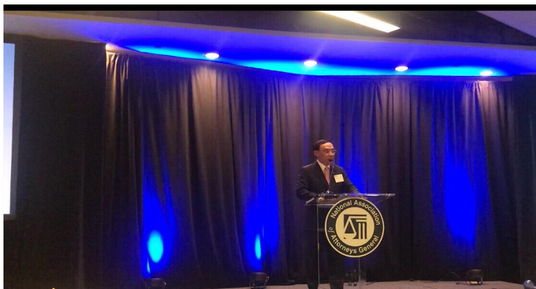
蔡部長於 NAAG 冬季年會開幕儀式致詞

接下來由蔡部長以英語致詞。首先他對協會表示感謝，述及 NAAG 訪團來臺時愉快的相聚回憶。部長接著敘述自己與美國的深厚淵源，不僅在美國進修、職業生涯中亦經常前往美國參與大小會議、與美國檢察官並肩合作，對美國具有一份特殊的情感。而近期臺灣與美國的國際合作不斷有所突破，今年中方才與美國加州檢察官、移民暨海關執法局等一同瓦解跨境詐欺集團，將高額不法所得沒收後，償還被害人。然而犯罪型態不斷翻新，臺灣此時因為總統及立委選舉的關係，受到境外勢力的干擾，檢察機關必須在短時間內發展遏止網路散布假消息犯罪之能力，渠認為這樣的挑戰必然不僅發生在臺灣，因此能來參與本次會議，也期待能與美國州檢察長們就此議題進行討論。另外，臺灣近年來歷經了大規模的司法改革，檢察機關內部之任用也