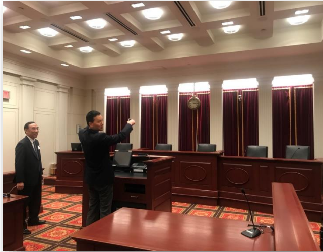
參訪喬治城大學模擬法庭照片