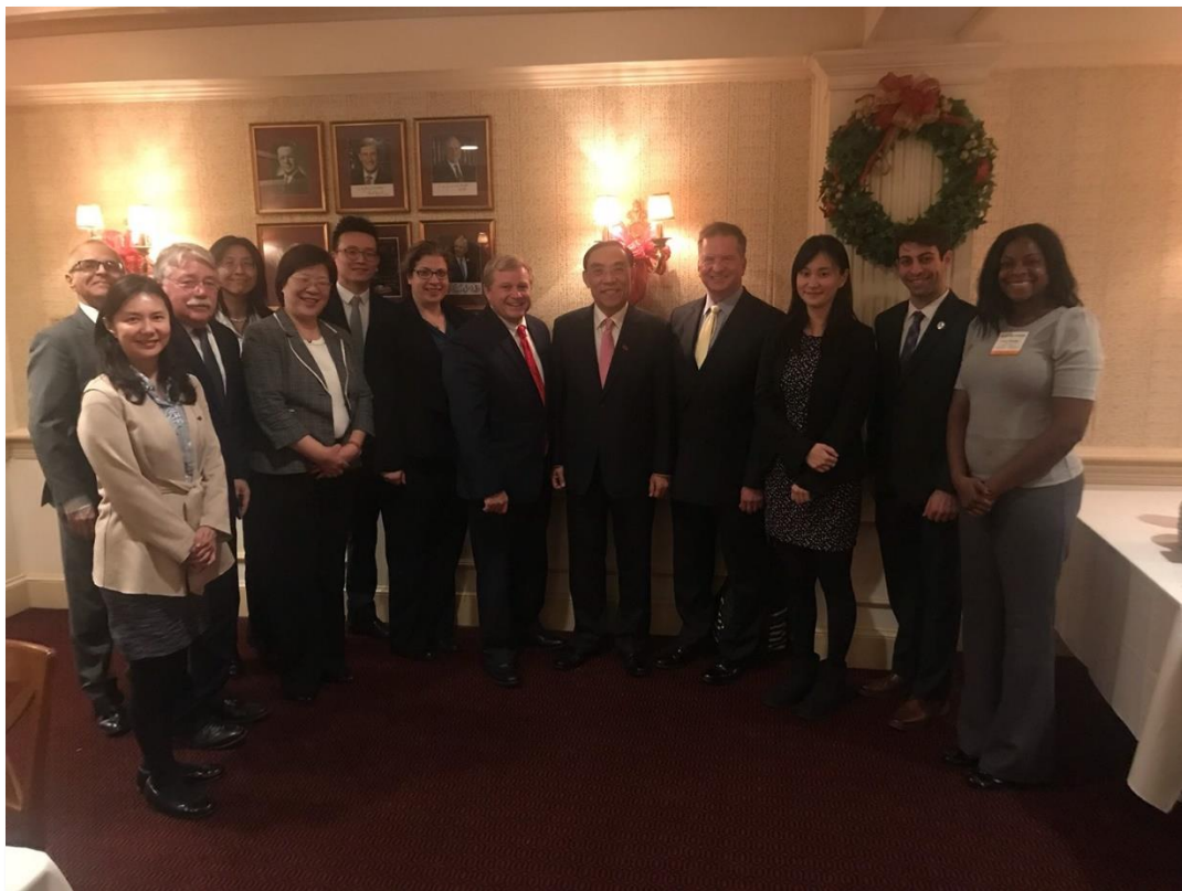
與 NAAG 成員於 The Monocle 餐廳晚宴合影