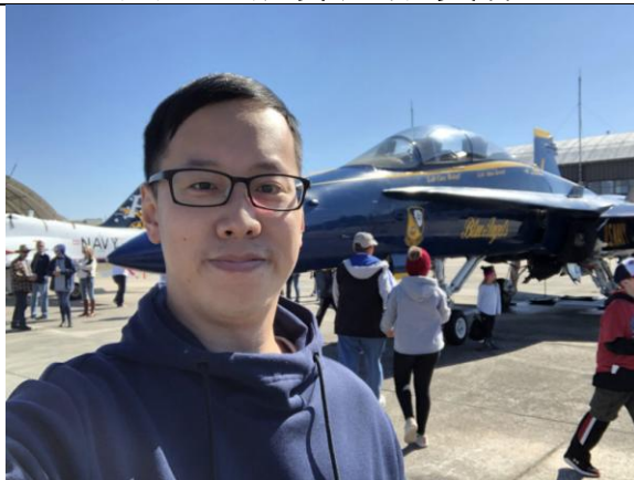
圖 5、美國海軍基地參訪