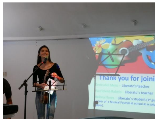
Round Table 的分享交流

下午同樣是公開展覽，因為這是最後一天，所以參觀人潮更多，到 9 點結束後則是文化之夜，場地即是 1 樓的用餐區。臺上有各國學生表演傳統舞蹈及音樂，參加者即使沒有表演也著傳統服裝，也有學生會帶著小紀念品、徽章或甚至銅板來交換，尤其是年紀較小的學生，人手一袋，都是有備而來要來交換的，因此思竹同學最後也得到很多來自各國的紀念品。活動很熱烈，一直到 11 點才結束，參匆忙得回到展區卸展後，搭接駁車回飯店，回程在車上氣氛很熱絡，同學們打成一片，還在車上玩遊戲。