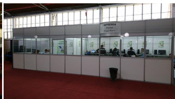
舞臺及旁邊一整排的辦公室，包含媒體、服務臺、販賣展覽相關用品、交通服務等