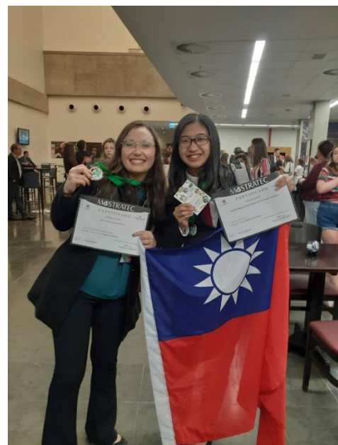
頒發臺灣國際科展特別獎及思竹上臺領獎，以及會後與觀光行程結識之巴西同學合影