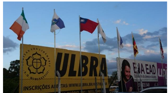
展覽會場：Fenac 展覽中心及入口處的各國國旗