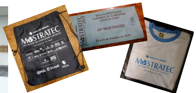
會場入口、報到處，入口地圖資訊，以及領到的物品。