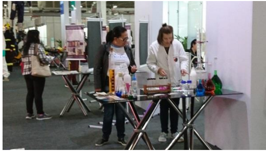
博覽會區各式攤位及踩高蹠的折氣球小丑