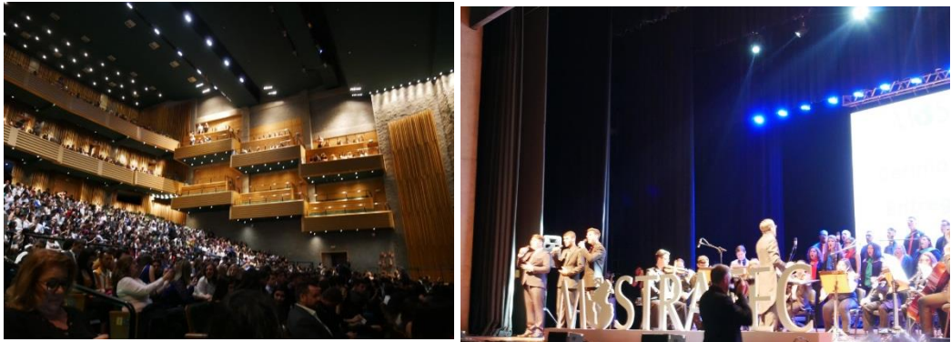
頒獎典禮的場地是音樂廳，以及開場的樂團表演

該獎項所有得獎者上台後，攝影師拍照不同角度的二、三張照片後即下臺。頒獎典禮結束後，思竹也和幾位巴西或其他國家同學合影後，依依不捨的道別。