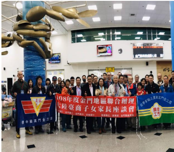
金門水頭碼頭出發