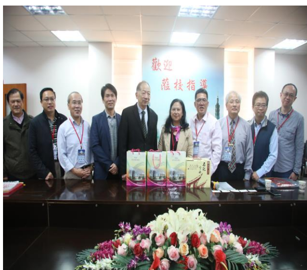
上海臺商子女學校女互相交流 3