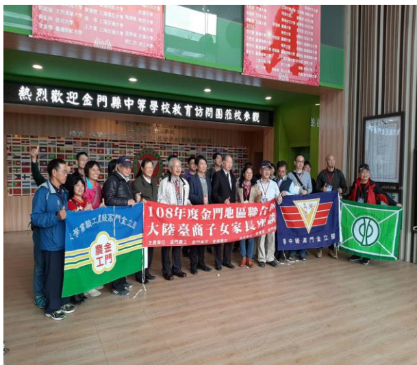
上海臺商子女學校女互相交流 1