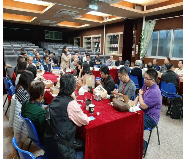
上海華東臺商子女學校 2