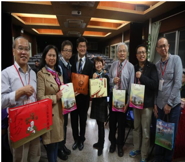
上海華東臺商子女學校 3