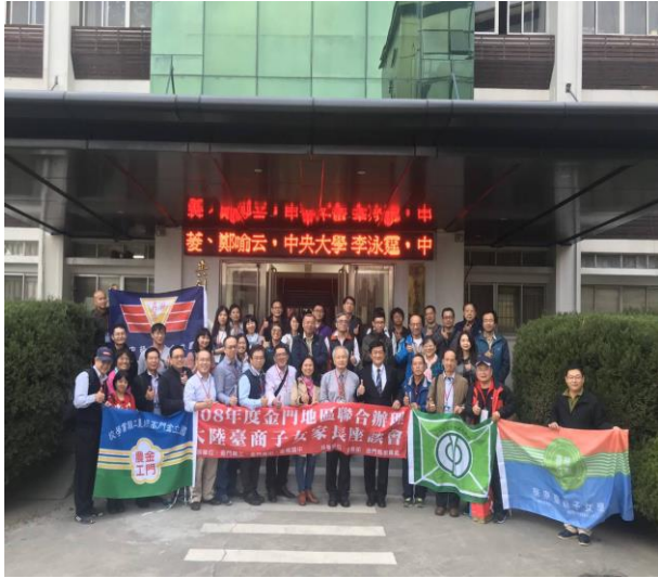
上海華東臺商子女學校 1