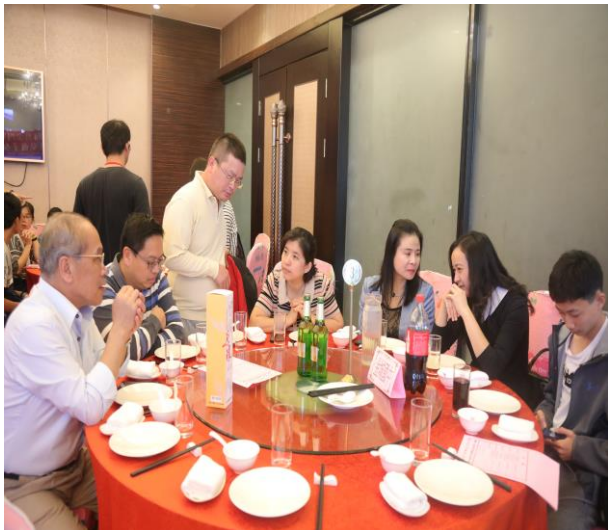
金城國中家長與導師交流