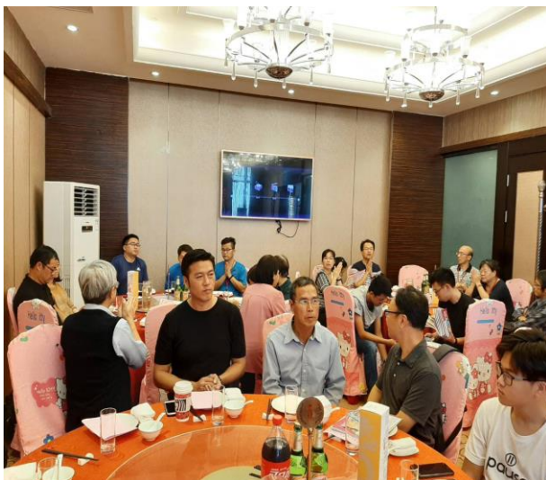
金門農工家長與導師交流