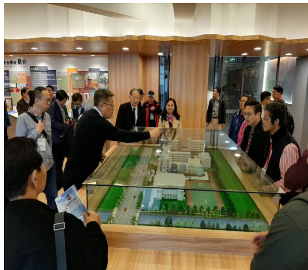
上海臺商子女學校女互相交流 2