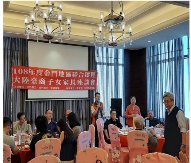
家長座談各校校長報告校務