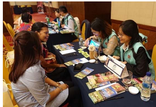
棉蘭推廣會中本會與業者之互動