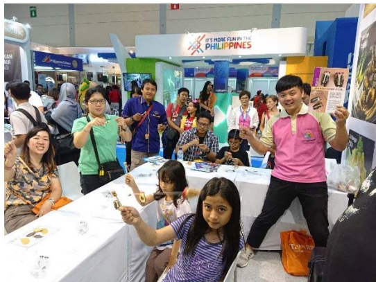
臺灣館竹蟬 DIY 受大小朋友歡迎