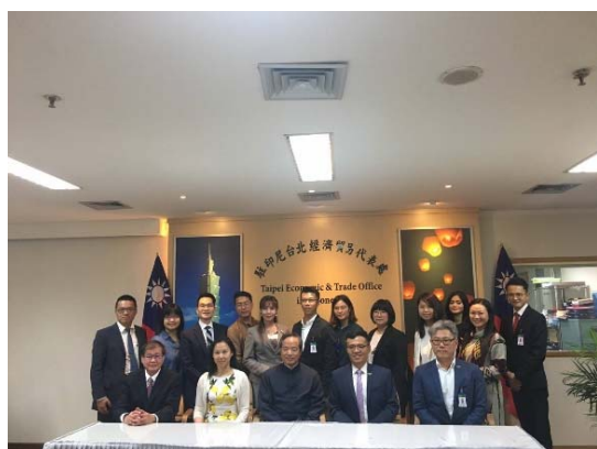
於駐印尼臺北經貿代表處合影