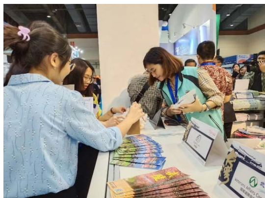
印尼民眾對綿羊毛 diy 極有興趣