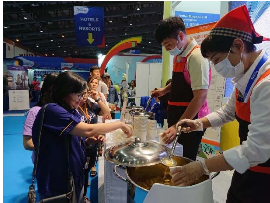
檸檬愛玉品嚐活動大受歡迎