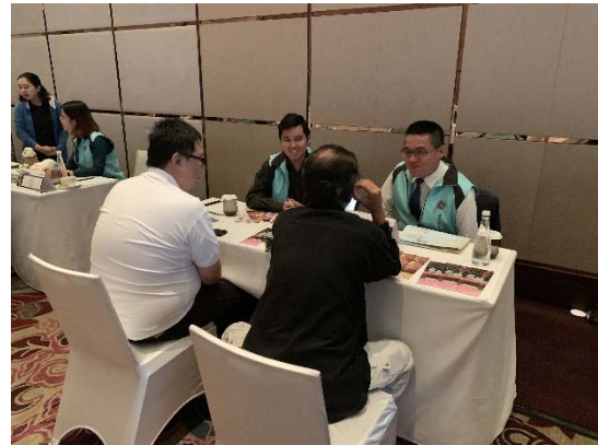
雅加達推廣會洽談情形