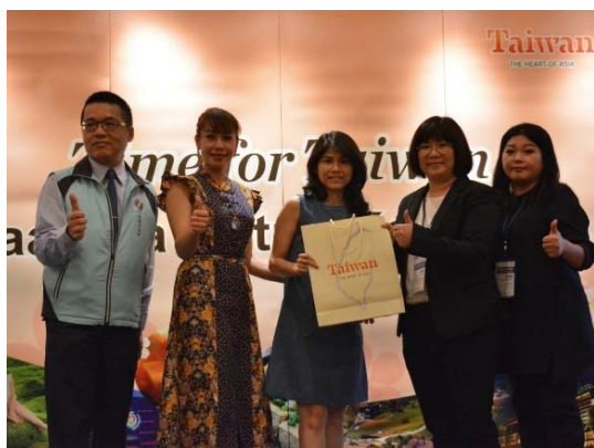
觀光推廣會致贈本會抽獎獎品