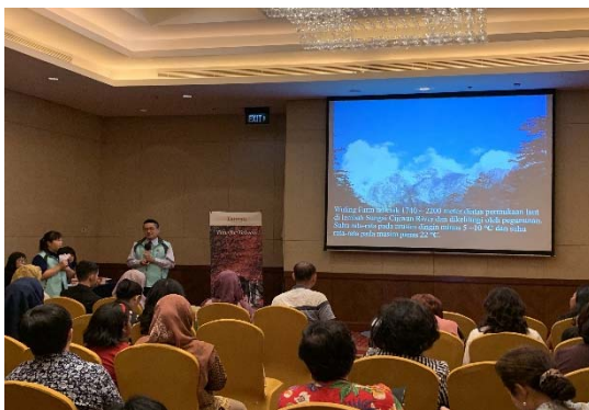
本會於棉蘭推廣會之簡報