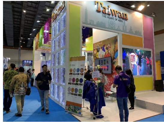
本次臺灣觀設計意象