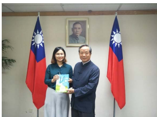
清境農場致贈陳大使農場自產茶葉