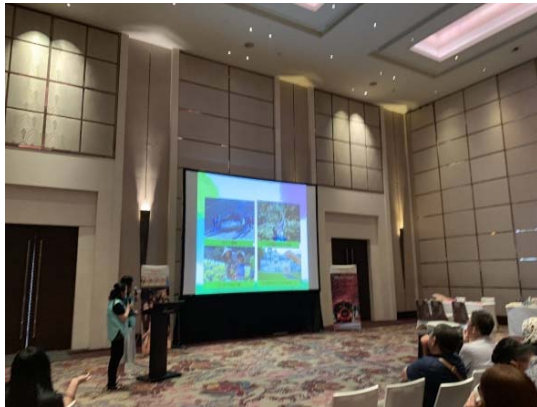
本會於雅加達推廣會上簡報