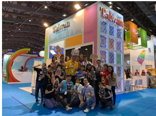
臺灣代表團於臺灣館合影