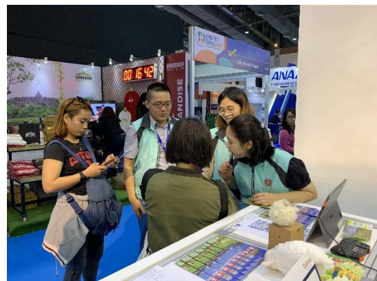
印尼民眾打卡按讚換茶包