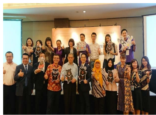
參加棉蘭觀光推廣會臺灣團全體代表