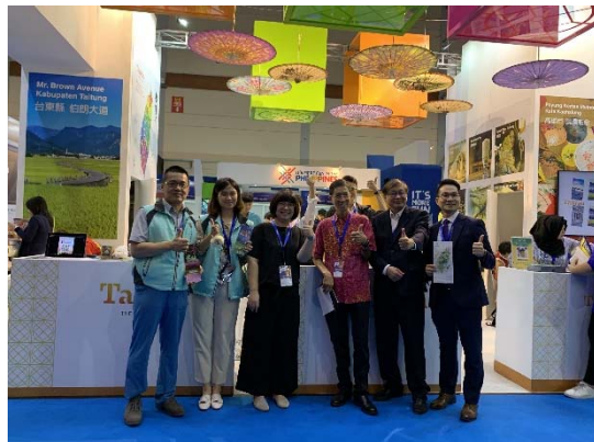
本會參展人員與業者合影