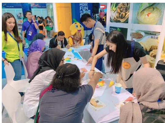
印尼民眾踴躍參加體驗活動