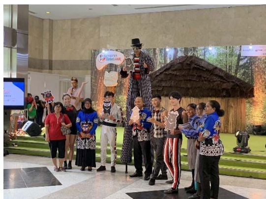
福爾摩沙馬戲團於展場精彩演出