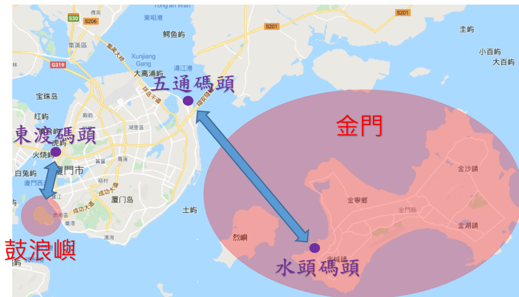
圖 9：鼓浪嶼及金門往返廈門碼頭地圖。

「鼓浪嶼」為廈門熱門的觀光島嶼，於 2017 年被聯合教科文組織認定為世界遺產，從廈門島西岸的東渡碼頭到鼓浪嶼的航行時間約為 20 分鐘，和前往金門的交通方式和時間成本上相似，兩者同屬靠近廈門本島的海島，使二者間具有可比性。