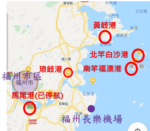
圖 3：福州及馬祖小三通碼頭地圖。