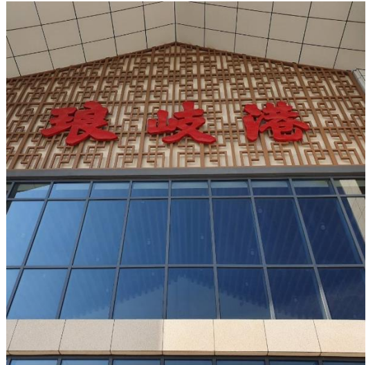
圖 4：108 年 5 月開航的琅岐港(拍攝時間：108.12.16)。

雖琅岐港較福州市市區及福州長樂國際機場較近，但往返馬祖之航行時間較黃岐港為長，且黃岐港發展時間較早，福州居民多已習慣由黃岐港往返馬祖。另目前自馬尾琅岐至馬祖船班僅上午 9:00 及下午 15:30 兩班、馬祖至馬尾琅岐僅上午 11:00 及下午 13:30 兩班，不利於發展福州至馬祖一日遊行程。據當地業者表示，琅岐港自開航以來人潮不多。