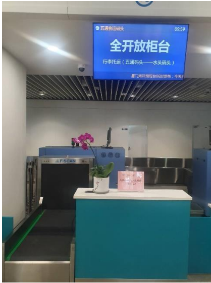
圖 14：五通碼頭的行李托運櫃臺 （拍攝時間：108.12.18）。

行李托運方面，部分航空公司提供「金廈一條龍」服務，從廈門出發經金門中轉來臺灣本島的部分旅客，行李將由航空公司協助直接運送至機場，毋庸掛兩次行李，可節省時間。惟因運送空間及人力有限，旺季時可提供一條龍的位置較少，多由旅行社訂走，一般旅客難訂，仍需自行自水頭碼頭取完行李再帶到機場做二次託運。