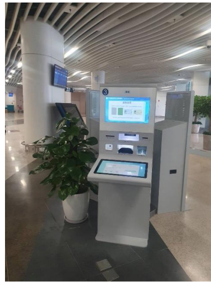
圖 15：五通碼頭的自助報到機 （拍攝時間：108.12.18）。