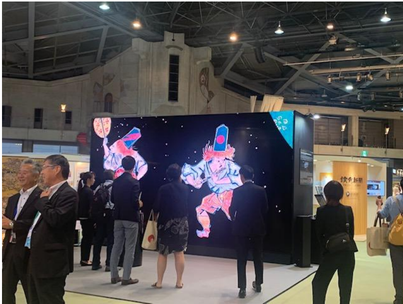
(圖二) 博物館博覽會會場之 8K 互動裝置