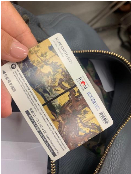
(圖十五) ICOM 特製的地鐵卡(使用期限:會期七天限定)