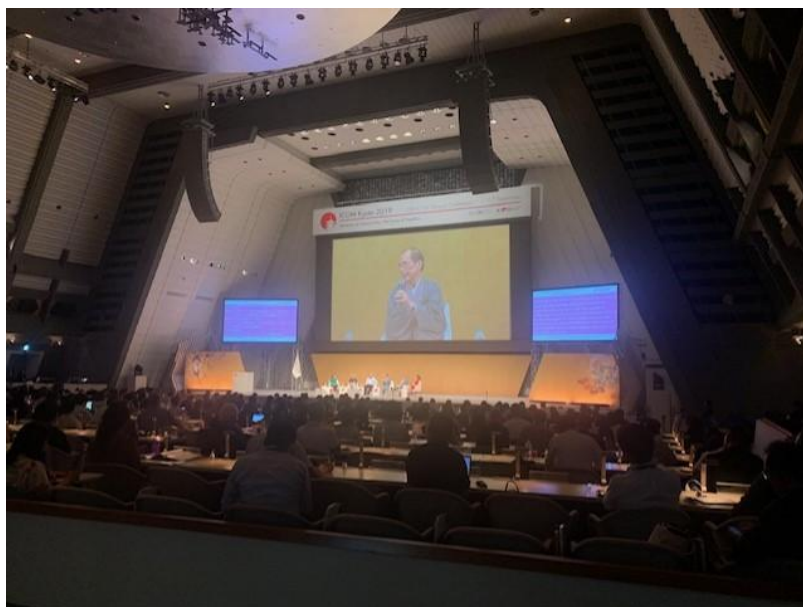
(圖一) 主題演講會場

及設計博物館委員會(International Committee for Museums and Collections of Decorative Arts and Design，簡稱 ICDAD)會議中進行報告，並參加大會及該委員會舉辦之移地會議(offsite meeting)以及實地參訪(excursion)等相關活動，期盼能與相關領域的學者及策展人們分享工作成果並交換心得。