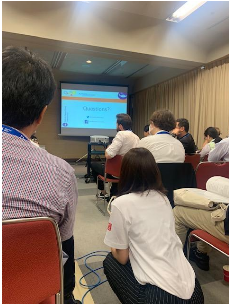
(圖三) 出版與寫作工作坊