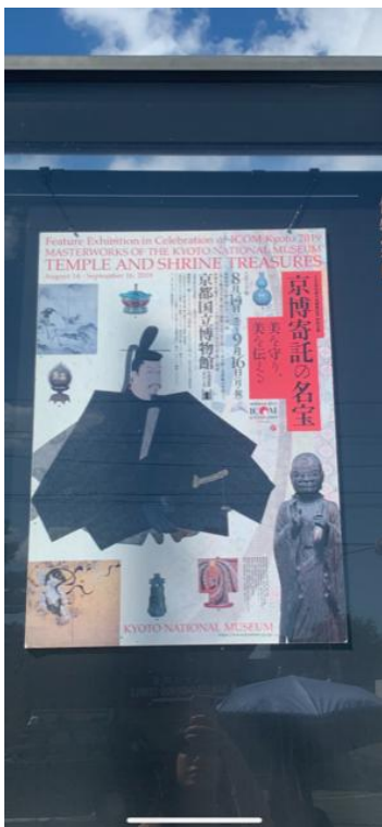
(圖十二) 會場外之展覽帆布裝置