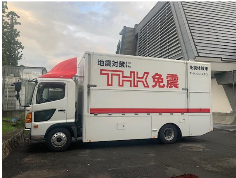
(圖七) 免震車(可上車體驗，會場並另有免震台裝置)