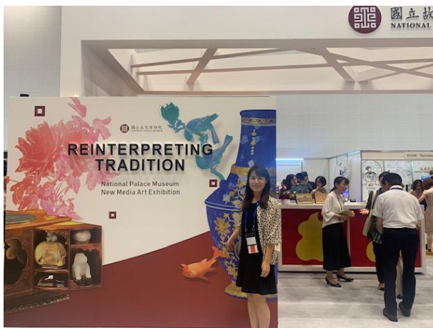
(圖六) 博物館博覽會場中的故宮展示區域

本次會議行程，參與之主要部份以主題演講、工作坊及裝飾藝術委員會之研究討論會為主，並搭配參訪京都市內之寺院及博物館。同時也到博物館博覽會的故宮展示位址(圖六)以及會場蒐集新資訊(圖七、八)。以下，擇要敘述之：