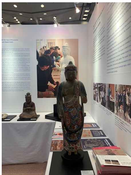
(圖八) 可供視障者觸摸的複製文物