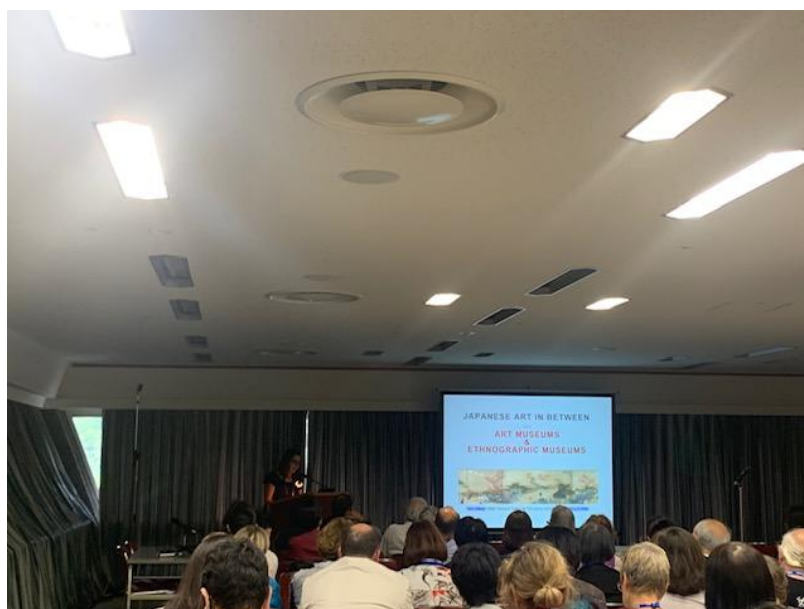
(圖十) 聯合報告會會場