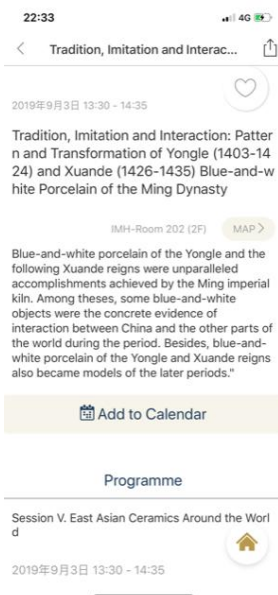
(圖十六) ICOM 會議期間 app 可以查詢各類訊息，也會主動提醒各種會議、工作坊及活動時程