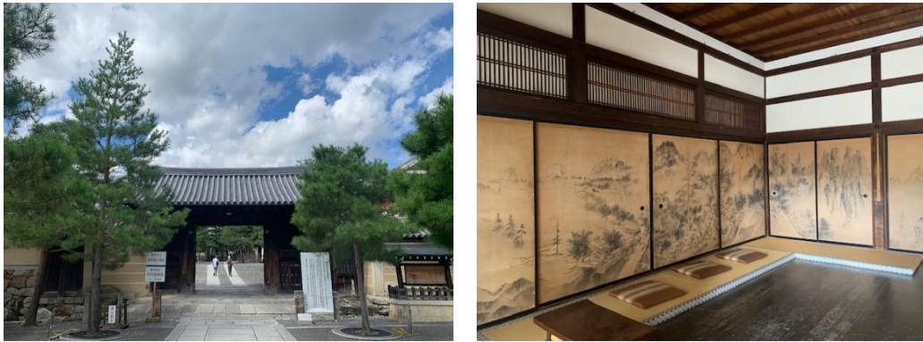
(圖五) 大德寺入口及室內壁畫(壁畫為摹本)