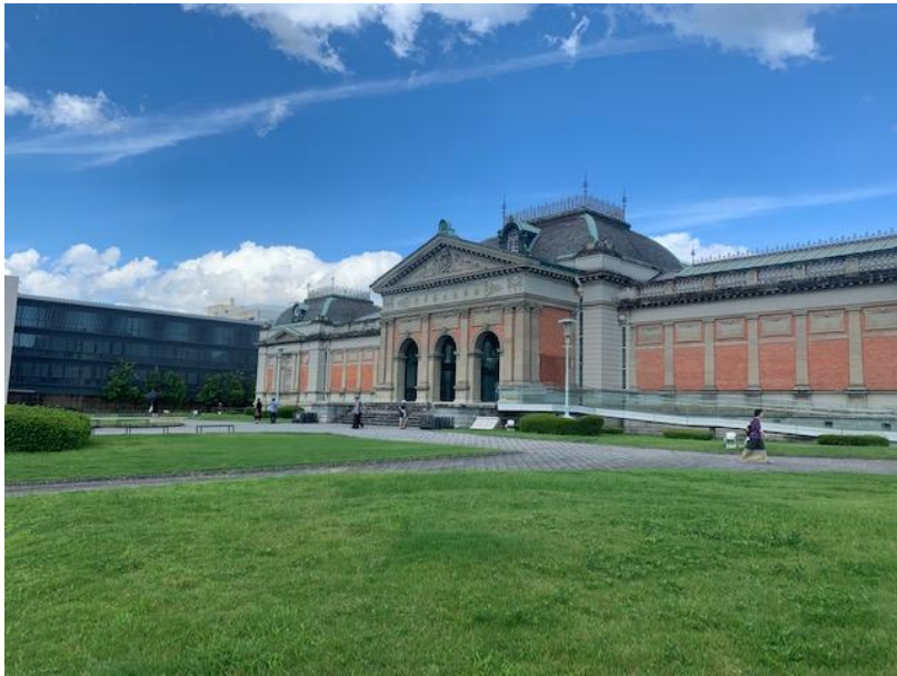
(圖十一) 明治古都館