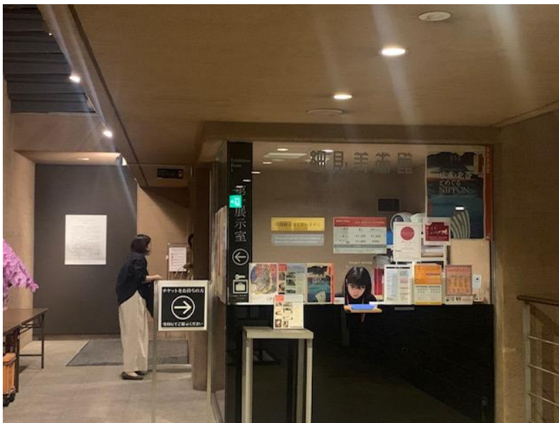
(圖四) 細見美術館的夜間特別參觀