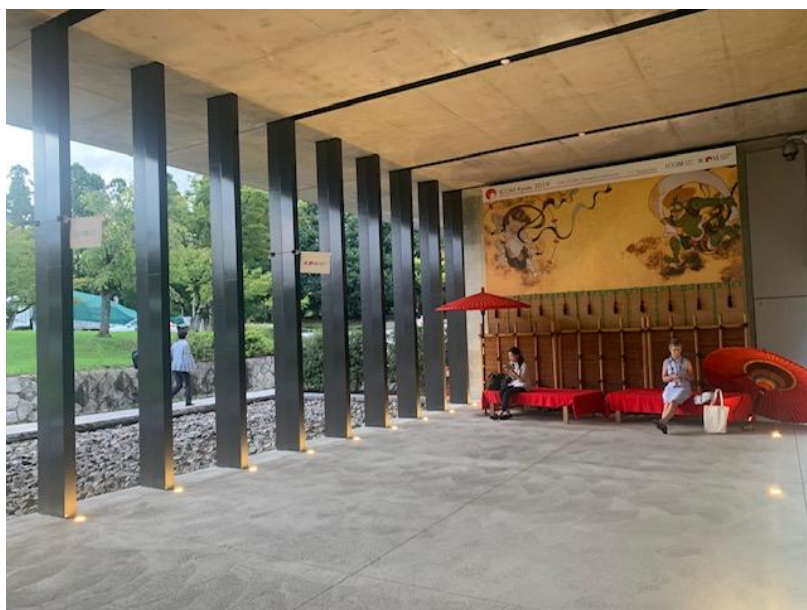
(圖十四) 進入會場路程中的一處布置

滿是各式宣傳影像及符合現代人拍照需求的景點布置(圖十四),可以清楚感受到 ICOM 大會的確是京都整個城市的盛事。古都京都自有其豐富的文化底蘊可以容納群聚而來的博物館人士,但相關細緻的配套措施,諸如印有 ICOM 圖像的專屬地鐵卡片(圖十五)、每日不斷推播大會最新訊息的 ICOM app(圖十六),夜間特別開放給與會人士的二条城、東寺文書參觀、北山地區植物園及天文台及能劇展演等,都讓人印象深刻。