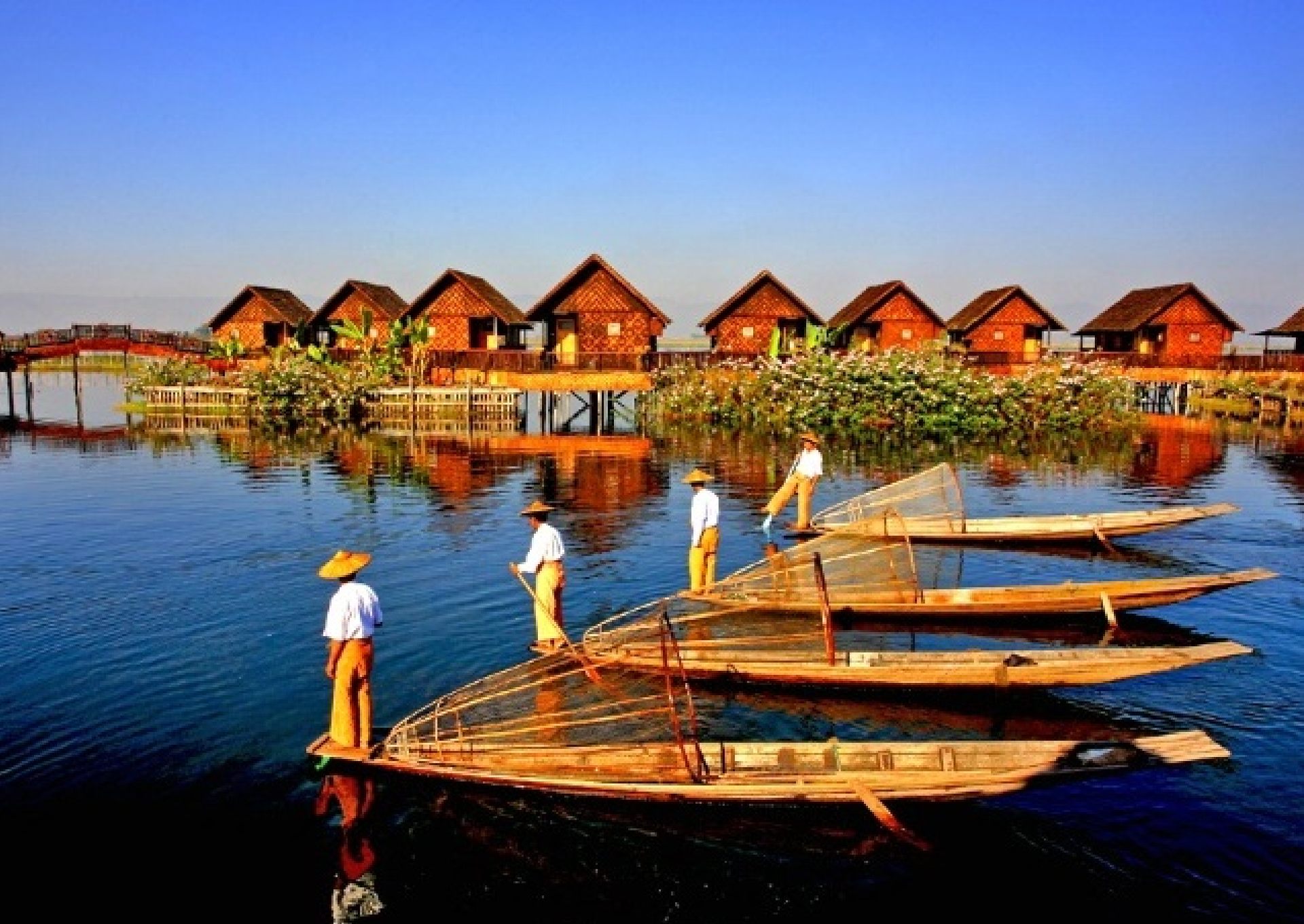
茵萊湖 ( Inle Lake ) 是位在緬甸撣邦撣部高原的湖泊。面積116平方公里，是緬甸有名的觀光地。