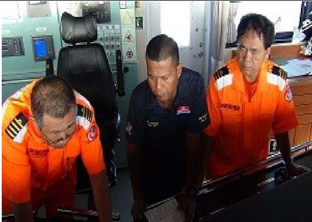
說明：07 月 18 日與吉國交流規劃區域。