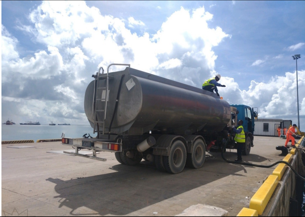
說明：07 月 14 日補給用油情形。