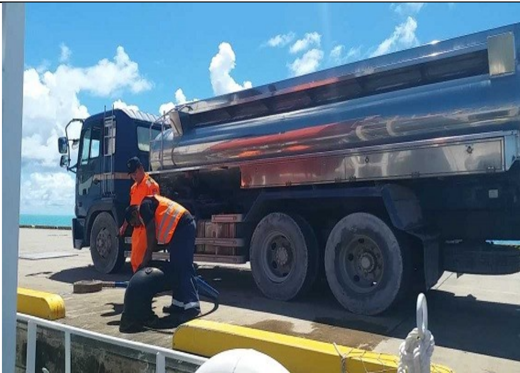
說明：07 月 13 日補給船上用水。