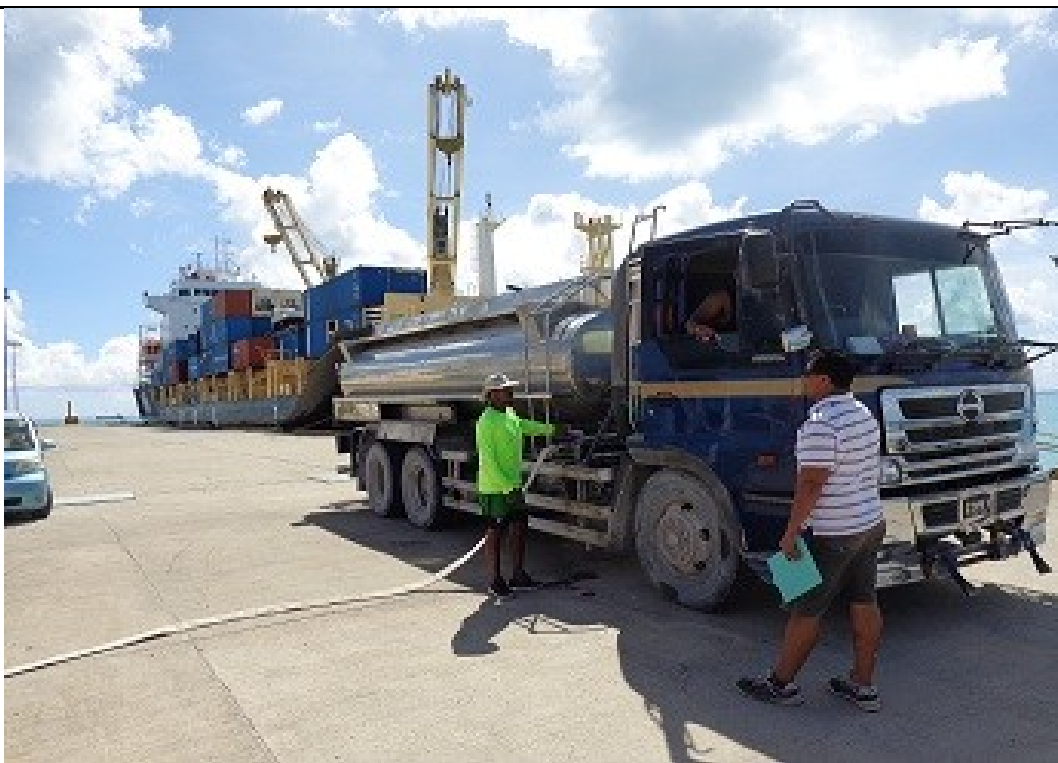
說明：07 月 14 日補給用水情形。