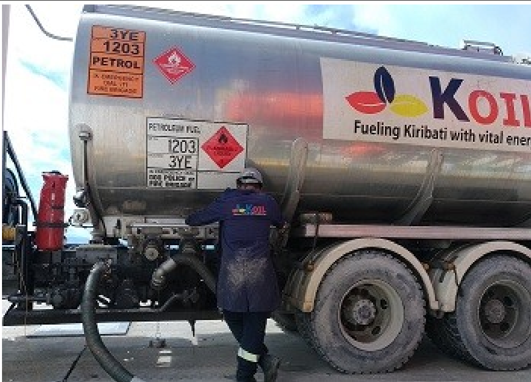
說明：07 月 15 日補給用油情形。