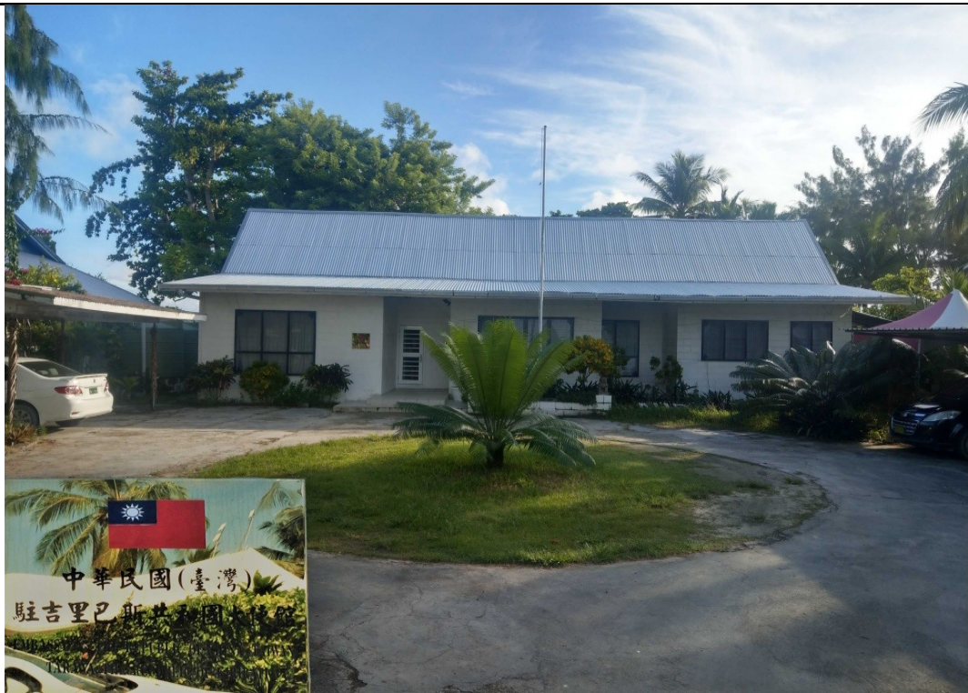
說明：07 月 14 日拜會駐吉里巴斯大使館。