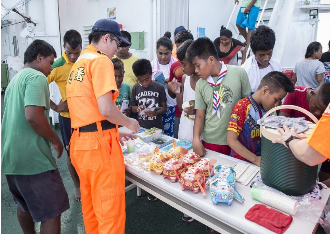
說明：07 月 10 日民眾參訪(發放台灣特色文宣品)。