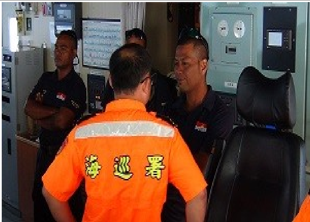
說明：07 月 18 日與吉國交流。