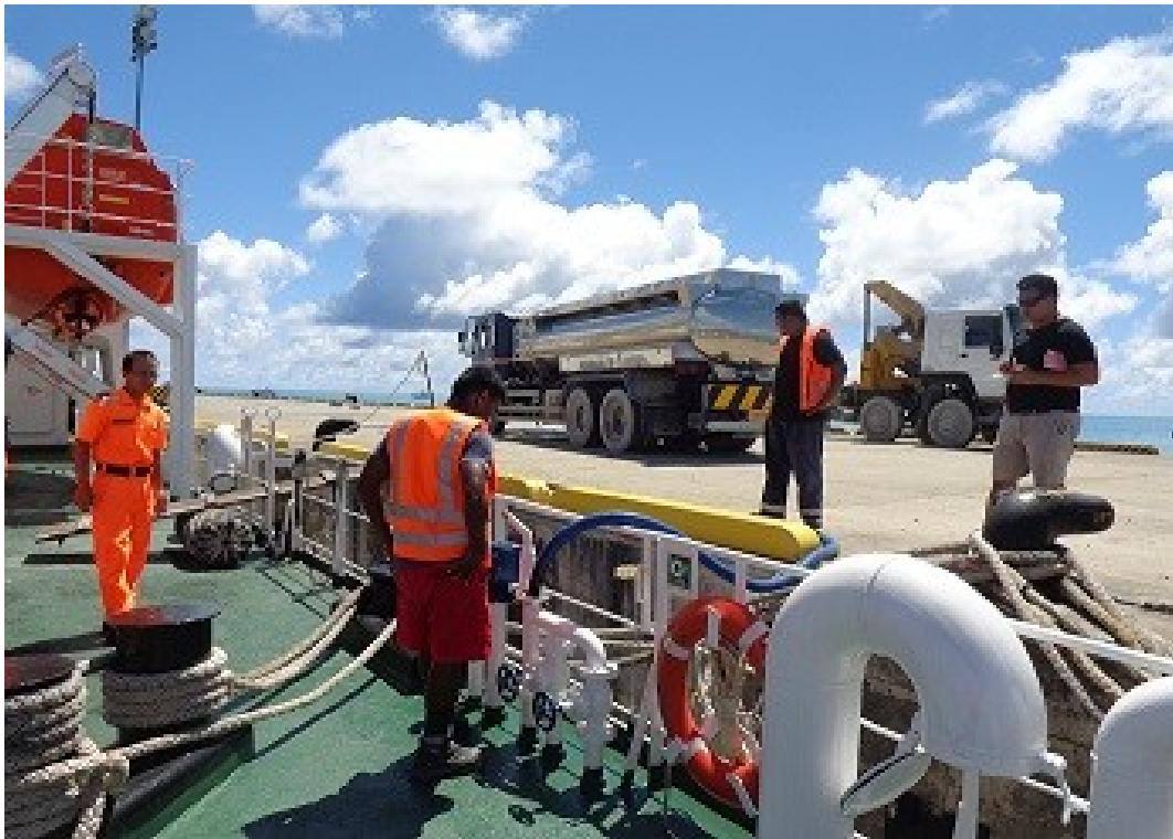
說明：07 月 15 日補給用水情形。