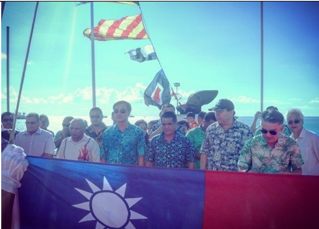
說明：07 月 13 日中華民國與吉里巴斯共和國聯合升旗典禮。