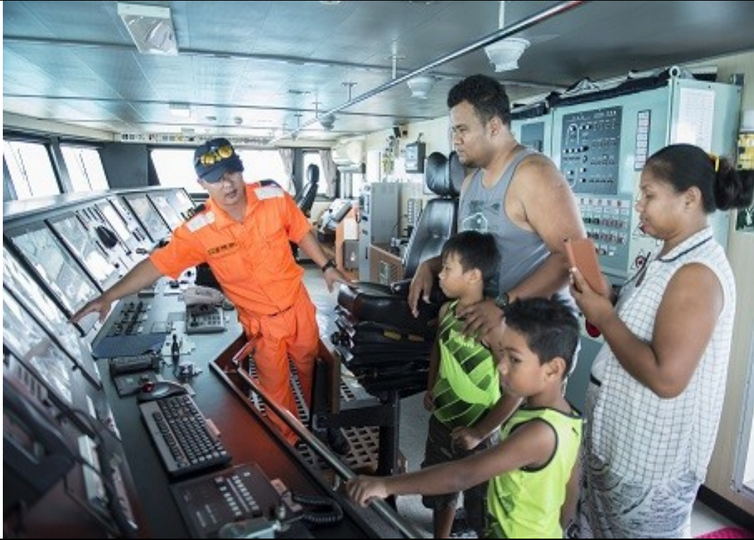
說明：07 月 13 日民眾參訪船體介紹。