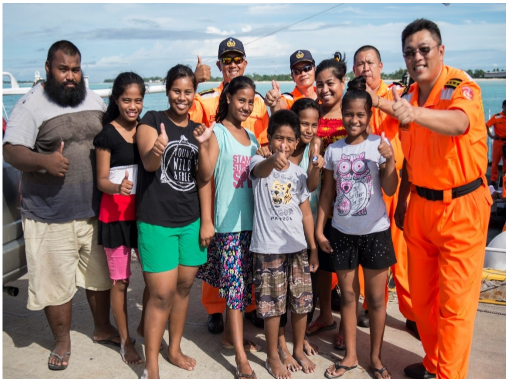
說明：07 月 10 日民眾參訪 (與當地民眾合影留下美好回憶)。