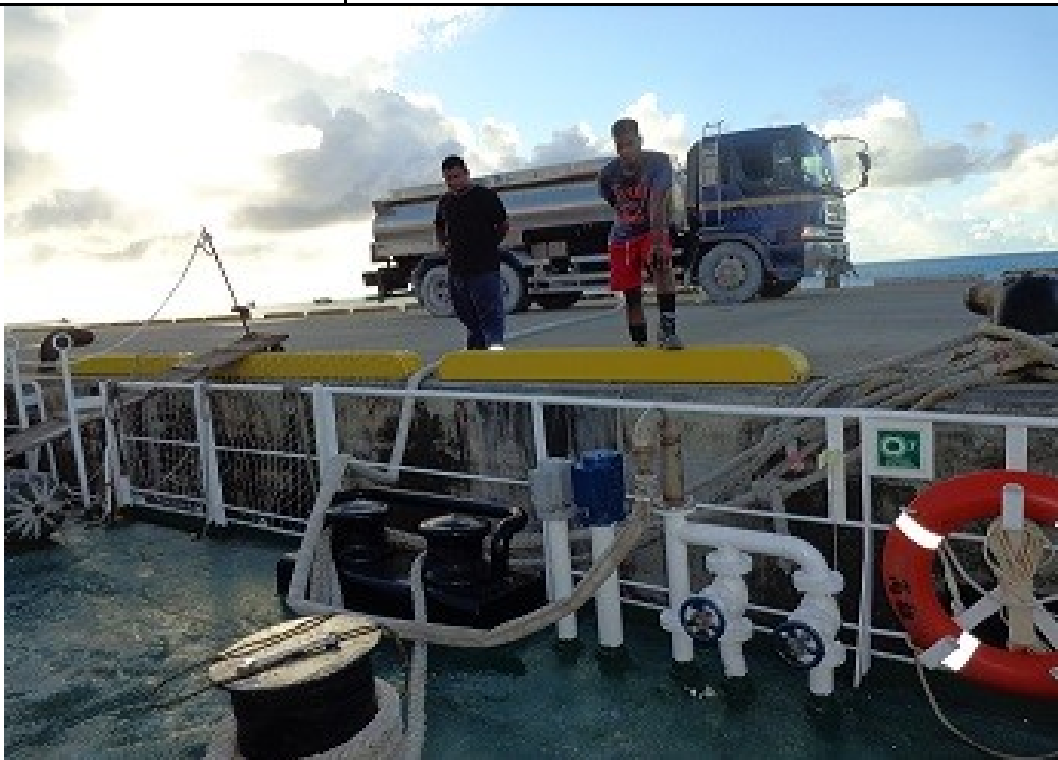
說明：07 月 14 日補給用水情形。