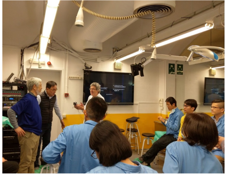
第三天小組討論，老師們回答學員問題