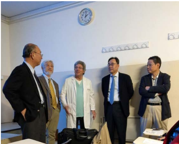
第一天課程各位講師