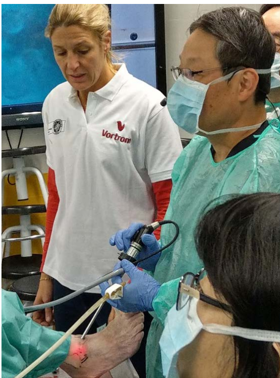
高尾教授示範踝關節鏡手術