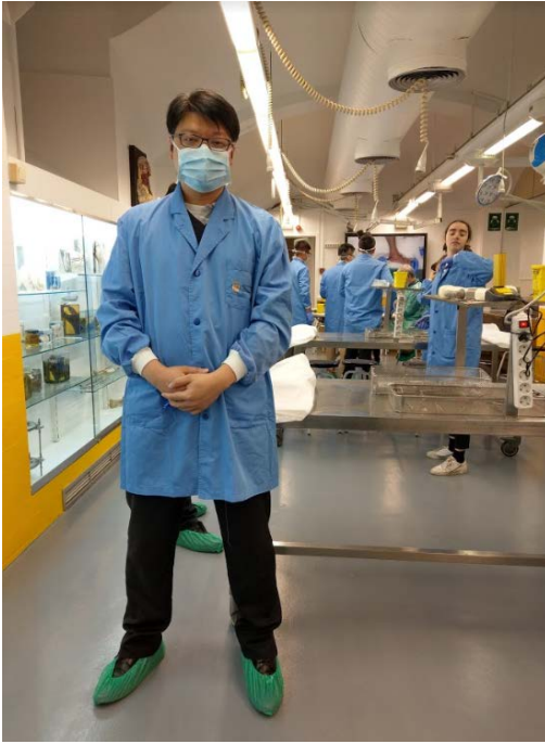
第三天大體課程開始前照片