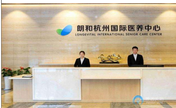
圖七、機構參訪-朗和國際醫養中心