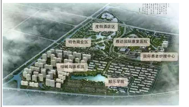
圖六：機構參訪-烏鎮雅園