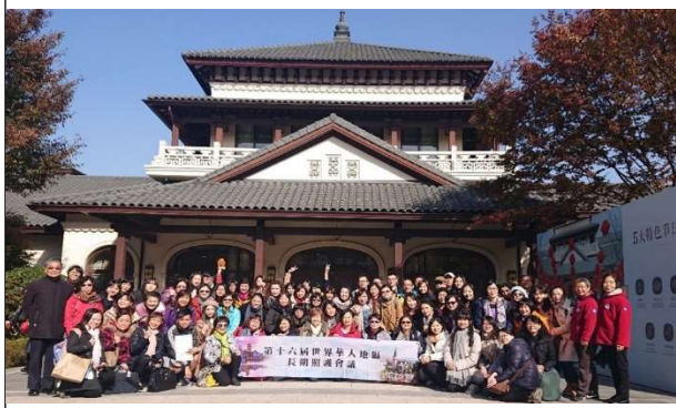
圖五、烏鎮雅園-參訪成員合影