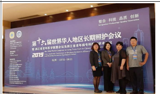
圖四、參與同仁合影