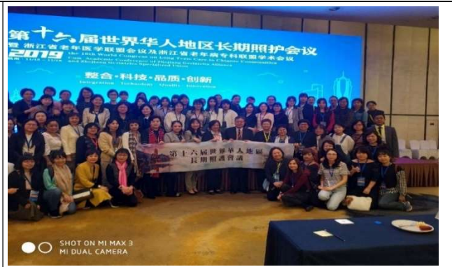
圖二、大會開幕式臺灣學員合影