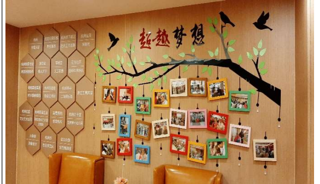
圖八、機構參訪-朗和國際醫養中心