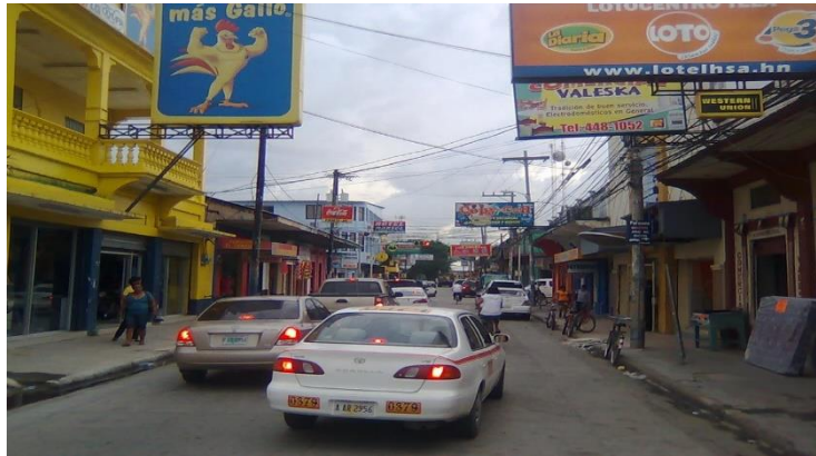
圖 2.1 宏都拉斯-阿特蘭蒂達省-特拉市區

CIPSE 第 8 屆年會地點在宏都拉斯阿特蘭蒂達省特拉市舉行。特拉市為人口約十萬人的渡假小鎮，緊鄰加勒比亞海，以作為香蕉出口港口而聞名，在特拉市沒有觀光地區的商業化與喧嘩，惟有在海灘可見許多大型渡假飯店林立。