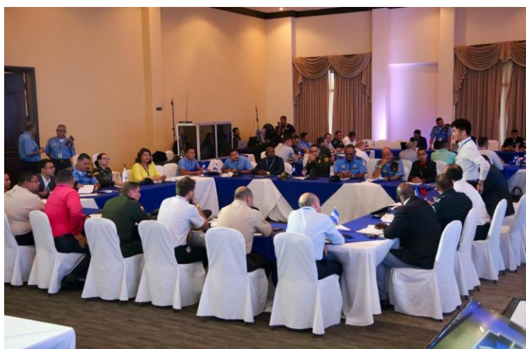
圖 3.3 我訪團參與圓桌論壇工作小組討論

本論壇係由與會代表分組討論反綁架國際規章擬定事宜，我訪團與智利、阿根廷、巴拉圭及宏都拉斯為同一組，會議討論事項包含反綁架人員課程培訓內容制定、反綁架部門國際認證標準、CIPSE 成員間緊急通報機制及擬定受害者援助指導方針。