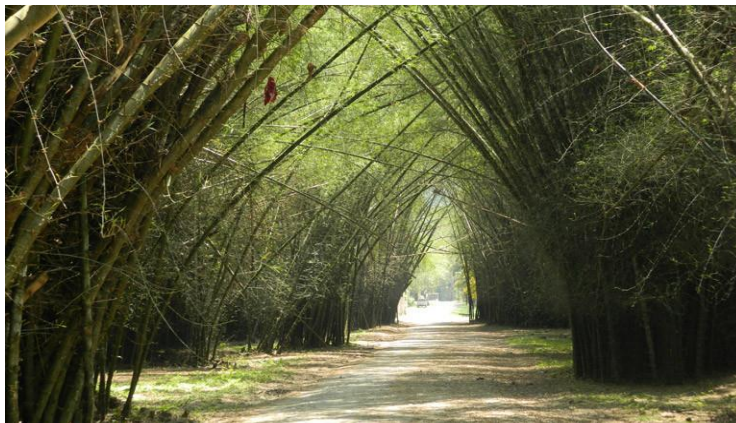
圖 2.12 藍樹提拉植物園著名的竹林隧道

此次大會亦規劃半日參訪行程，造訪宏國最大(世界第二)的熱帶植物園-藍樹提拉(Lancetilla Botanical Garden)，讓與會者體驗當地文化活動與自然美景，為此趟旅程增添不少深度與樂趣。該植物園位於加勒比海度假小鎮特拉市，離此次會議場館僅需 10 分鐘路程，沿途視野所至，盡是香蕉叢和甘蔗園。藍樹提拉植物園建於 1926 年，是美國聯和水果公司(United Fruit Company)的植物實驗場，在此培育世界各地的經濟作物，成功培植後再大量推廣，利用當地廉價勞力及土地種植出口，可以說是資本主義於南美洲發展的歷史遺跡，直到 1972 年，整個園區才歸還給宏國，繼續經營現在的規模，成為世界上第二大熱帶植物園。園方於導覽前細心提供了防蚊衣物及防蚊液，由於行前已獲知宏國為登革熱、茲卡病毒及屈公病疫區，參訪人員對於自身的防蚊措施，絲毫不敢鬆懈。