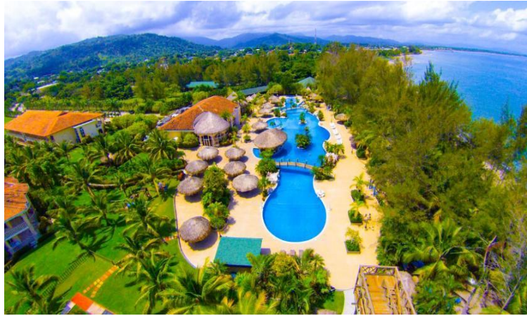
圖 2.3 本次年會地點 La Ensenada Beach Resort & Convention Center

開幕典禮會場可容納數百人，舞台兩側各架設 1 個大型投影布幕，讓在後方的與會者也能清楚觀看舞台上的情況。會場兩處清晰可見主辦單位在舞台兩側擺設與會國的國旗，亦包含我國國旗，筆者此次在國際場合見到臺灣國旗與其他國家國旗並列，心中十分雀躍。