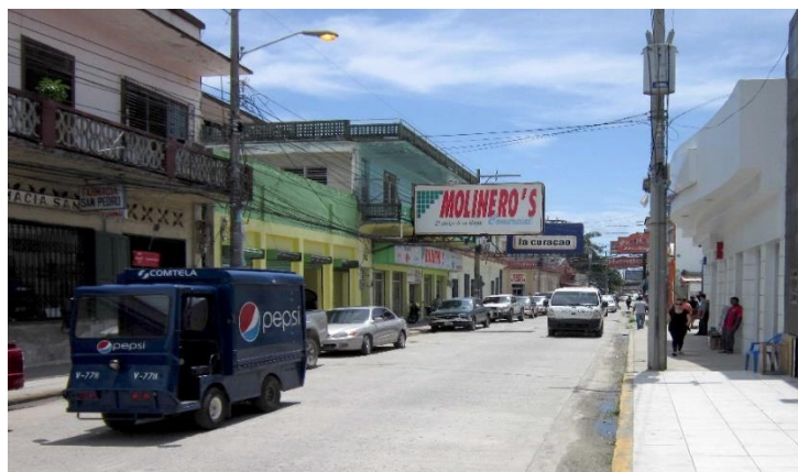
圖 2.2 宏都拉斯-阿特蘭蒂達省-特拉市區

此次年會開幕典禮在(La Ensenada Beach Resort & Convention Center)渡假飯店舉行，總計 CIPSE16 個成員國及美國、加拿大、法國、荷蘭、瑞士、牙買加、千里達與我國計 24 國派遣中央或地方執法人員參加。CIPSE 年會所建構的警政交流平台，促使各執法機關得以藉此互動，透過講習、訓練及會議討論，與會人員彼此可進行情資分享、經驗交換並建立聯絡窗口。