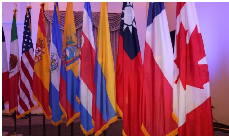
圖 2.4 開幕典禮會場我國國旗與其他國家並列

開幕典禮會場可容納數百人，舞台兩側各架設 1 個大型投影布幕，讓在後方的與會者也能清楚觀看舞台上的情況。會場兩處清晰可見主辦單位在舞台兩側擺設與會國的國旗，亦包含我國國旗，筆者此次在國際場合見到臺灣國旗與其他國家國旗並列，心中十分雀躍。