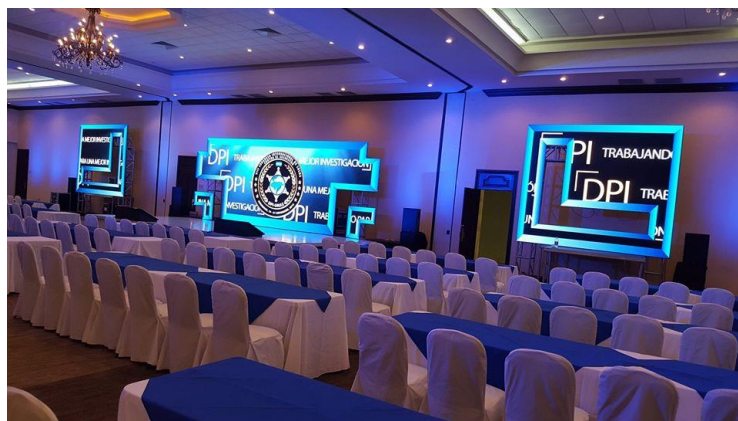
圖 2.5 開幕典禮會場一覽