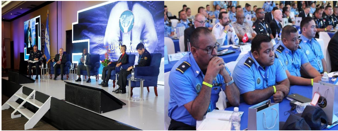
圖 3.1 小組討論-資訊與通信技術於打擊綁架之應用