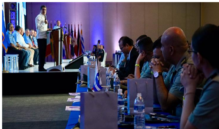
圖 2.7 宏國總統 Juan Orlando Hernández 於開幕儀式致詞

宏國總統 Juan Orlando Hernández 致歡迎詞時表示，宏都拉斯雖是個小國，但具有巨大的旅遊業潛力，近年來治安的改善使得國家在經濟及旅遊方面取得成長，相較區域其他國家經濟停滯不前，宏都拉斯今年仍有百分之三增長。這次會議對宏國意義深遠，因為綁架在宏國是一個高度敏感的議題，2009 年和 2010 年，宏都拉斯曾經是中美洲受暴力犯罪影響最深的國家，平均每 10 萬人中有 90 人因暴力犯罪而死亡，謀殺率曾經高居全球之冠，尤其在特拉市，幫派份子、毒梟與當地司法人員勾結，串起巨大的犯罪網絡，戕害人民。經過為期多年的警政改革，宏國在治安上取得令人欣慰的成就，犯罪率已經明顯下降很多，除了政府在警政改革上投注了前所未有的心力，大幅淘汰不適任的警察，還要歸功民眾與司法人員的合作、國際社會的支持以及宏都拉斯人民善良的承諾。此外，最為重要的是，宏國能從歷史和其他國家朋友們的經驗汲取教訓，這也是為何大家今日齊聚於此之目的，宏國願意與各位分享曾經犯過的錯誤及每次改革前進的步伐，也希望在座與會者能攜手共同對於人民的安全作出努力。