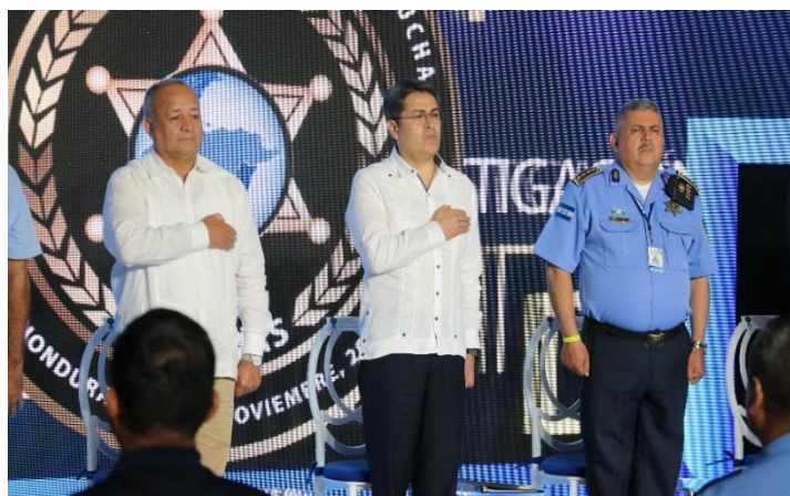
圖 2.6 宏國總統、公安部長及警政署長主持開幕儀式