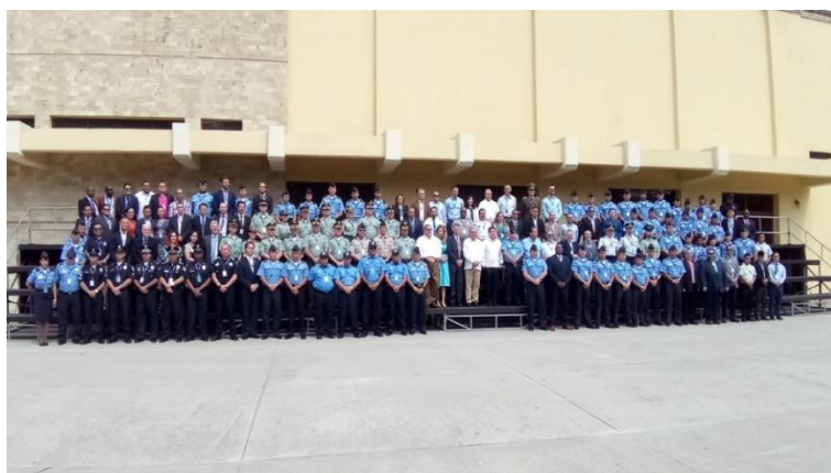
圖 2.9 全體與會人員於開幕典禮合照

警政署長 José David Aguilar Morán 於致詞時特別強調，宏都拉斯國家警察近年來所進行的的大規模改革工作，其中一項是成立「國家警察革新暨轉型特別委員會」（Comisión Especial para la Depuración y Transformación de la Policía Nacional），該委員會在 2016 年至 2019 年之間就超過 1 萬 3,500 名警察人員進行適用評估，從警政機構中調整及剔除了約 6 千名貪腐、犯罪分子和不適任人員。除了對人員素質進行深入的評估外，特別委員會也在國家警察的體制改革方面發揮了重要作用，包括法令的現代化、組織結構調整、教育系統的重新設計、研議招聘標準，風紀單位的建立，情報和刑事調查能力的強化，基礎設施與設備的汰舊、行政程序革新及預算和後勤作業的調整，並加強建立社區對警察間的信任關係，宏都拉斯正在進行近幾十年來拉丁美洲無可比擬的警政改革。