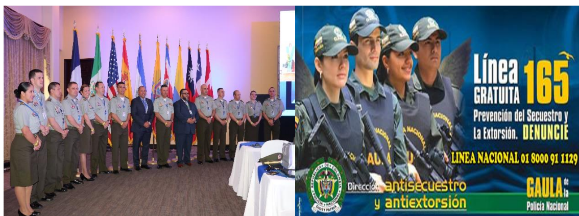
圖 3.2 哥倫比亞訪團及該國打擊綁架統一行動小組(GAULA)165 反綁架專線

了約 1.5 萬名墨西哥警察及 500 名反綁架人員。根據費爾南多指揮官的說法，人質的安全最至高無上，應由專責的人員陪同家屬與綁架者進行談判，以確保人質生存，任何誤判可能產生無以彌補的結果，唯有訓練有素的人員才能將風險降至最低。他另補充綁架案件的絕對優先事項是挽救人質的生命，其次，進行調查以收集犯罪證據並將歹徒繩之以法。第三，尋求人質家屬經濟最小損失，在綁架者的要求與人質家庭的經濟之間盡可能取得平衡。