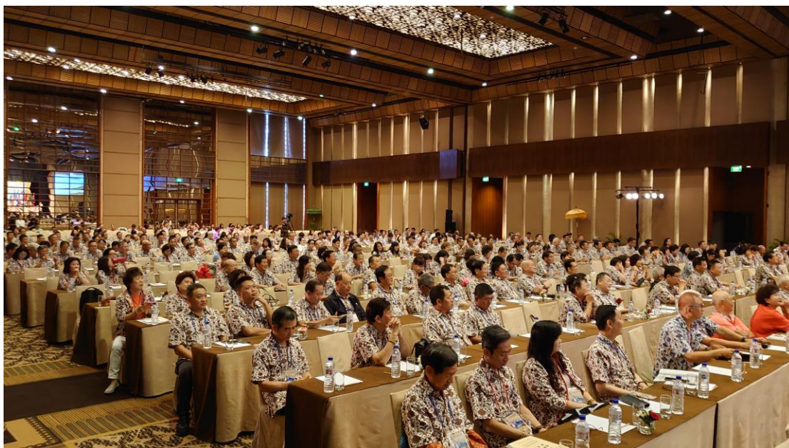
12月1日亞總第27屆第2次理監事聯席會議現場