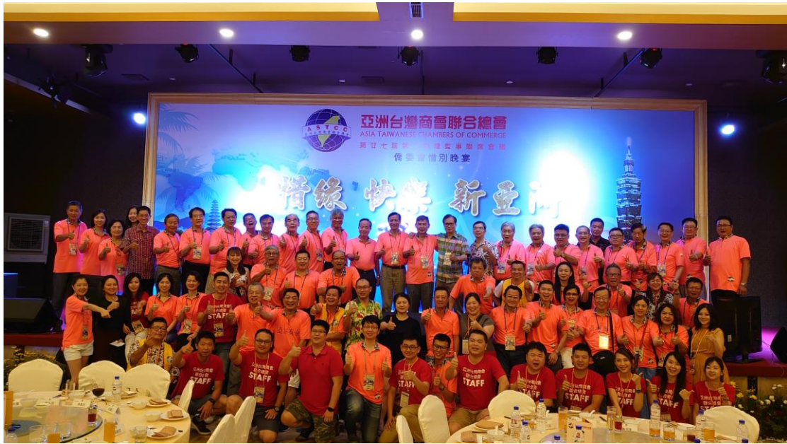
12月2日僑委會惜別晚宴肯定印尼僑臺商團隊籌辦會議圓滿成功