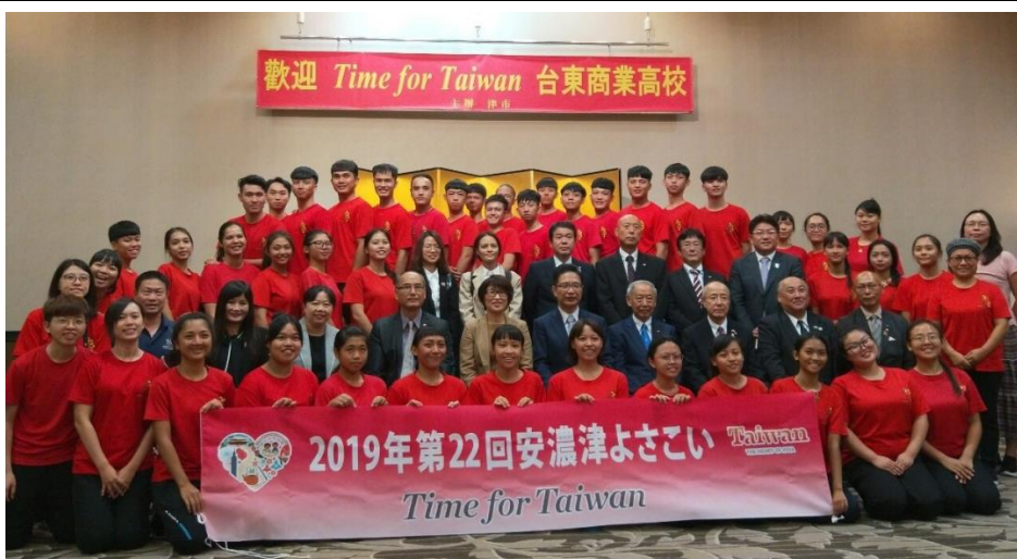
津市主辦 歡迎台灣 代表團餐 會