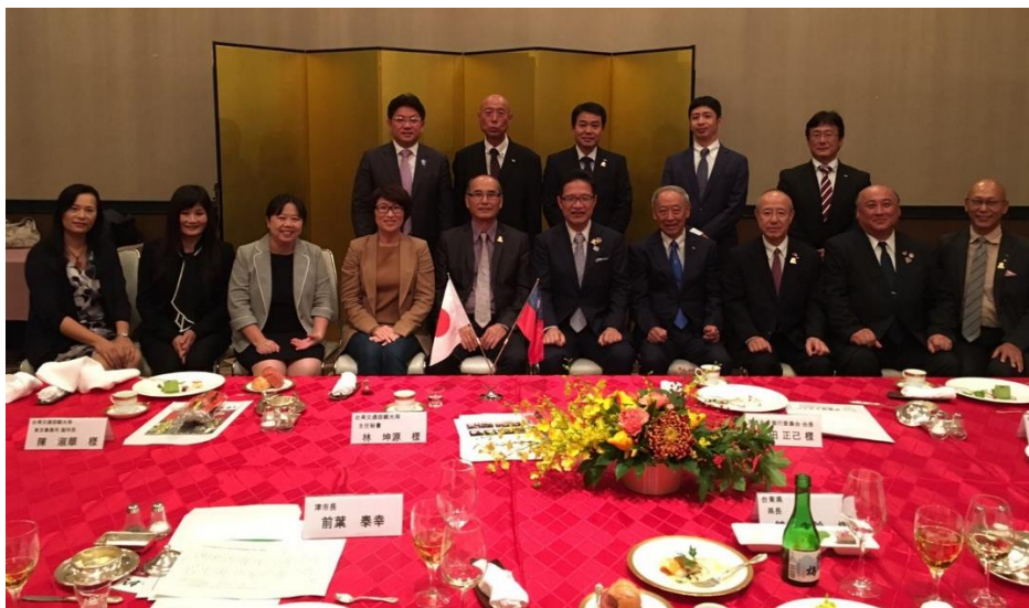
津市主辦 歡迎台灣 觀光局及 台東縣政 府餐會