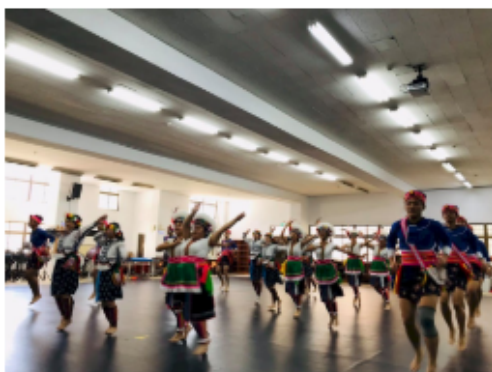
台東高商Time for Taiwan 台灣代表團。

交通部觀光局今天(11日)表示，由台東高商50名師生組成的「Time for Taiwan」台灣代表團，前往日本三重縣參加安濃津YOSAKOI街舞祭典，並將在12日、13日登台演出，台灣代表團不僅在服裝加入原民特色，舞蹈也融入原民的傳統舞蹈動作，要給日本民眾耳目一新的台灣印象。