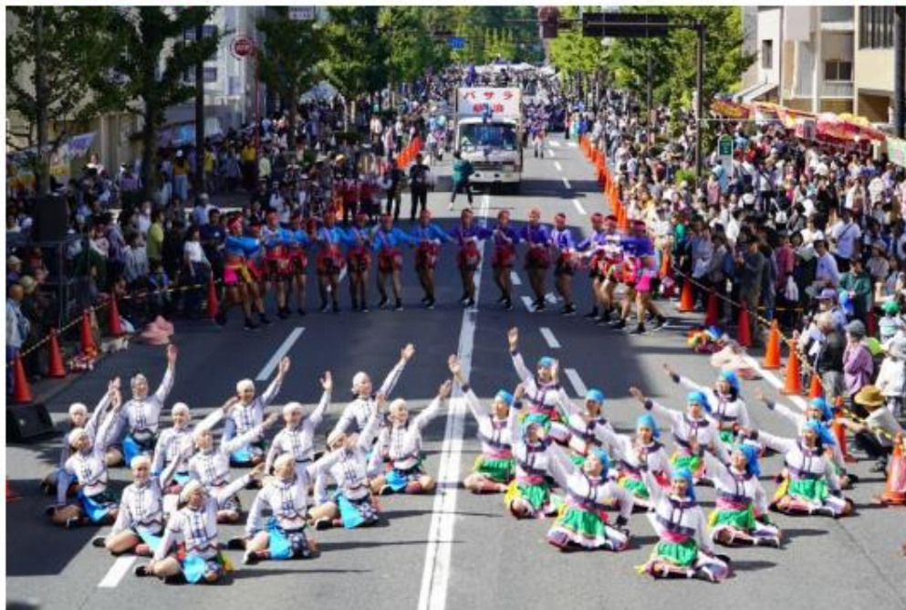
台東高商原舞團今天在日本三重縣舉辦的安濃津YOSAKOI祭典展現力與美。