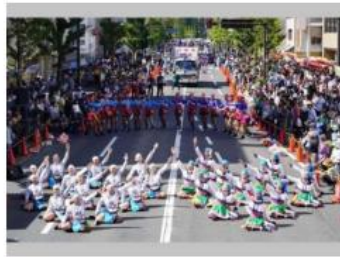
安濃津よさこいに出場した台東県の高校生たち