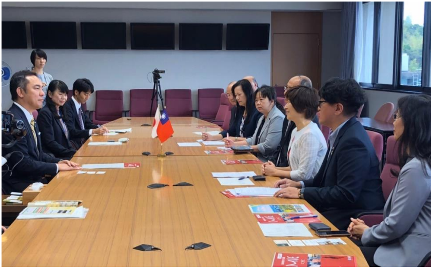
與台東縣 縣長饒慶 鈴共同拜 會日本三 重縣鈴木 英敬知事 （上圖左 一）