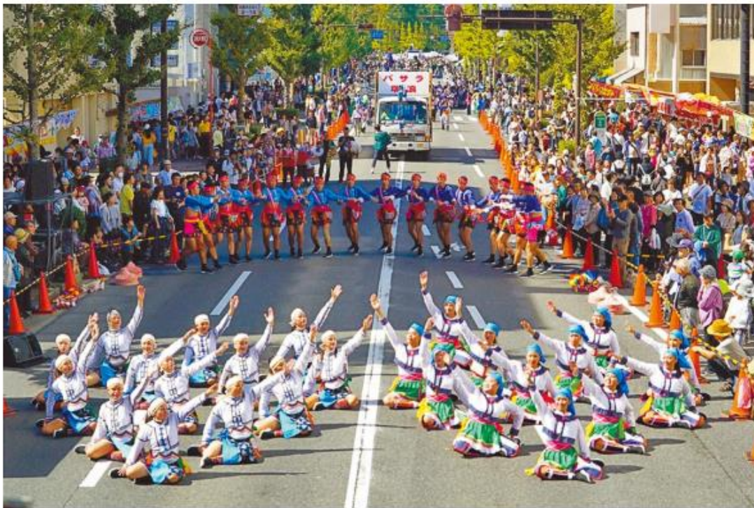
台東高商原舞團13日參加日本三重縣安濃津YOSAKOI街舞活動。