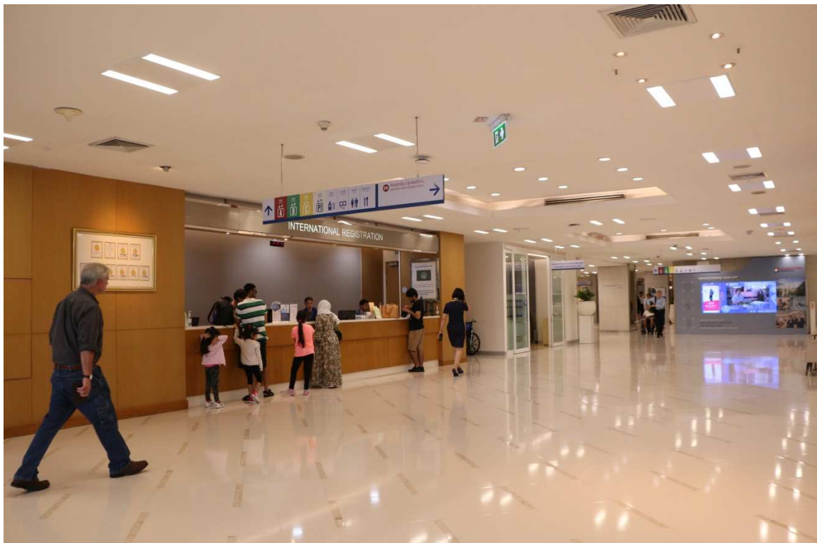
▲曼谷醫院大廳，設有國際客戶專門掛號櫃台服務。