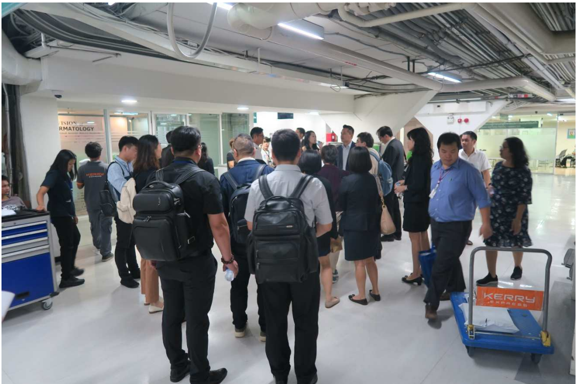
▲參觀拉瑪提波迪醫院舊大樓。