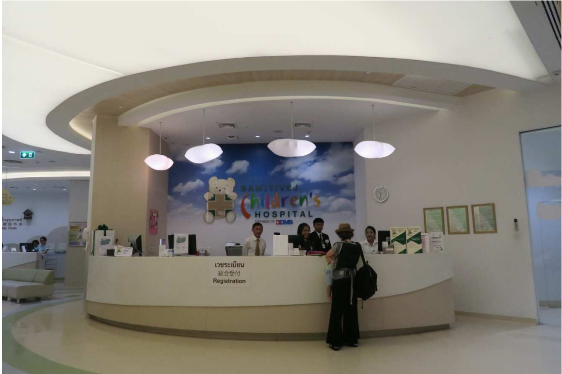
▲三美泰醫院內之兒童醫療部門，可見多國語言標誌。