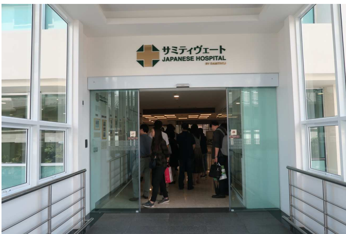
▲三美泰醫院特別為日本客戶開設之醫療中心。