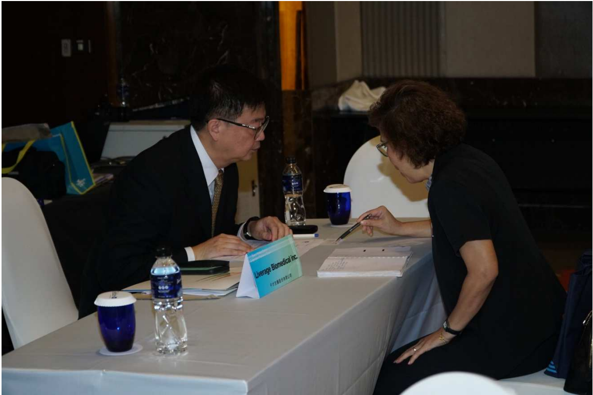
▲竹科廠商-千才生醫高嵩岳董事長向泰國客戶介紹產品。