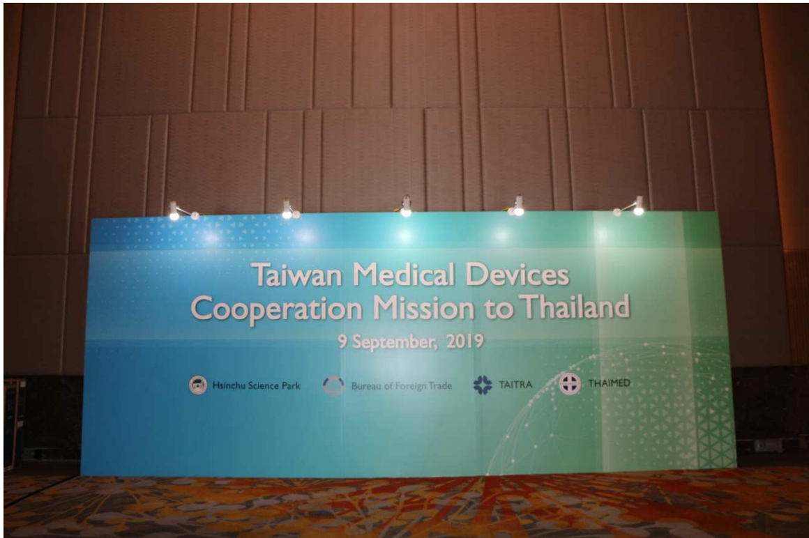
▲媒合洽談會現場布置。