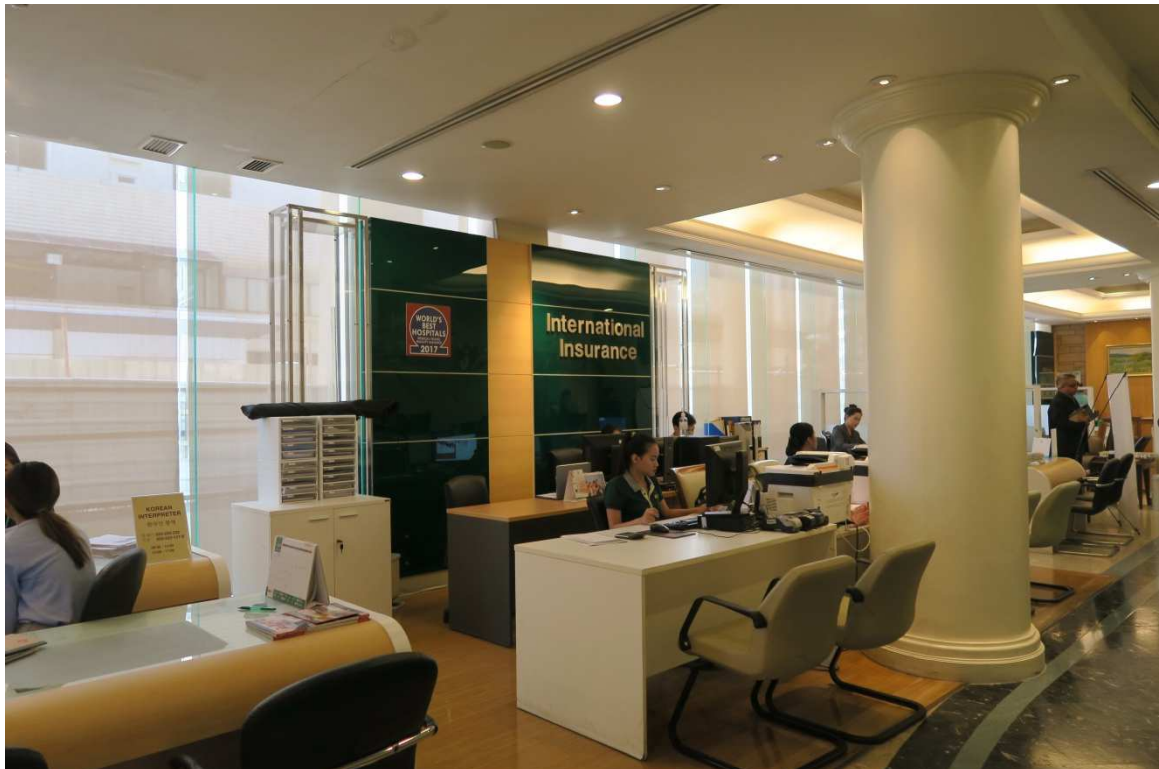
▲三美泰醫院大廳也設有專區服務國際客戶。