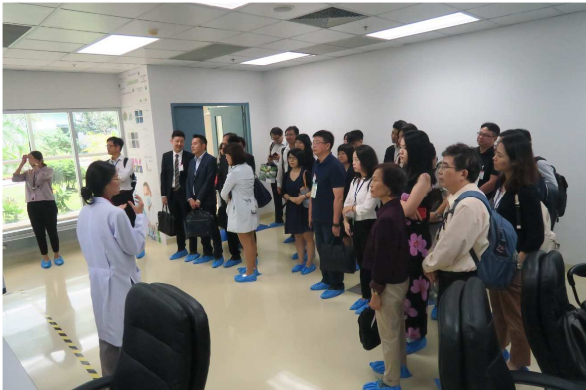
▲代表團參觀 Electrical and Electronic Products Testing Center 之實驗室。