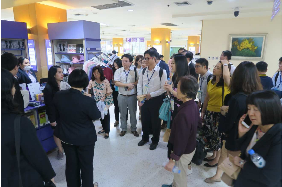
▲參觀拉瑪提波迪醫院新大樓。