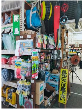
農業保護資材－防鳥資材區