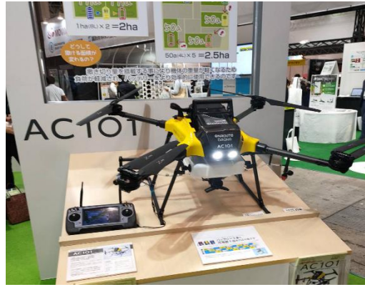
無人機蓬勃發展，有多家業者展示新機 (防雨無人機、全天候作業)