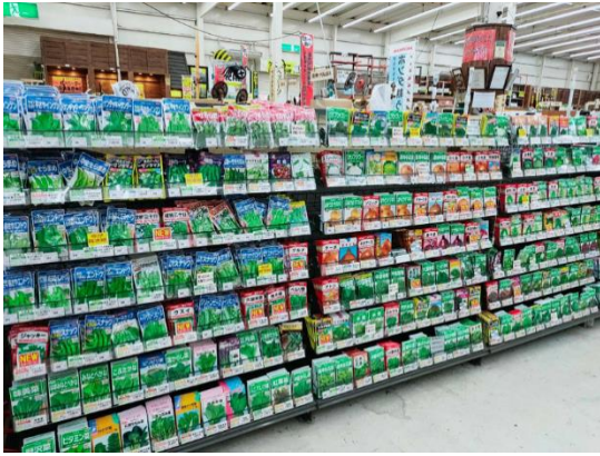
賣場內各式各樣的蔬菜種子