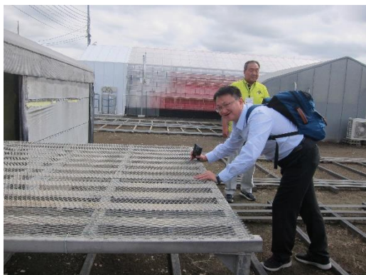
草莓夜冷育苗台車推動操作體驗