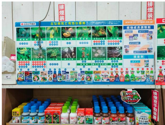
防治資材上方張貼害物名稱及圖片並對應可選用防治資材之編號以利選用