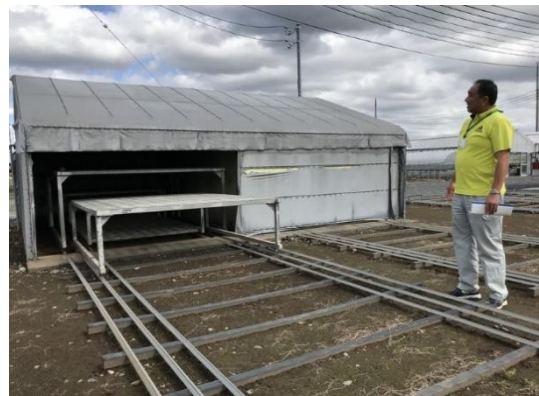
夜冷育苗技術促進花芽分化