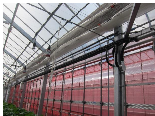
紅色溫室網目具有驅蟲作用