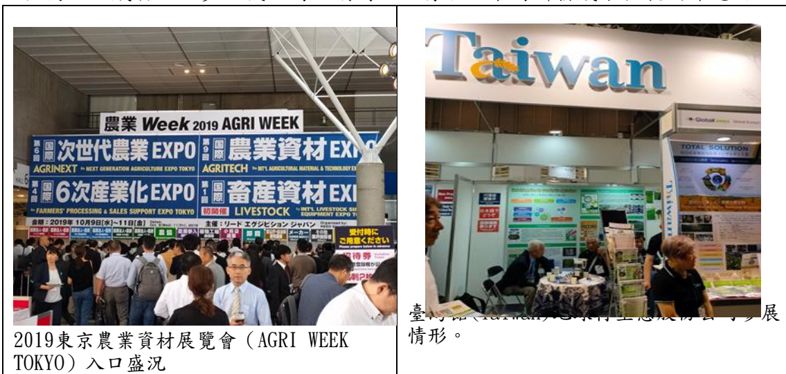
2019東京農業資材展覽會（AGRI WEEK TOKYO）入口盛況

大。因日本資源匱乏和產業結構問題，農業產品大量依賴進口，而其中大多數是從中國進口，部分產品進口依存度超過50%。展覽包含各種農業用品及技術：基質（無機基質/有機基質），農藥，肥料，育苗系統等，各種農業機械：農用設備、農機農具、測量系統，園藝用品，畜牧用品等，現代農業技術：生物技術、IT 農業、無人機、太陽能利用技術等，國際6次產業化：保鮮及衛生管理、食品加工、OEM及銷售支援技術等。其中臺灣館(Taiwan)由農業科技研究院帶領13家國內農業相關廠商赴日參展，本場溶磷菌苗粟活菌1號技轉廠商”地球村生態股份公司”也積極於日本登記上市，產品名為AgroPlus NBG101，來自各國參訪者詢問度很高，也成功洽談多位代理商經銷商品，有助於本場研發成果拓展國際應用。