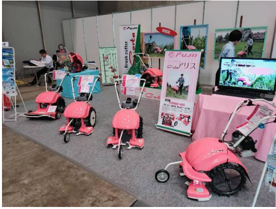
針對女性提供相關手推式割草機(小型化、輕型化、粉色化)

農業資材部分：A. 病蟲害防治資材：本次參展廠商以生物農藥方式呈現之產品相對較少，原因是取日本生物農藥登記證如同台灣法規一般相當嚴格與漫長，所以微生物資材部分均以微生物肥料或有機質肥料的形式居多，但仍值得注意，如「CLYBIO」是以愛媛縣產業技術中心所研發(えひめAI-1)的技術為基礎，用生物技術來控制品質的複合微生物。結合乳酸菌+納豆菌+酵母菌之三合一製劑，具有土壤改良(水的浸透性、保水性)、促進發育、減農藥栽培、堆肥的促進、消除有機肥料味道、抑制白粉病等發病多功能的效果。LED燈驅蟲器是最新的產品，利用紅、綠色的LED燈光與波長對昆蟲有忌避的作用，達到驅蟲的作用，有別於傳統的