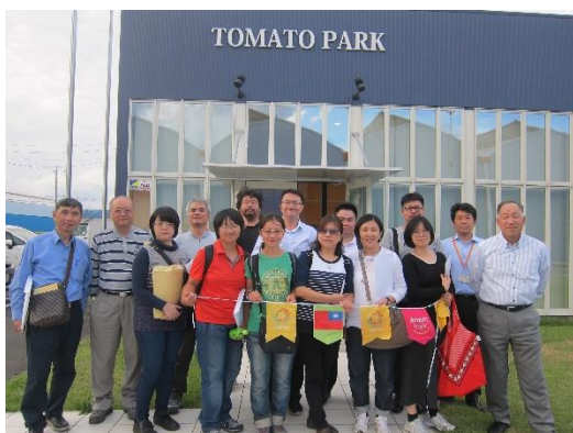
誠和株式會社的連棟溫室Tomato Park

「誠和株式會社」是日本著名的農業顧問公司，服務項目包括溫室建材和零組件製造、規劃與施工，近年主要是以農業資材的進口、系統整合、培訓青農為發展重點。位於櫛木縣的「Tomato Park」，占地2.8公頃荷蘭式環控溫室，這裡是日本關東地區非常重要的青農訓練基地。日本誠和則斥資八億日圓在栃木縣下野市興建1.2公頃的連棟溫室Tomato Park，採用的是半密閉式的環控型溫室設計。2018年時在旁邊擴建了另一座1.6公頃的新場，並在2019年9月開始啟用。這裡的定位是驗證型農場，專攻番茄作物，一方面是培訓新人，讓他們獲得操作荷蘭設備和農場經營的能力；另一方面是測試日本品種的番茄，讓日本的農民，利用荷蘭的栽培系統，栽培日本品種的番茄，並能夠獲利。Tomato Park也與農水省、農研機構、KDDI等單位有合作計畫，例如今今年8月發表的「智慧農業技術開發與實證計畫」，以農研機構、IT業者和農業栽培顧問為主體，逐步將設施番茄從栽培生理、人力管理、環控技術、流通經營，各個環節都數據化、可視化。他們要將產量增加10%、良率提升5%、售價提高20%、勞動時數減少10%、生產成本減少10%、作業效率提升20%，這是該計畫兩年後的預期目標。Tomato Park已經可以將日本品種的中果型番茄從年產量每分地30噸提升到50噸，下個階段的目標是年產70噸。農場裡有一個區塊正在進行小果番茄的栽培研究，現在的年產能是每分地15噸，糖度從6度提升到8度，下個階段的目標是要將平均糖度提高到9以上。