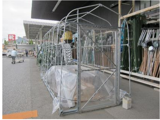
溫室鋁管DIY組合材料區