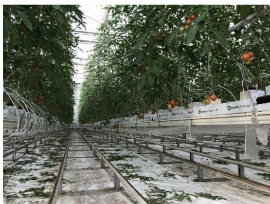
TomatoPark可將日本品種中果型番茄從年產量每分地30公噸提升到50公噸