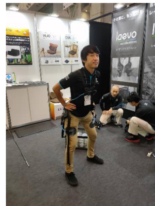
穿戴式作業輔助器具，省力30~50%