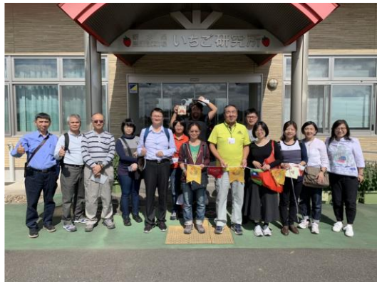
日本櫛木縣草莓研究所友善農耕技術研習

2008年由櫛木縣農業試驗場獨立出一個專門的草莓研究中心，成為日本草莓的研發重鎮「草莓研究所」，位址設立於櫛木市大塚町。該所常設有14名研究員，從事草莓育種、病蟲害、儲存、運輸、包材及市場調查研究等。櫛木縣草莓研究育成多種知名草莓品種，例如1985年的女峰，1996年的櫛木乙女(とちおとめ)，以及2012年兼具外型與風味的SkyBerry(スカイベリー)，今年10月15日又公布了櫛木乙女的強化版，具有更強風味與抗病能力的「櫛木i37號」品種。除了品種選育櫛木縣草莓研究所還有一套獨特的「夜冷育苗」設備。1985年櫛木縣農業試驗場發表了「女峰」這個新品種，它能將草莓產季從1月提早到前一年的12月，隔年也成功利用夜冷育苗技術將產季又提早到11月。原本聖誕節前才能收成的女峰草莓，透過夜冷育苗處理後，11月便能開始採收上市。每年8月開始，研究人員會將草莓苗放在軌道層架上，白天推置在戶外日曬8小時，夜間就會把層架推入隔熱材質的冷房內，以攝氏12度的低溫處理，隔天再推出來日曬8小時，如此持續一個月後再移植田間。透過日照時間和溫度的控制，讓草莓來花的時間提早，冷氣吹上一個月，9月時移入溫室裡種植很快就會開花，11月開始便有草莓可以收成。