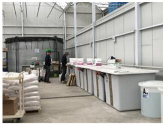
青年學員學習調製番茄養液