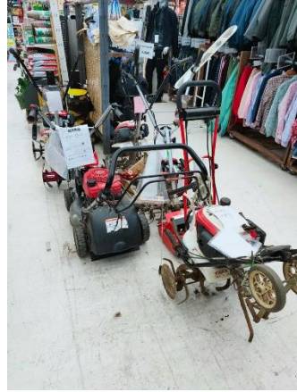
賣場內提供農機具修繕服務