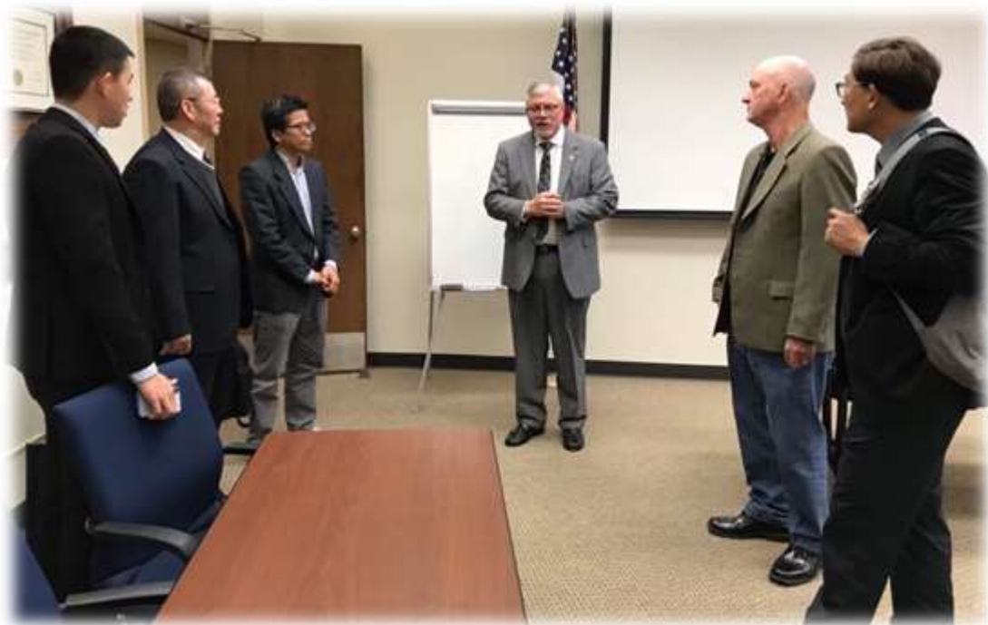
照片 32: 參訪聖休斯頓州立大學-6 (del Carman 紀念室)