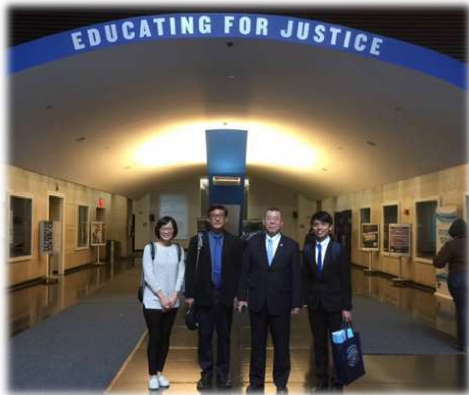
照片 16: 參訪江界學院-4 (與校友及本校區隊長合影)