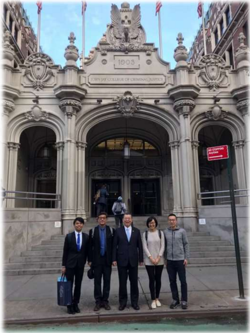
照片 18: 參訪江界學院-6 (學院大門與校友合影)