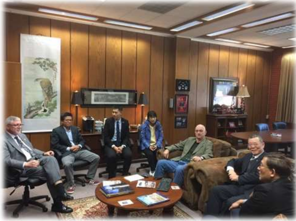
照片 28: 參訪聖休斯頓州立大學-2 (院長與國際交流中心主任接見)