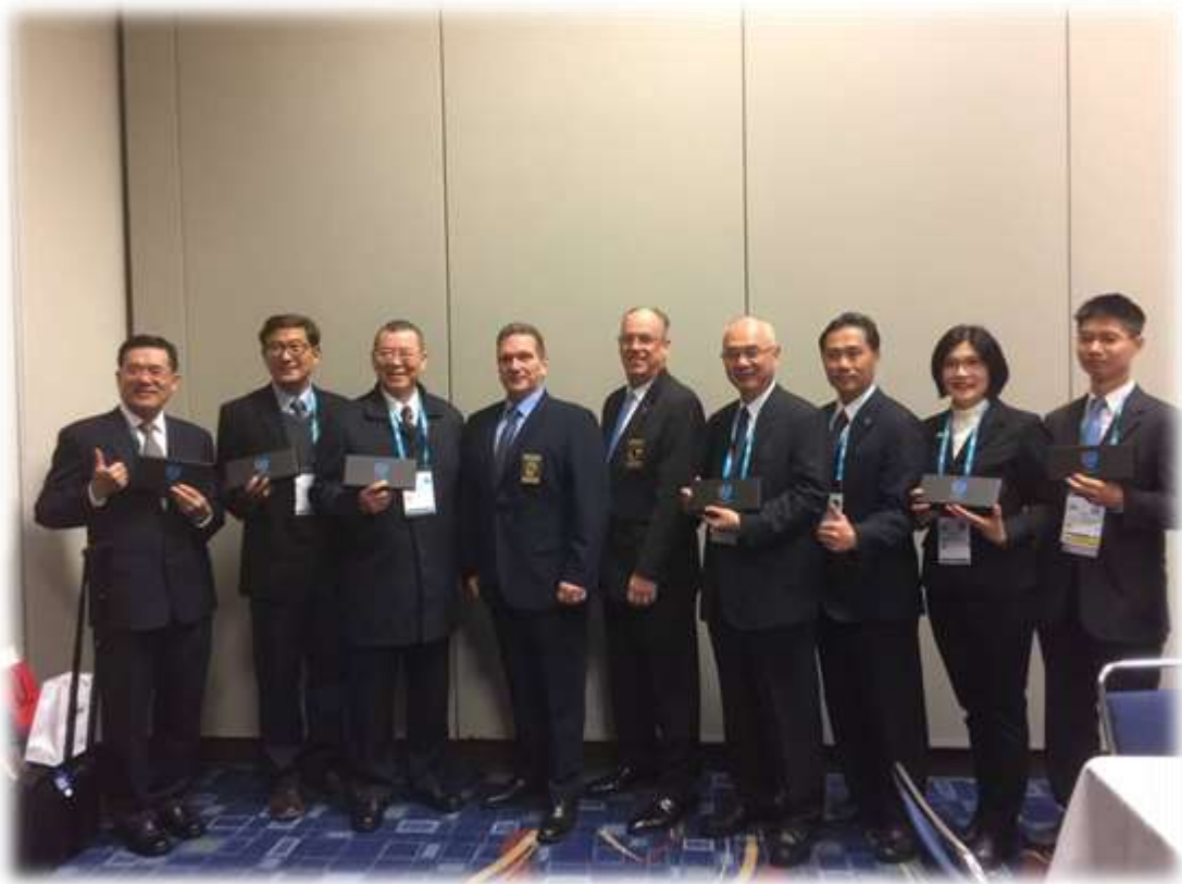
照片 4: 會長開幕前接見-3