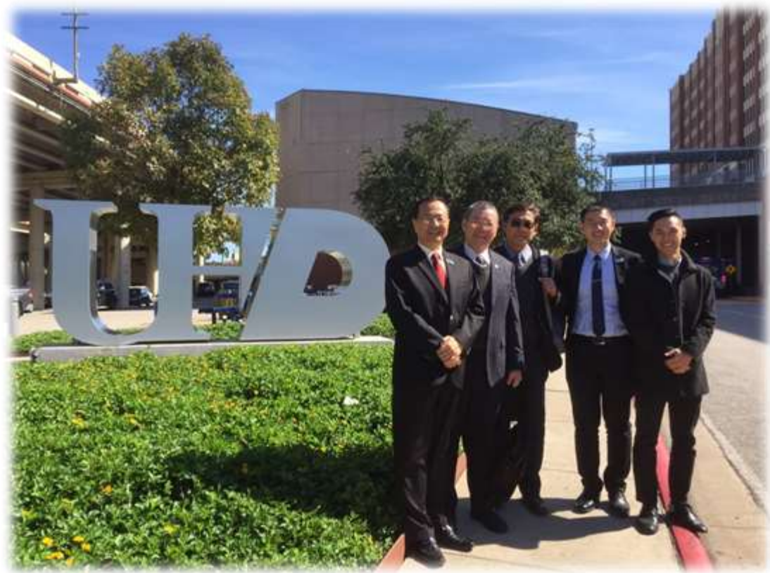
照片 23: 參訪休斯頓大學城中校區-2 (與校友合影)