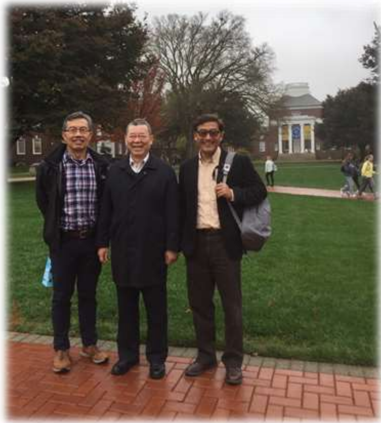
照片 21: 參訪德拉瓦大學-3 (校園)