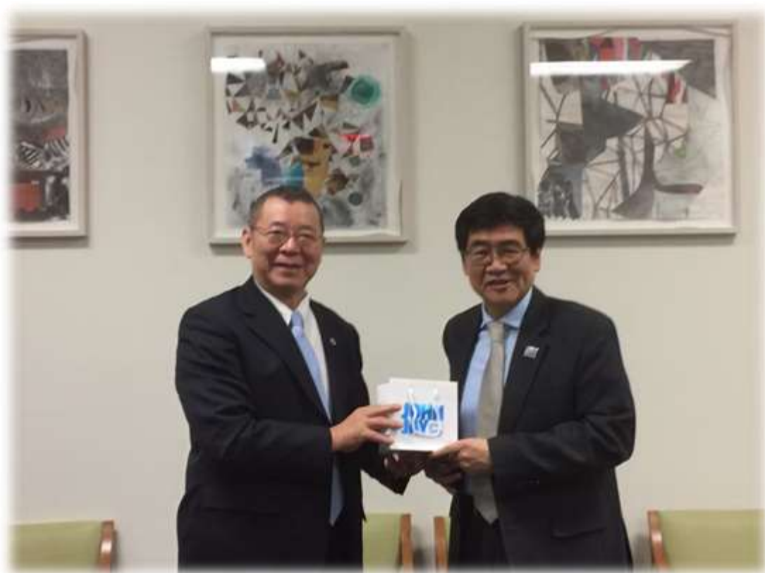
照片 15: 參訪江界學院-3 (互贈紀念品)