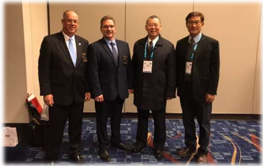
照片 2: 會長開幕前接見-1 (會長、副會長合影)

隔天(10月26日)早上 11:00,國際警察首長協會 Paul Cell 會長特別率幾位副會長於會場覓地接見台灣代表團,相互寒暄,並互贈紀念品。我們也在會場參觀裝備展及會場相關設施。