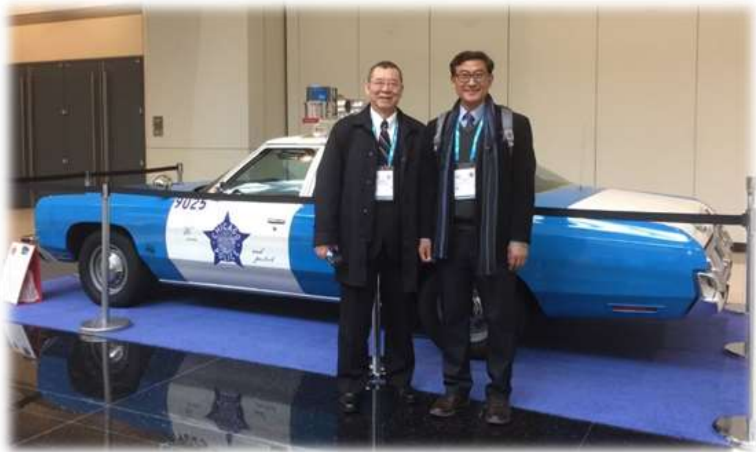
照片 5: 參觀裝備展-1