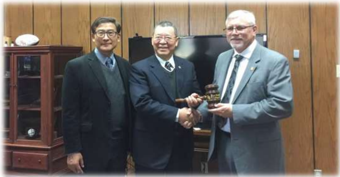
照片 29: 參訪聖休斯頓州立大學-3 (院長致贈紀念品)