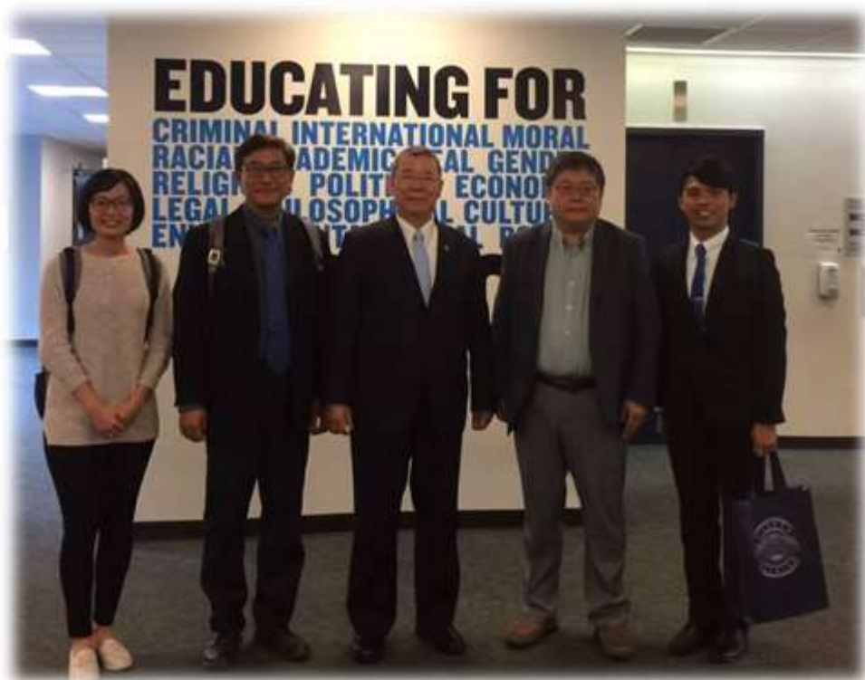
照片 17: 參訪江界學院-5 (與江界學院師生合影)