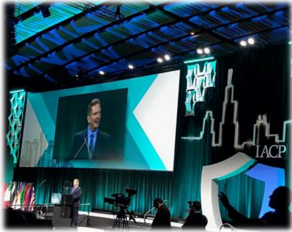
照片 7: 會長主持開幕

都造訪本校，並贈送警察制服，他欣喜地向會場上所有警政首長介紹警大博物館內設有 IACP 專區，藉此，台灣警察和國際警察建立起深厚的友宜。這是一個少數我們未遭受排擠的重要國際組織，允宜重視。