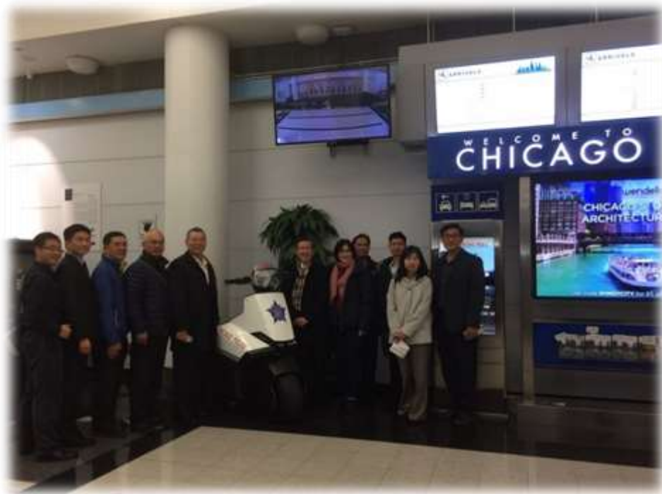
照片 1：芝加哥辦事處人員接機

我們於 10 月 25 日 20:00 搭乘長榮 BR056 班機直飛芝加哥，抵達芝加哥已是深夜。甫落地即由芝加哥辦事處副處長及警政署駐美聯絡官在芝加哥航警的陪同下迅速辦理通關，同時通關的尚有警政署、台北市警察局及航空警察局代表團成員。