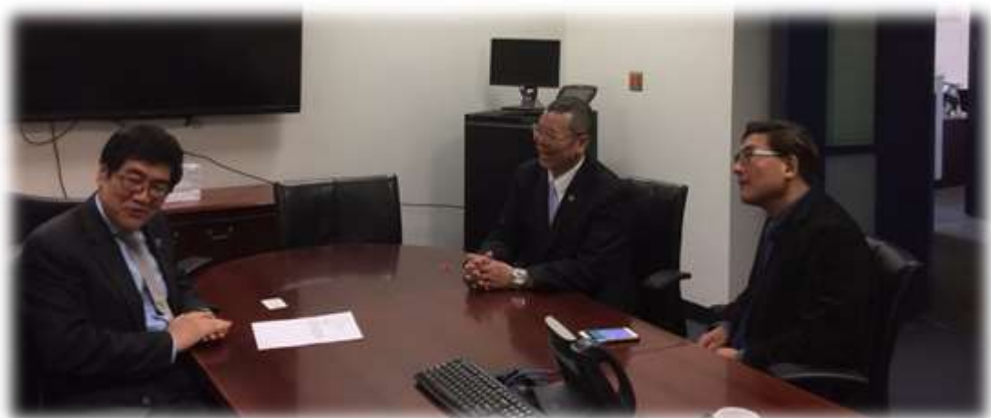
照片 14: 參訪江界學院-2 (副校長兼教務長接見)