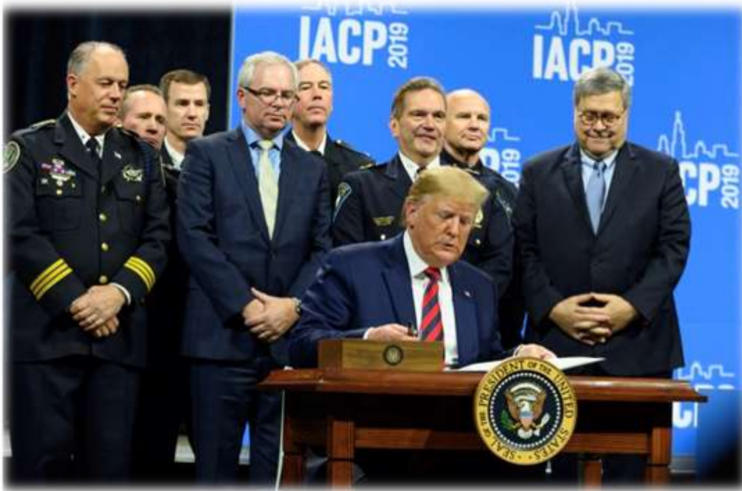
照片 35: 川普總統在 2019 IACP 閉幕典禮簽署行政命令