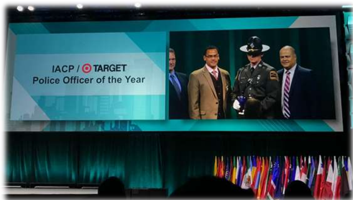
照片 34: IACP 年度警員頒獎