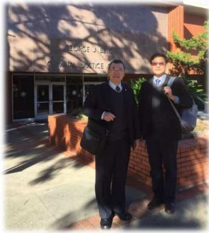
照片 30: 參訪聖休斯頓州立大學-4 (學院正門留影)