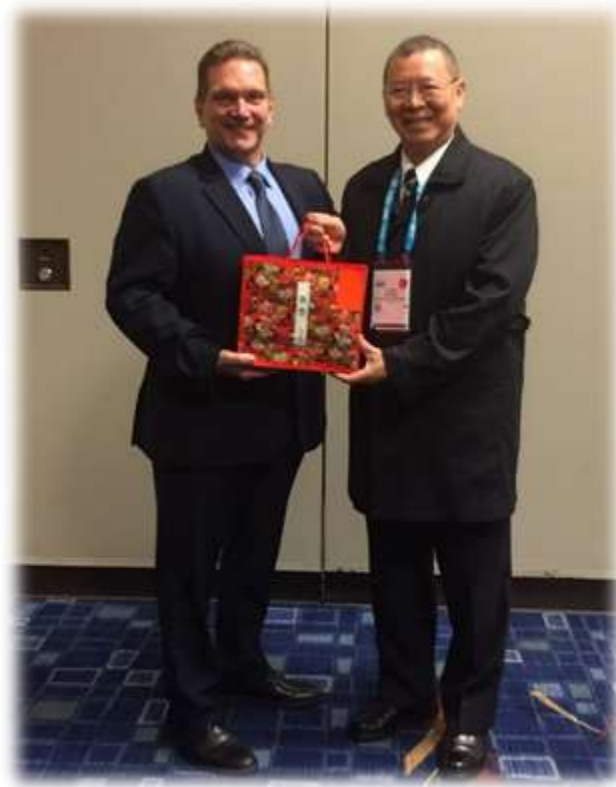
照片 3: 會長開幕前接見-2