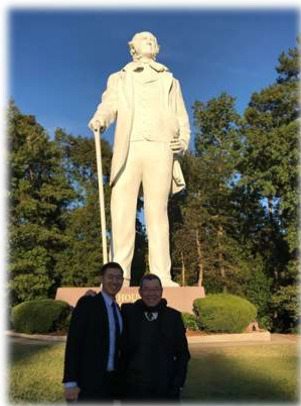
照片 33: 參訪聖休斯頓州立大學-7 (Sam Houston 雕像)