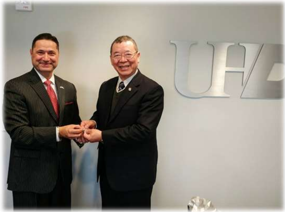
照片 24: 參訪休斯頓大學城中校區-3 (校長致贈紀念品)