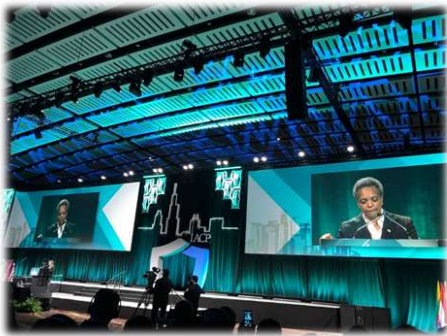
照片 8: 芝加哥市長開幕致詞