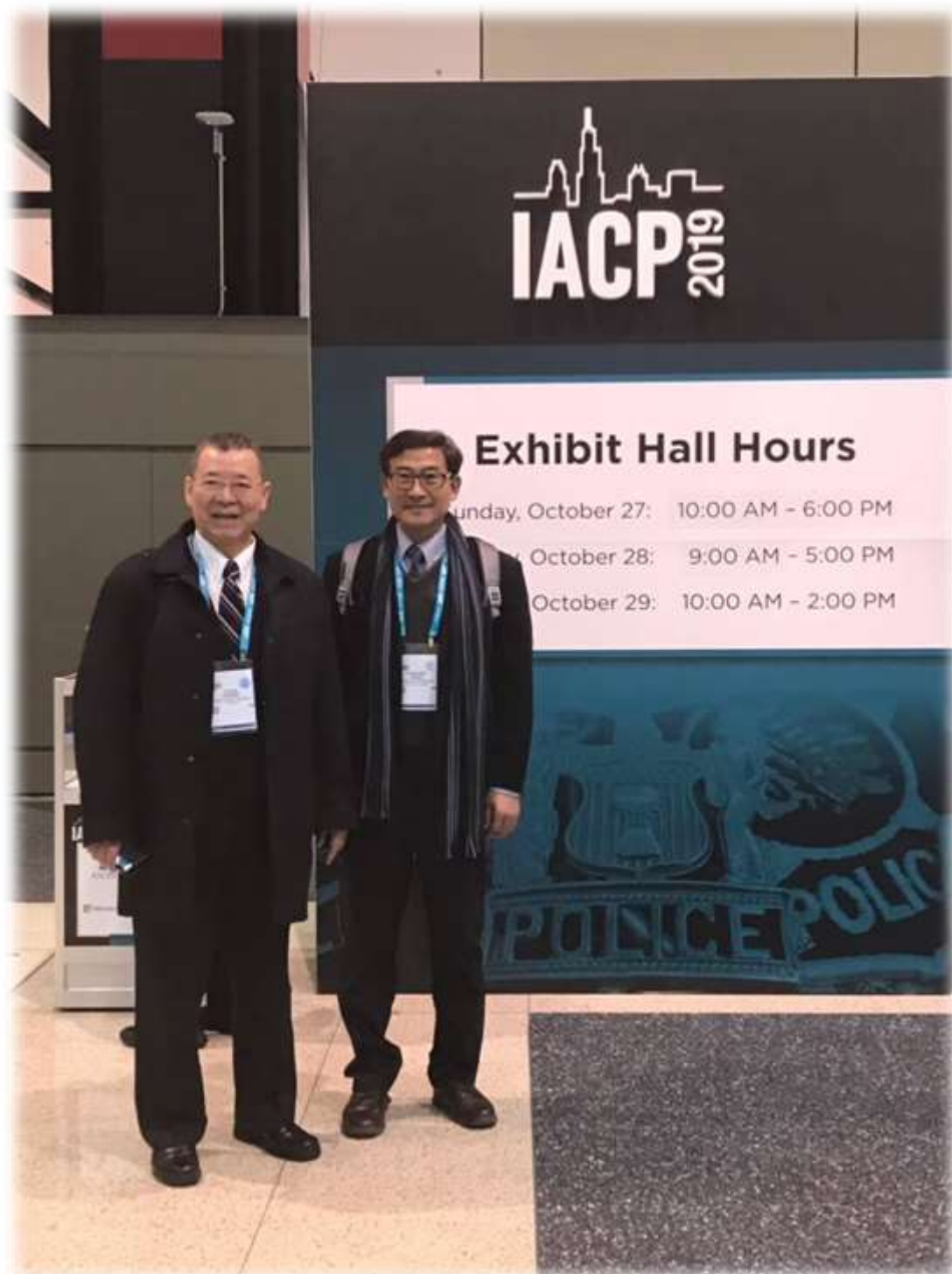
照片 6: 參觀裝備展-2

當天下午 3 時各國與美國各地警政首長數千人陸續入場，參加開幕典禮。典禮由 Paul Cell 會長主持，他提到 IACP 自 1893 年首次集會至今，已有 126 年歷史，是一個帶動警察專業的全球性重要組織。Cell 會長因連續兩年受邀參加警政署舉辦的國際警察合作研討會，在開幕講話中特別強調台灣警察與 IACP 組織的連結。此外，他每次抵台也