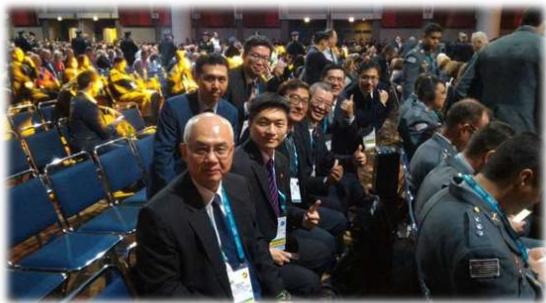
照片 11: IACP 會場-3 (台灣代表團)

芝加哥市長和芝加哥警察總局長是會場東道主，也是受邀在開幕中致詞的貴賓。Lori Lightfoot 以市長身分談到治安時說，城市安全靠的是團隊，非一人之力所能完成，她強調社區警政中的夥伴關係，重申 1829 年英國皮爾爵士所說「警即是民、民即是警」的哲學。