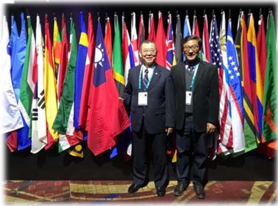
照片 9: IACP 會場-1 (國旗前合影)