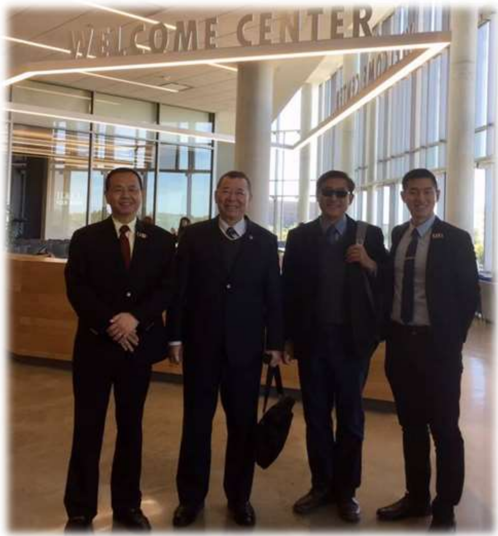
照片 26: 參訪休斯頓大學城中校區-5 (接待中心)