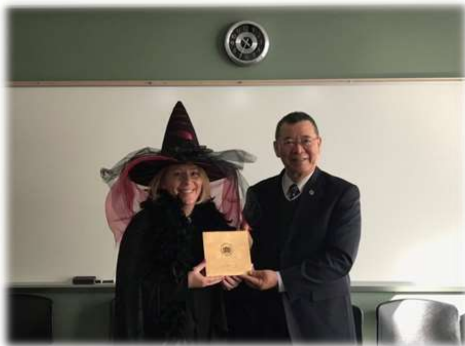
照片 31: 參訪聖休斯頓州立大學-5 (鑑識系主任合影)