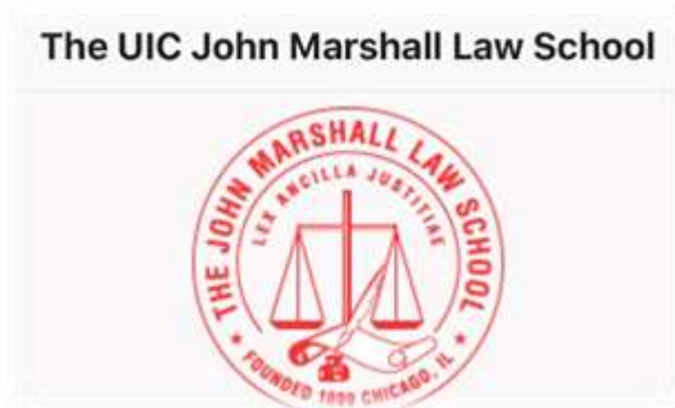
照片 12: 本校姊妹校約翰馬歇爾法學院併入伊利諾大學芝加哥校區