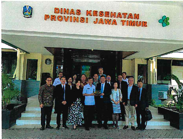
▲台灣訪團與印尼泗水東爪哇省衛生局局長（前排左四）等人合影留念

及宣傳台灣醫療資源後，期望透過台灣醫療技術導入印尼泗水後，除可提升當地醫療水準，並有助台灣醫療團隊拓展印尼市場。