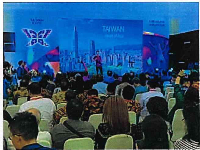
▲2019 印尼臺灣形象展開幕式