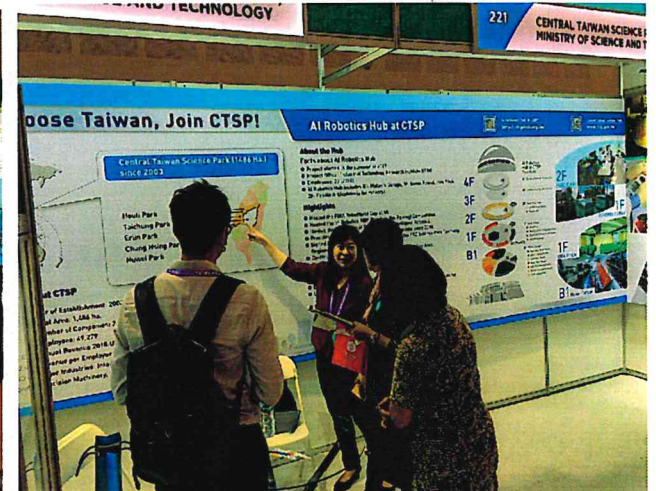
▲本局於展會現場向參觀者介紹中科園區及中科 AI 自造基地發展現況