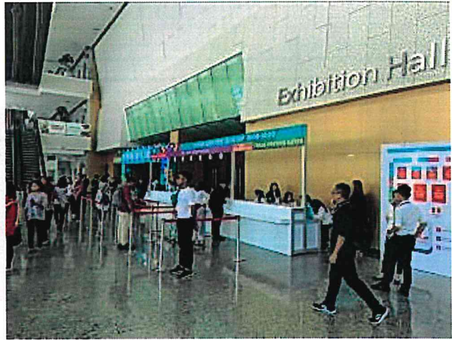
▲2019 印尼臺灣形象展外觀及售票大廳