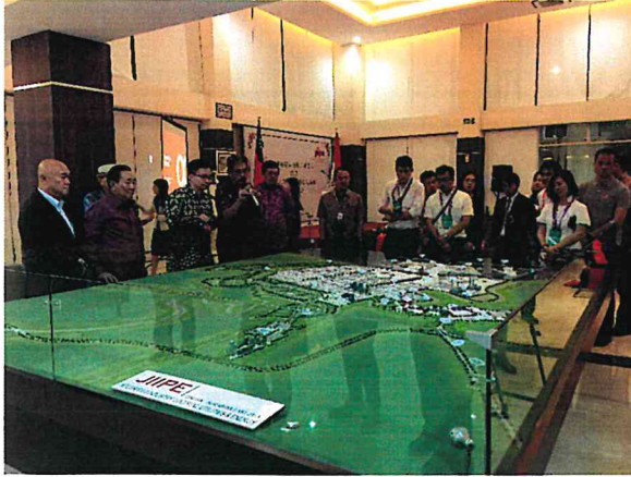
▲吉沛港綜合科技工業園區向台灣訪團說明未來 園區發展藍圖