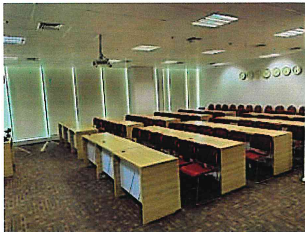
▲ 泗水 IDX INCUBATOR 會談及課程規劃空間

IDX 則表示公司成立的宗旨是希望能輔導印尼當地的新創公司及團體 Go Pubic，公司提供共享辦公室空間，供來自不同團體或產業的人進行經驗交流與分享，並提供相關產業師資課程提升新創團體進入市場所需具備的能力，另媒合相關產業及企業投資新創團體技術，加速新創邁向市場化及公司化。交談後也瞭解，印尼新創產業進入市場或成為上市公司只是一個初步的過程，亦即成立公司或上市並不困難，重要的是在於公司成立之後所需要維持的能量，則必須透過不斷學習新知識，讓公司持續保持著能夠符合時代潮流的觀念。此次拜訪除了交談分享彼此的經驗以外，也實際參觀 IDX 的場域空間，未來可作為本局加速器計畫之業務參考。