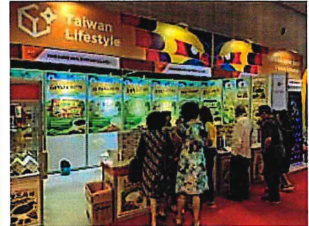
▲其他參展臺灣廠商