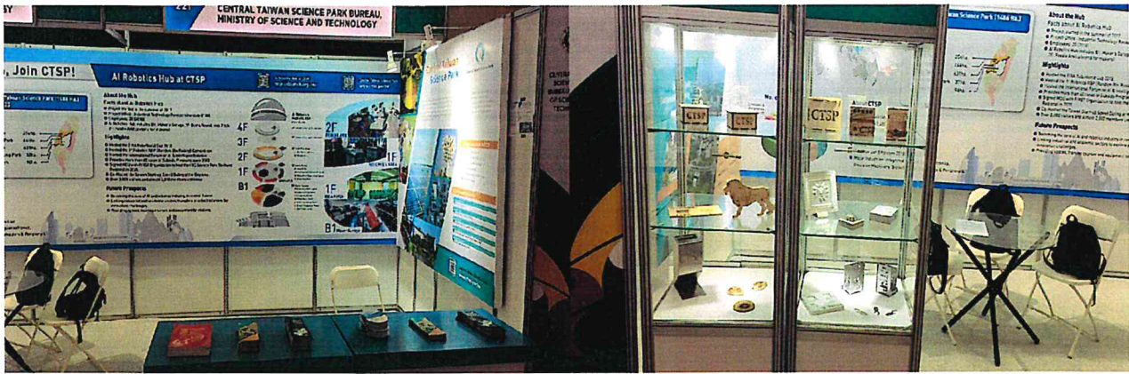
▲中部科學園區主題館