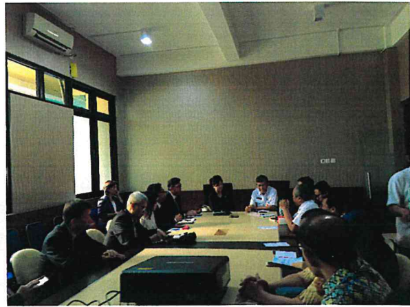
▲印尼泗水東爪哇省衛生局向台灣訪團介紹當地醫療市場