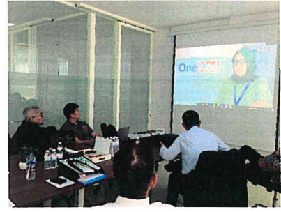
▲One Med 與台灣代表團進行雙向交流