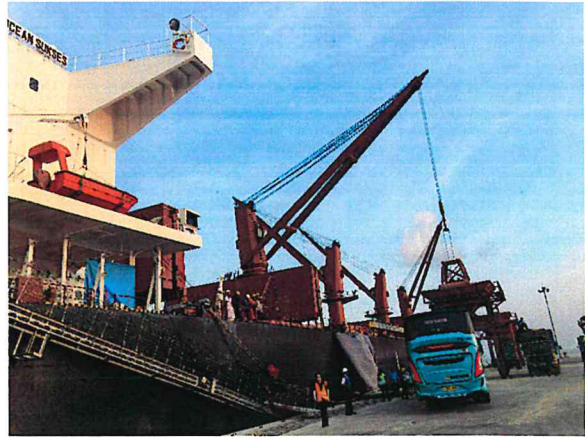
▲吉沛港綜合科技工業園區建設現況