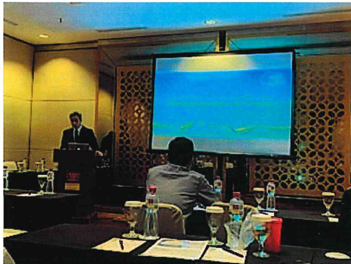
▲中華電信雲端世代智慧解決方案論壇

科技始終來自於人性，人性都嚮往更便利且豐富的生活，而網路科技目前已經翻轉現代人的生活方式，應用個人行動手持裝置或者各項通訊設備，即可得知所有大大小小的資訊，但礙於現況網路頻寬的限制，許多創意思想暫時無法實現，未來全新 5G 世代將再度顛覆現在人們的想像，讓生活充滿科技 ABC (AI 人工智慧、Big data 大數據及 Cloud 雲端)，也進一步帶動產業升級(工業 4.0)，並創造更多 5G 產業鏈的商機及工作機會。