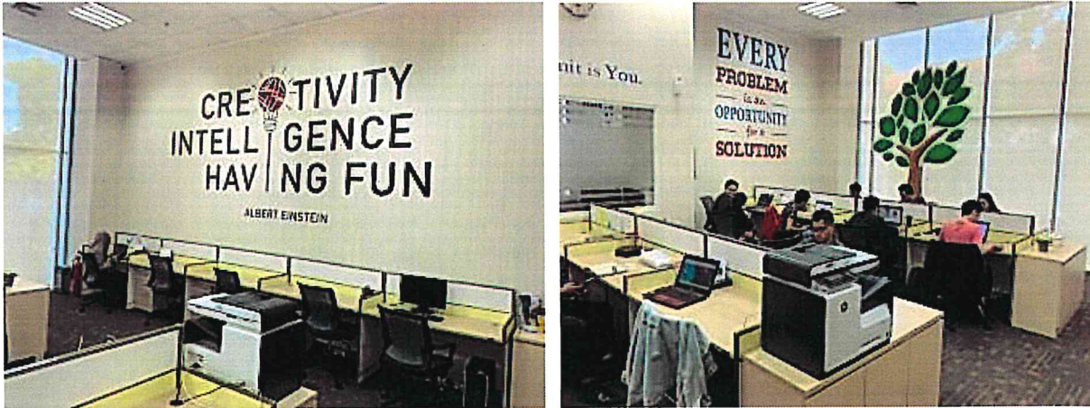
▲泗水 IDX INCUBATOR 會談及課程規劃空間