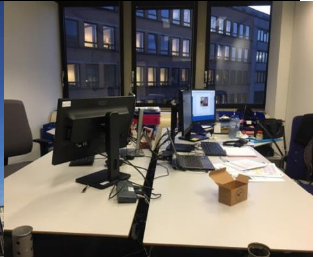
歐盟農業總署辦公大樓