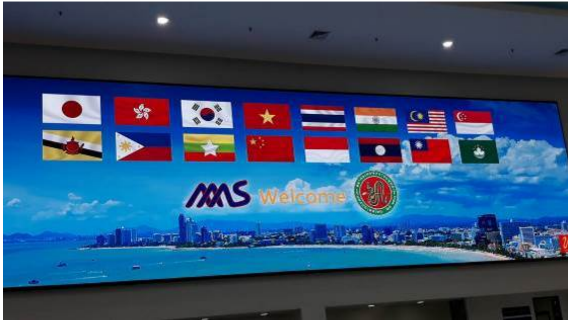
圖一：亞洲檢驗醫學科學會議( Asia Association of Medical Laboratory Scientists; AAMLS )首先創立於 1997 年日本名古屋，目前共有 16 個亞洲會員國組成如中華民國、日本、中國、中國香港特區、韓國、泰國、印度、馬來西亞、新加坡、汶萊、印尼、菲律賓、中國澳門特區、越南、柬埔寨、緬甸等，而臺灣於日本橫濱第四屆大會 2009 年 11 月始加入本會。