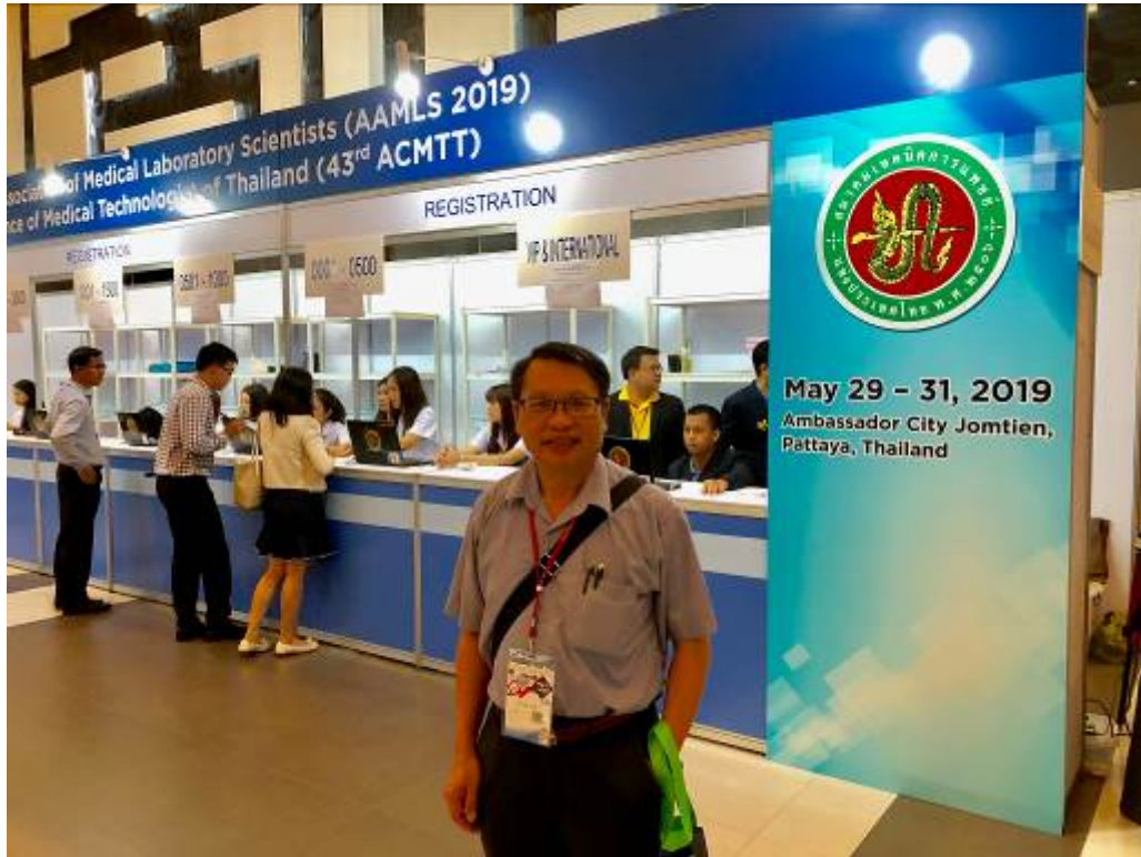
圖五：註冊與報到。第 六屆，2019年在泰國芭達雅喬木提恩大使城( the Ambassador City Jomtien, Pattaya, Thailand)國際會議中心舉行，大會主題為「醫學檢驗之新發展( Breakthrough in Medical Technology)」。第六屆大會共有16個國家出席，約2,900( 泰國以外人士約200人)個會員註冊分別來自Taiwan、Japan、Hong Kong、Korea、Thailand、India、Malaysia、Singapore、Brunei、Indonesia、Philippines、Macau、Vietnam、Kamupodia、and Myanmar。有22位來自臺灣各醫院之檢驗科、大學醫技系、檢驗試劑設備及生技公司等醫檢師及單位主管參與此次大會註冊，並提出22/95( 23%)篇壁報論文，1篇大會專題論文口頭報告。