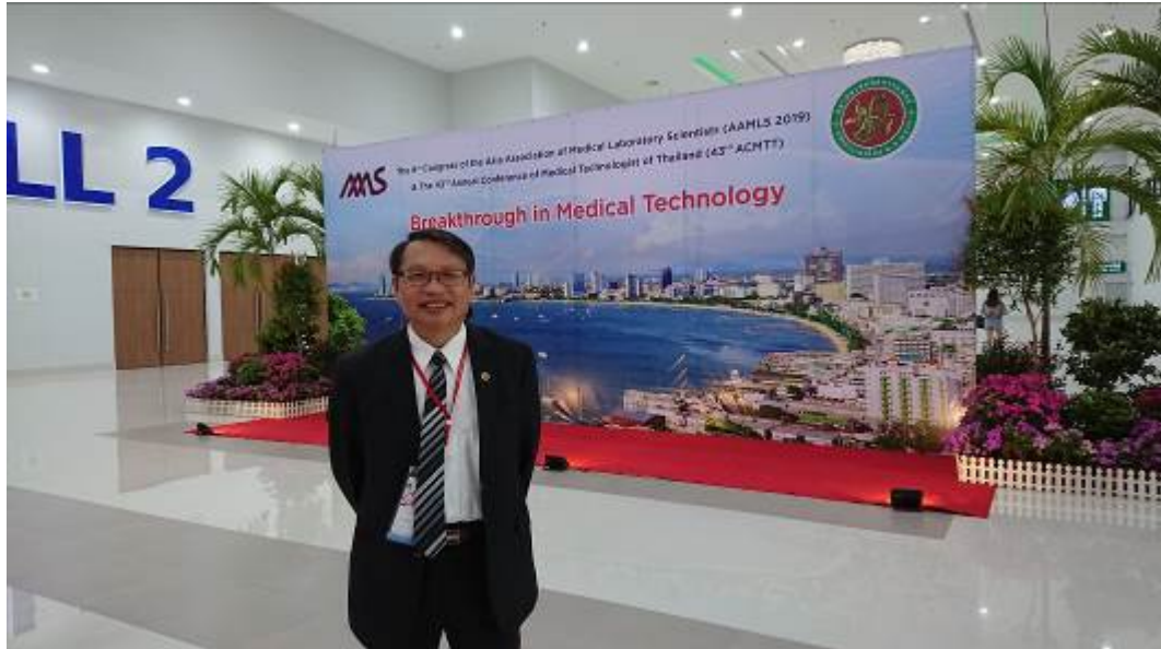
圖三：芭達雅位於泰國灣東側，首都曼谷的東南方約165公里處。它是泰國旅遊業最重要的據點之一，以湛藍通徹的大海和泰國人妖表演而聞名於世，素有「東方夏威夷」之美稱。第六屆亞洲檢驗醫學科學會議及第43國際醫檢師大會在泰國芭達雅喬木提恩大使城( the Ambassador City Jomtien, Pattaya, Thailand)國際會議中心舉行，大會主題為「醫學檢驗之新發展( Breakthrough in Medical Technology)」。