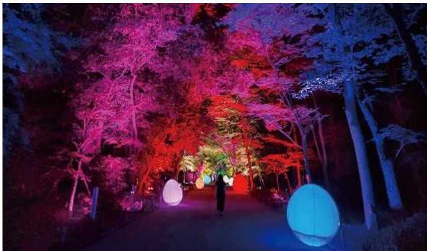
圖 5、《相互呼應的樹木們 - 下鴨神社糺之森》· 2018