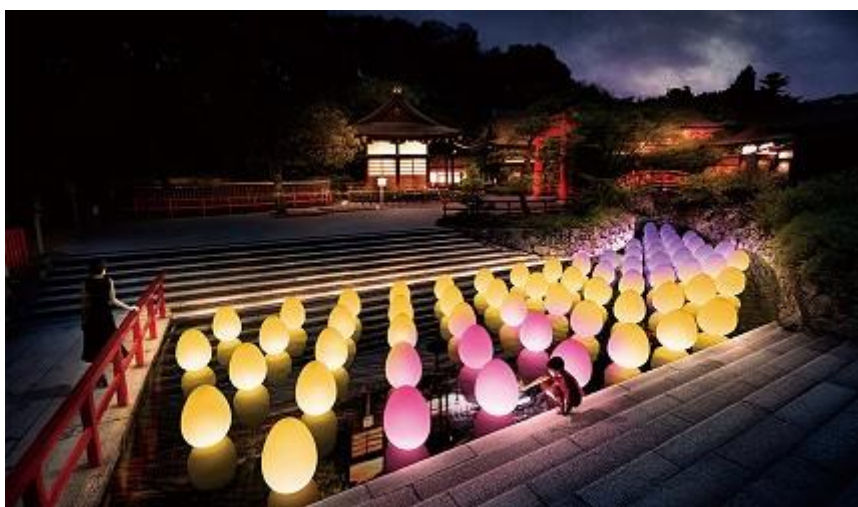
圖 3、《矗立於水面上的呼相呼應球體 - 下鴨神社御手洗池》· 2019