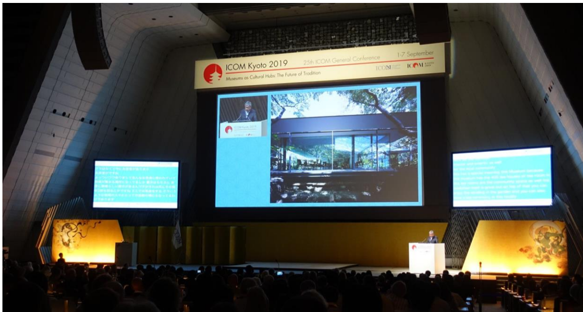
圖 7、日本知名建築師隈研吾於京都大會專題演講

接著由日本建築師隈研吾 (Kengo Kuma) 帶來近期建築作品的介紹 (Suntory Museum of Art, Asakusa Culture Tourist Information Center, Nagaoka City Hall Aore, Kabukiza, Besancon Art Center and Cite de la Musique, FRAC Marseille and V&A Dundee)，以「森林時代 (The Age of Forest)」為主題，闡述建築師作為創造博物館及美術館建築的社會責任 (圖 7)。