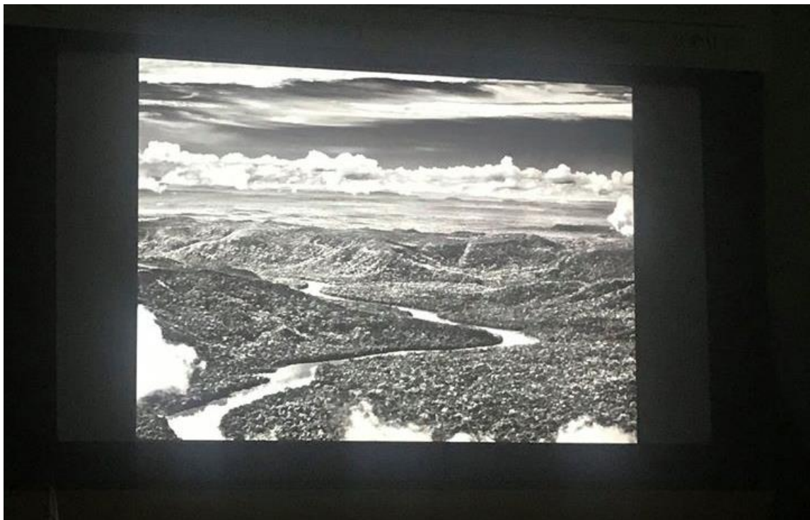
圖 10、巴西知名攝影師塞巴斯蒂昂·薩爾加多專題演講現場

持續出席京都大會的大會活動，第二場專題演講由巴西專業攝影師 Sebastiao Salgado 以「巴西亞馬遜森林倡議 (A Brazilian Amazon Forest Initiative)」為主題，從攝影創作與評論觀點分享在影像濫觴的年代下，攝影能保有影響社會的影像能量。攝影師透過大量旅遊觀察世界各地種族、生態及環境的改變，近年積極以亞馬遜森林作為觀察記錄目標，藉由影像作品反映自然資產日益殆盡，並捍衛人道主義的理想，再現人類與環境衝突的社會現象 (圖 10)。因此，Sebastiao Salgado 的攝影作品對於社會及環境的影響可作為文化部正在進行的國家攝影文化中心籌備小組規劃之展覽議題及國際交流參考。