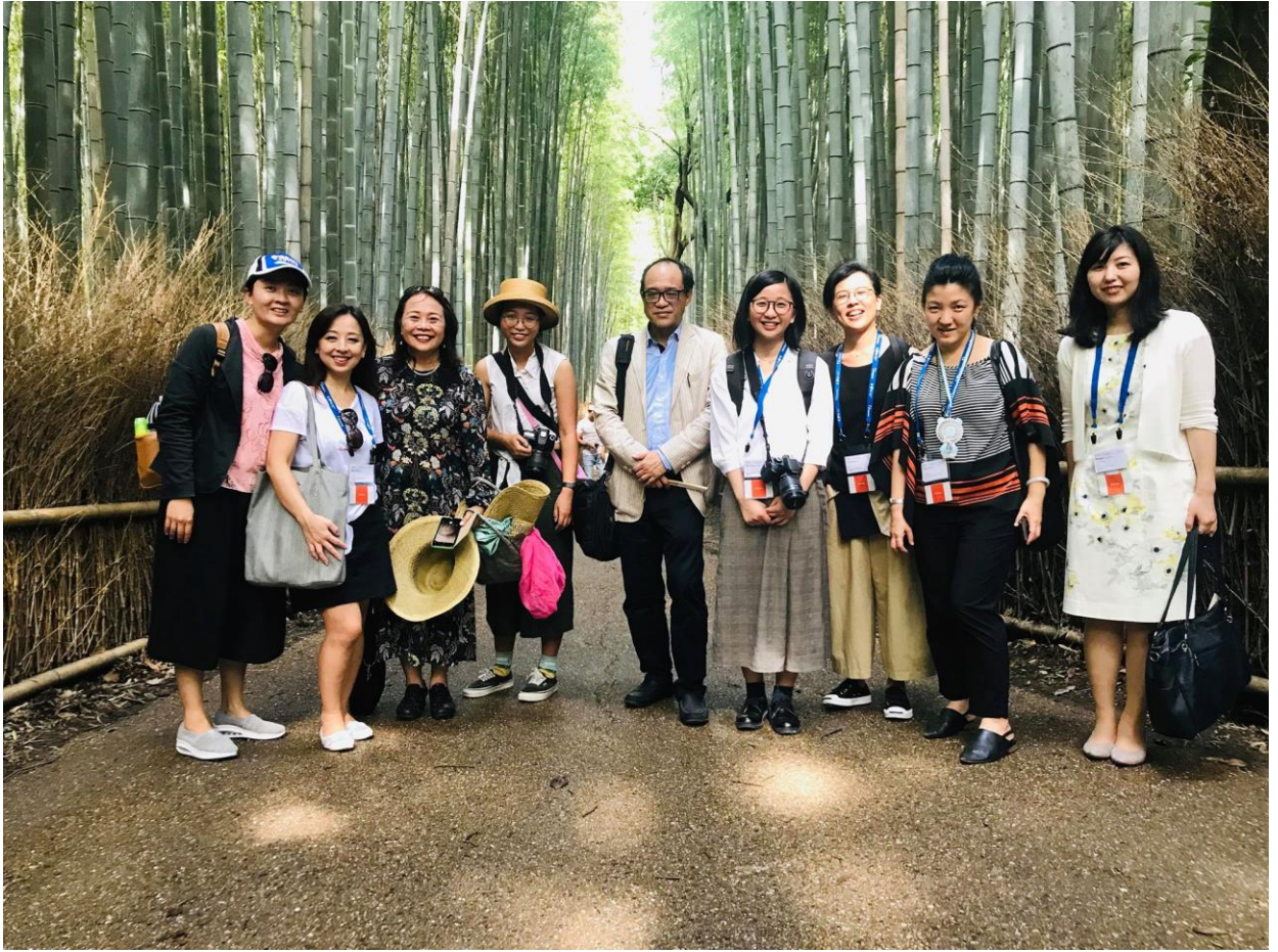
圖 15、創價學會臺灣分會同仁及與會人員於嵐山竹林之道合影

本次考察期間也親臨多所博物館及美術館參觀，包含「京都國立近代美術館」的時尚服裝藝術展 Dress Code: Are You Playing Fashion? 是一個具有高度策畫性格的展覽，主題有關藝術-服飾文化和其背後的社會符碼，展示內容融合了藝術、時尚及社會現象，向觀眾提出了十二道問題 6 。進入展場的方式有點特別，雖然主樓梯鋪了紅地毯，但卻規定是只能搭電梯直達三樓。四樓雖然只有兩件作品，卻緊接的典藏常設展在選件方面明顯作了配合，值得作為未來規畫特展主題與常設展展品延伸之策畫參考（圖 16）。