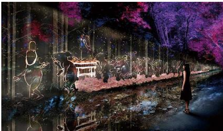
圖 2、《Walk, Walk, Walk - 下鴨神社糺之森》· 2019

光祭典 Art by teamLab - TOKIO INKARAMI」。這次光影作品皆由成立 2001 年的日本藝術團體 teamLab，擅長創造沈浸式體驗的科技藝術作品。本次展出除了《相互呼應的球體—下鴨神社》、《相互呼應的樹木們—下鴨神社糺之森》、《自立呼吸的生命之林》這三件延續作品之外，更新增了《Walk, Walk, Walk - 下鴨神社糺之森》及《矗立於水面上的呼相呼應球體 - 下鴨神社御手洗池》，透過燈光與音樂交織，以及因人的參觀行為或自然環境因素產生光影及形體變化（圖 2-6） 3 。