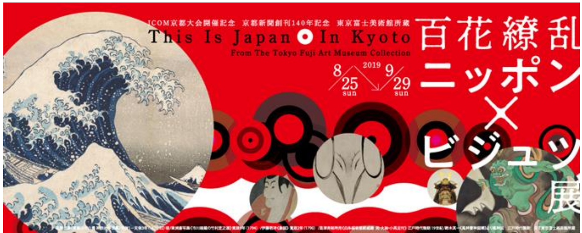
圖 17、京都府京都文化博物館「百花繚乱 ニッポン x ビジユツ展」海報

另一間同樣位於市區的「京都府京都文化博物館」，正展出配合 ICOM 京都大會舉辦的富士美術館「百花繚乱 ニッポン x ビジユツ展」(圖 17)，展品來自東京富士美術館所藏，包含浮世繪、漆器、劍和盔甲等 40 件展品，展出葛飾北齋、歌川廣重、歌川國芳、鈴木其一等名家作品，並提供 VR 虛擬體驗，感受江戶時代的室內屏風畫作內容，充分結合傳統繪畫與創新科技應用，作為本館延續藏品典藏應用開發的參考實例。