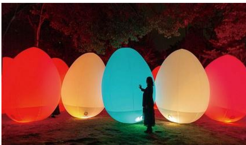
圖 6、《自立呼吸的生命之林》· 2018