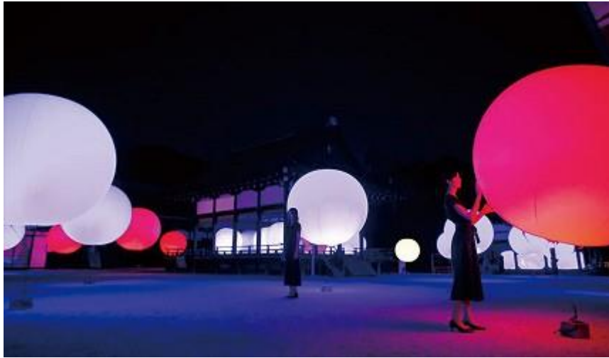
圖 4、《相互呼應的球體 - 下鴨神社》· 2016