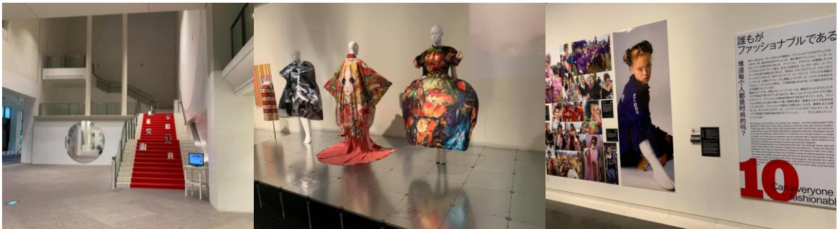
圖 16、京都國立近代美術館服裝時尚藝術特展

本次考察期間也親臨多所博物館及美術館參觀，包含「京都國立近代美術館」的時尚服裝藝術展 Dress Code: Are You Playing Fashion? 是一個具有高度策畫性格的展覽，主題有關藝術-服飾文化和其背後的社會符碼，展示內容融合了藝術、時尚及社會現象，向觀眾提出了十二道問題 6 。進入展場的方式有點特別，雖然主樓梯鋪了紅地毯，但卻規定是只能搭電梯直達三樓。四樓雖然只有兩件作品，卻緊接的典藏常設展在選件方面明顯作了配合，值得作為未來規畫特展主題與常設展展品延伸之策畫參考（圖 16）。