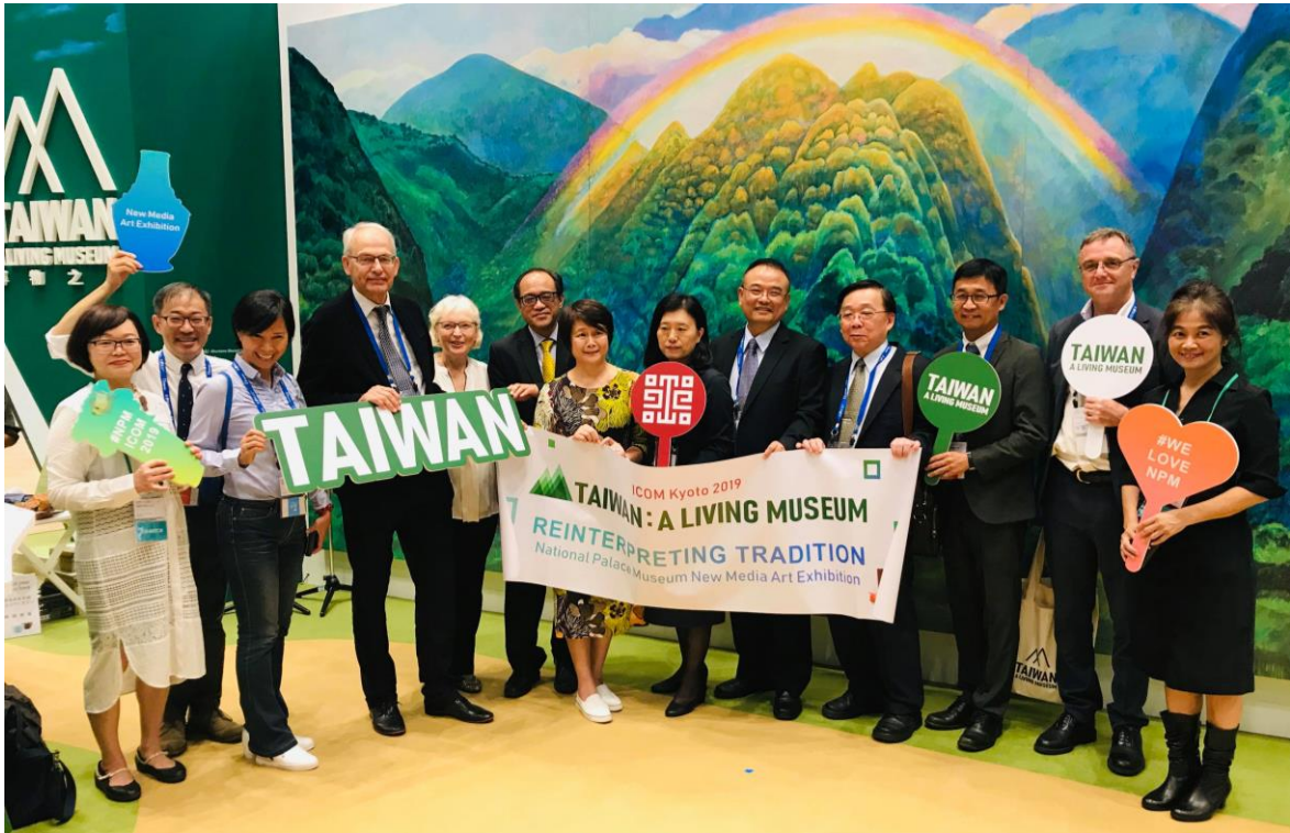
圖 8、國際博物館博協會京都大會之臺灣展會開幕式

除了持續參加會議外，晚上本館出席由國際博物館協會於京都國際會展中心（Kyoto International Conference Center）舉辦的開幕晚宴，除了歌舞伎表演（圖 9），搭配美食與美酒，以及精采的煙火秀作為結尾，為大會後續的國際研討交流活動揭開精彩序幕。