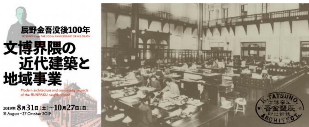
圖 18、京都府京都文化博物館「辰野金吾沒後 100 年 文博界限の近代建築と地域事業」海報

京都文化博物館同時正展出「辰野金吾沒後 100 年 文博界限の近代建築と地域事業」(圖 18)，選在辰野金吾 (1854－1919) 逝世 100 周年之際，介紹京都文化博物館地區的現代建築的歷史以及有關其保存和利用的區域項目，尤其是東京車站、國會大廈，以及與其徒弟長野宇平治共同設計的日本京都銀行，於 1969 年被指定為日本的重要文化財產，代表明治的西式建築。該展並與相關的日本銀行貨幣博物館和東京站畫廊共同合辦，希望能藉由這次展覽引起關於如何保護和利用現代建築的廣泛討論。