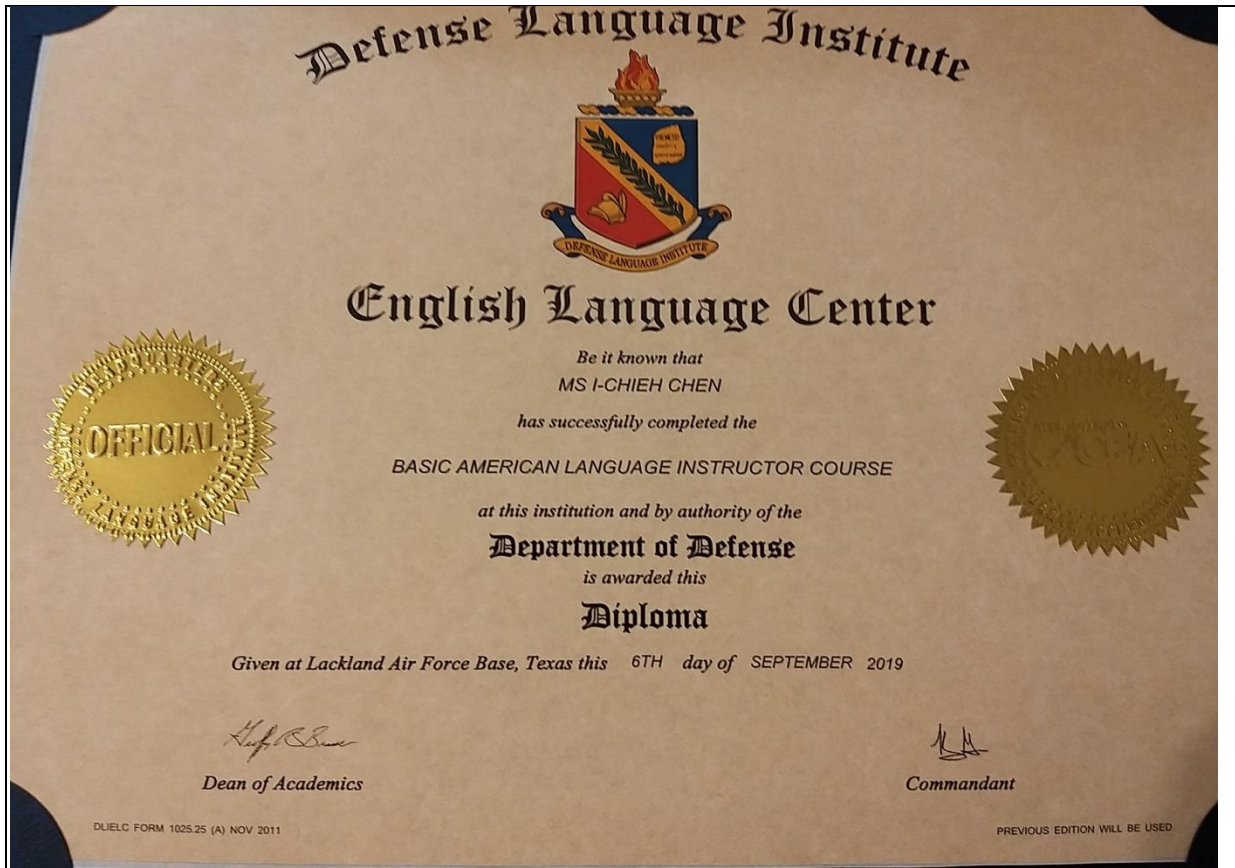
美國國防語文機構英語語言中心結訓證書