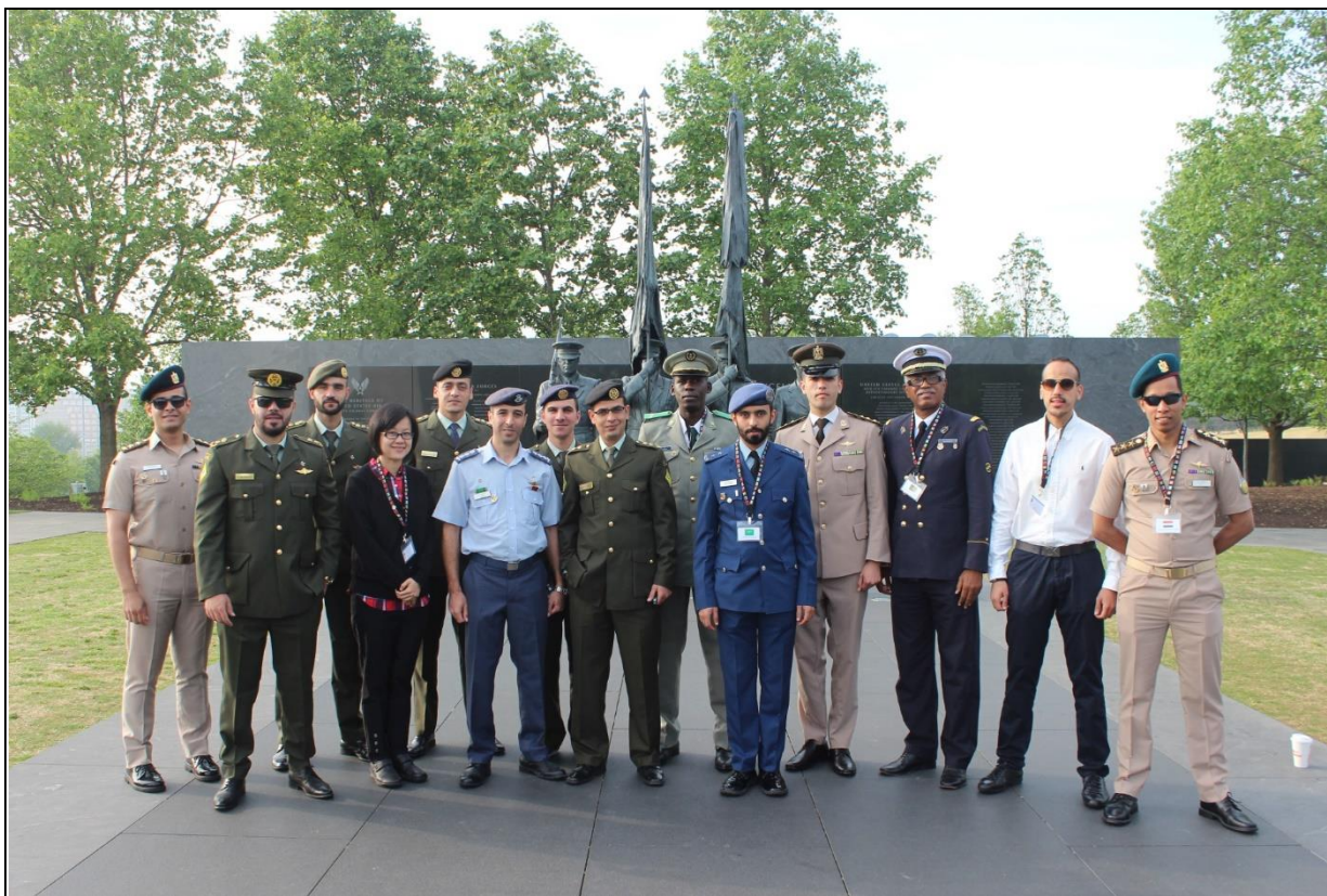
華 盛 頓 特 區 參 訪 合 影