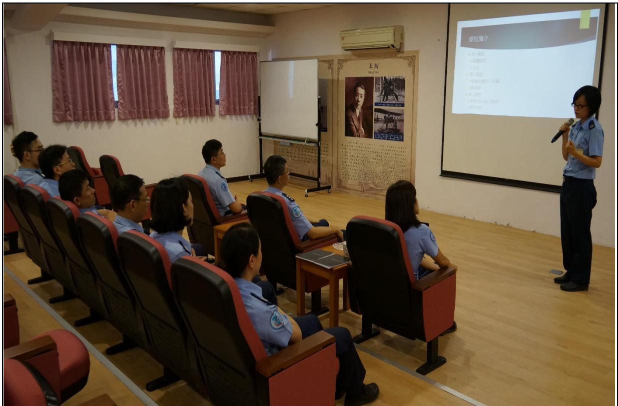
返國後與英語教官經驗交流並實施擴訓