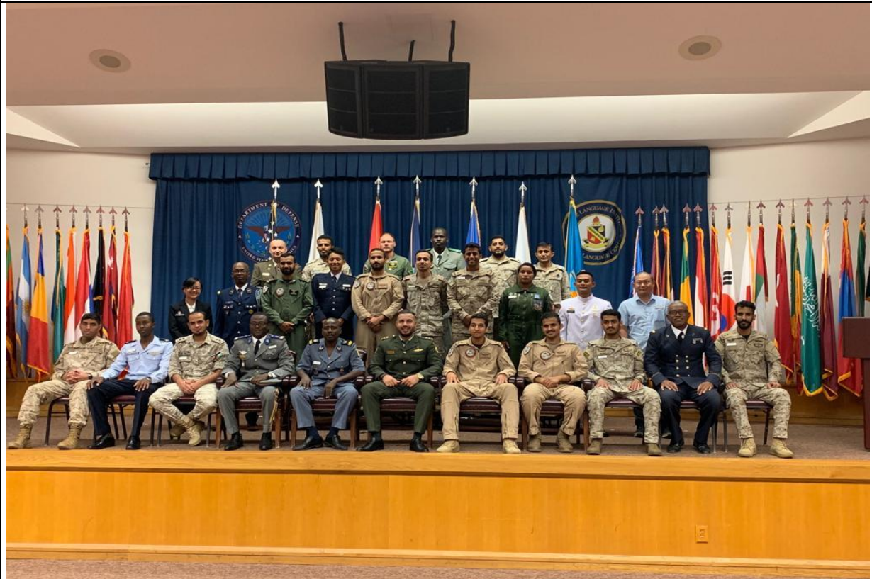
美國國防語文機構英語語言中心結訓合影