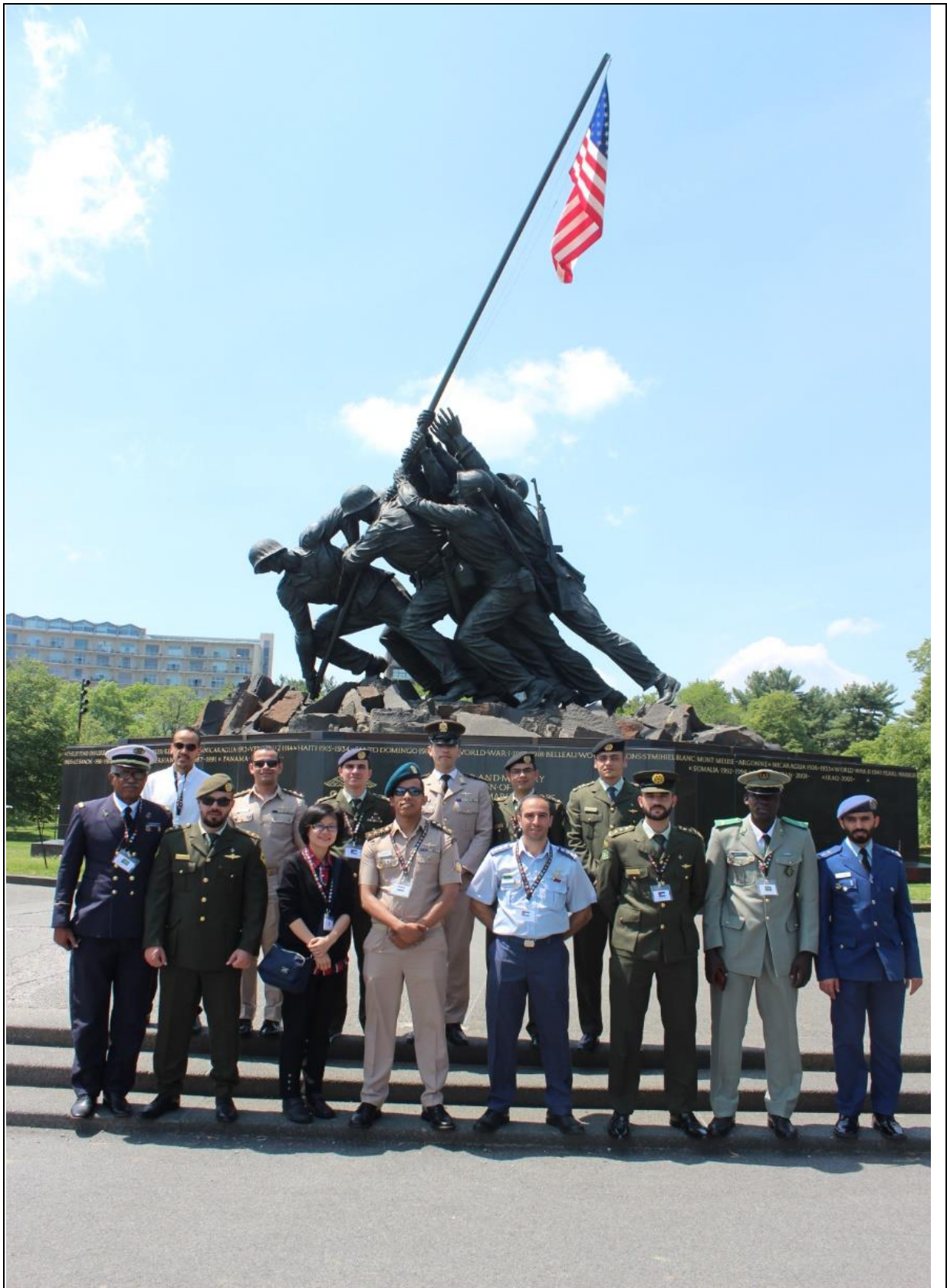
華 盛 頓 特 區 參 訪 合 影