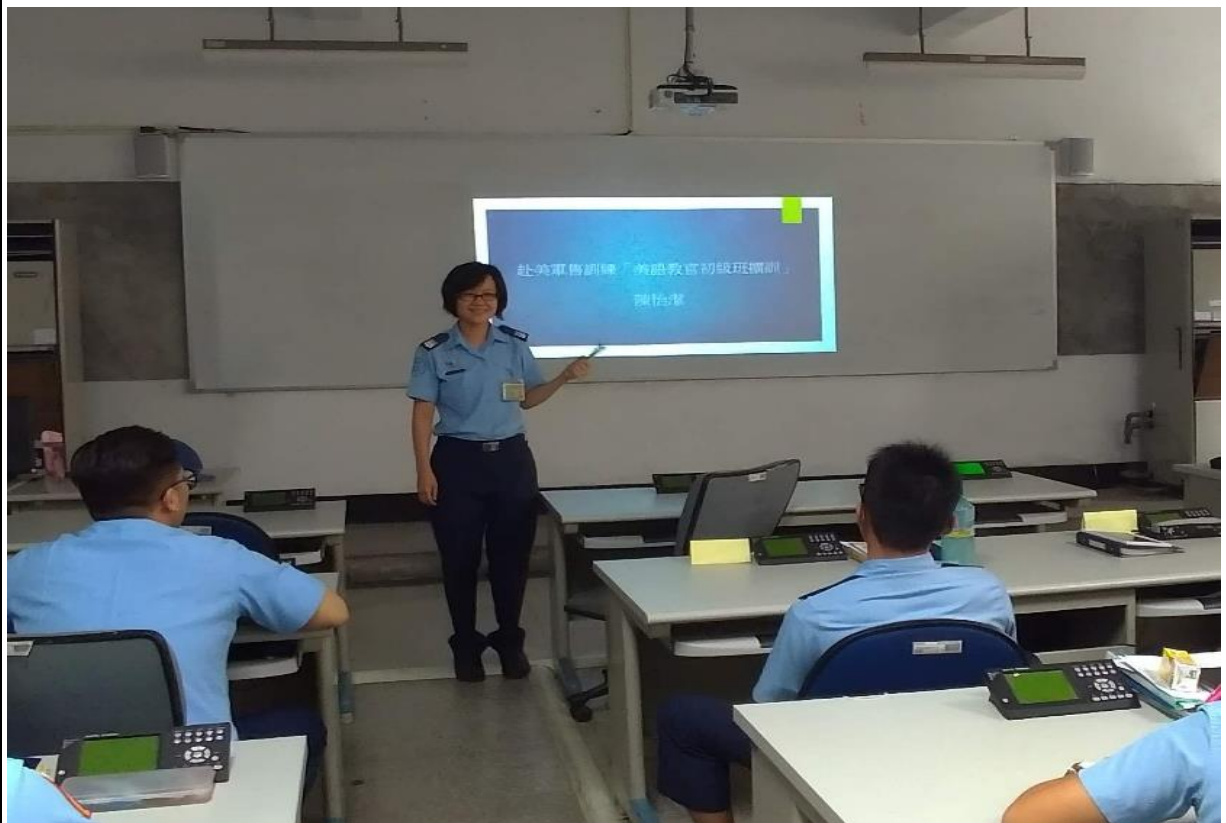
返國後與學員分享赴美受訓經驗