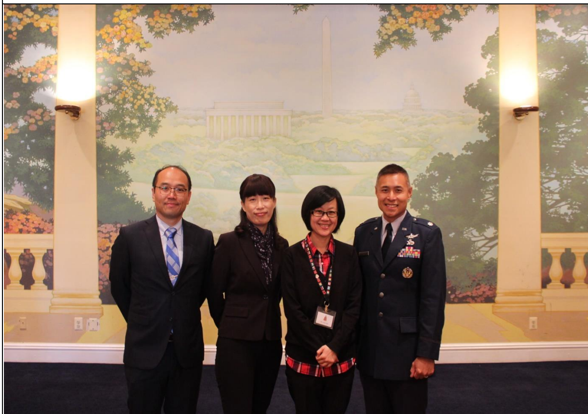
華 盛 頓 特 區 參 訪 合 影