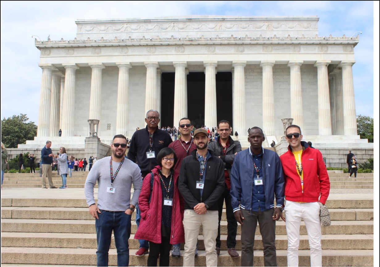
華 盛 頓 特 區 參 訪 合 影