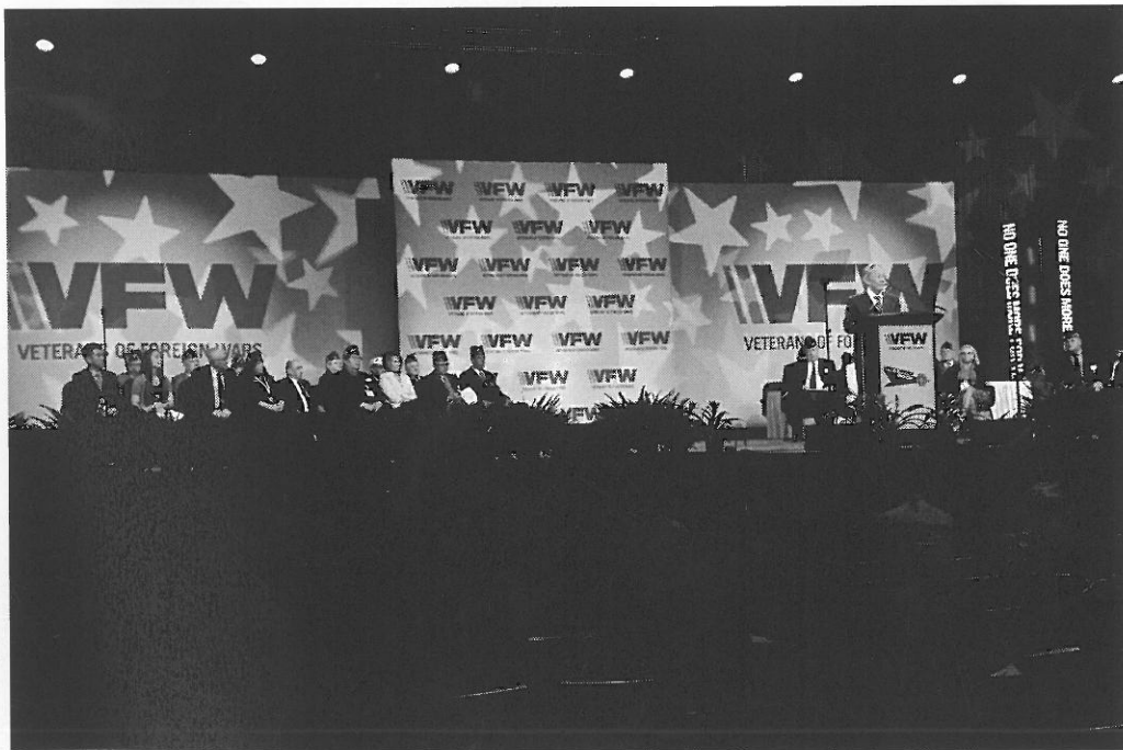
呂副主任委員以貴賓身分於大會致詞情形