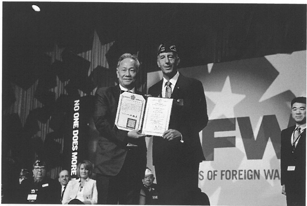
呂副主任委員代表本會頒贈勞倫斯總會長榮光專業獎章