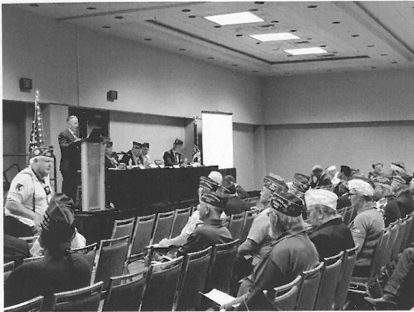
呂副主任委員於國防安全暨外交事務委員會致詞情形