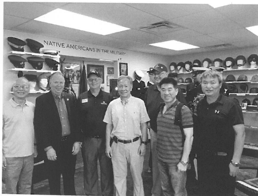
呂副主任委員與斷箭市市長 (左二) 及 軍事博物館館長 (左三) 合影