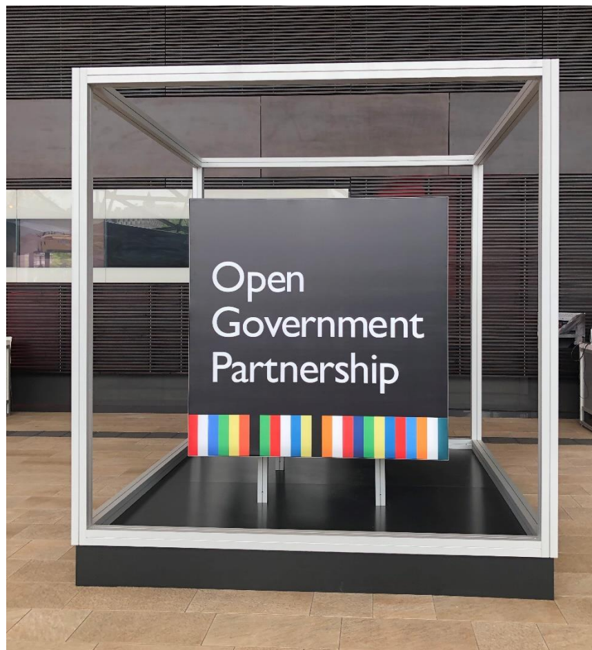
圖 2：2019 年 OGP 座標

2019 年 OGP 全球峰會，我國由行政院唐鳳政務委員、國家發展委員會，以及透過外交部補助經費，由開放文化基金會、綠色公民行動聯盟等代表共同參與。