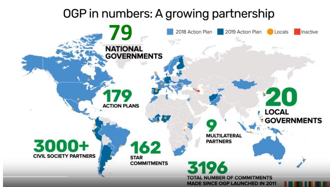
圖 1：OGP 簡要統計

「開放政府」概念在 1950 年代於美國提出，相對於過去集權、封閉的決策模式，強調由內而外的施政透明、可課責，以及由外而內重視公民參與的民主政府型態。開放政府夥伴關係聯盟（Open Government Partnership，以下簡稱 OGP）於 2011 年由巴西、印尼、墨西哥、挪威、菲律賓、南非、英國及美國等 8 國政府組成，共同簽署並倡議「開放政府宣言（Open Government Declaration）」，迄今已超過 79 個會員國和 20 個地方政府。每個成員每兩年提交一份與民間社會共同撰擬的行動計畫，包括提高透明度、課責和公眾參與的政府具體承諾。目前已累積達 179 個國家行動方案（National Action Plan），並提出超過 3,196 項促進政府透明的承諾（Commitment）。