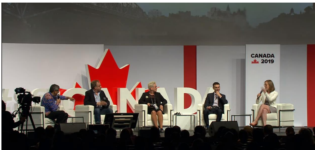
圖6：全體會議「對民主的威脅」