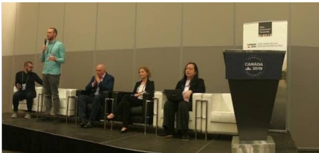
圖 8：唐鳳政務委員參加與談

唐鳳政務委員並在與談結束前，重申政策推動就是要納入公民或民間團體的意見，包括技術、專業等，透過參與平台及協作會議等，找出更好的解決問題方法。我國推動政府資訊公開透明、公民賦權、公民參與、議會開放、數位治理，已有一定成效，接下來，將邀集各公民團體一起參與推動我國開放政府「國家行動方案」。