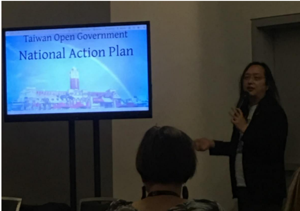
圖 9：唐鳳政務委員宣布推動我國開放政府國家行動方案