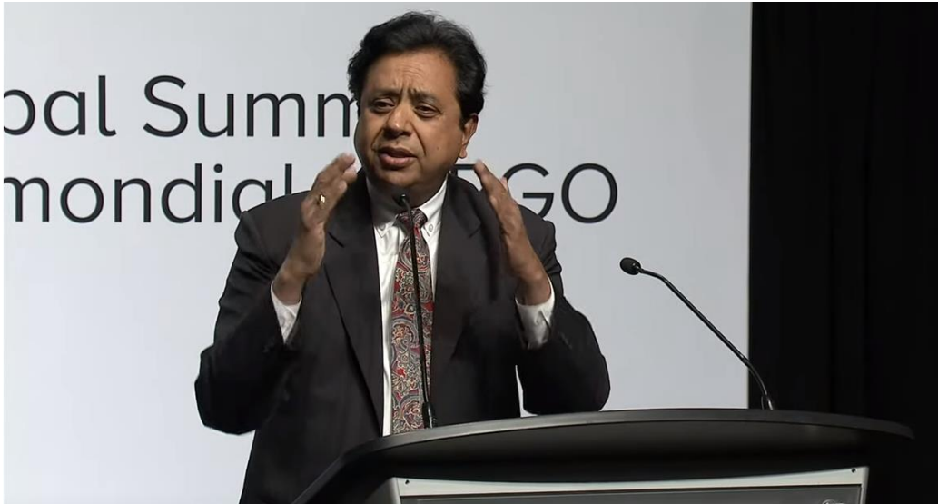
圖 5：OGP 首席執行長 Sanjay Pradhan