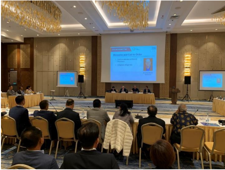
照片 19 PATA Board Meeting