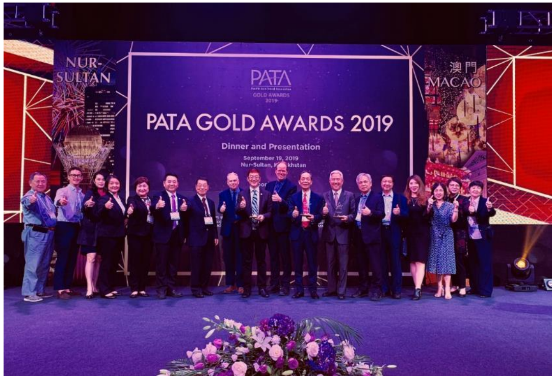
照片5. 2019 PATA 金獎頒獎典禮之臺灣代表團合照