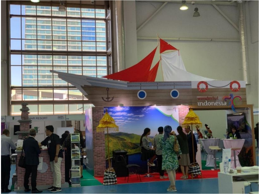
照片 11 PATA 印尼館