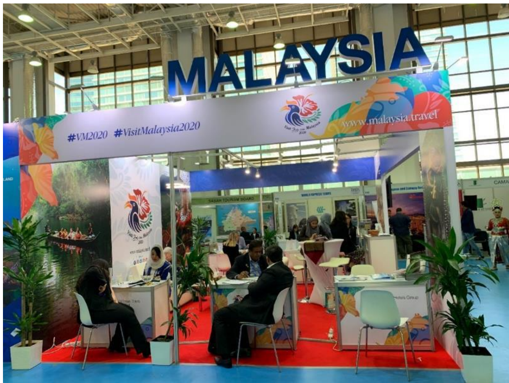
照片 12 PATA 馬來西亞館