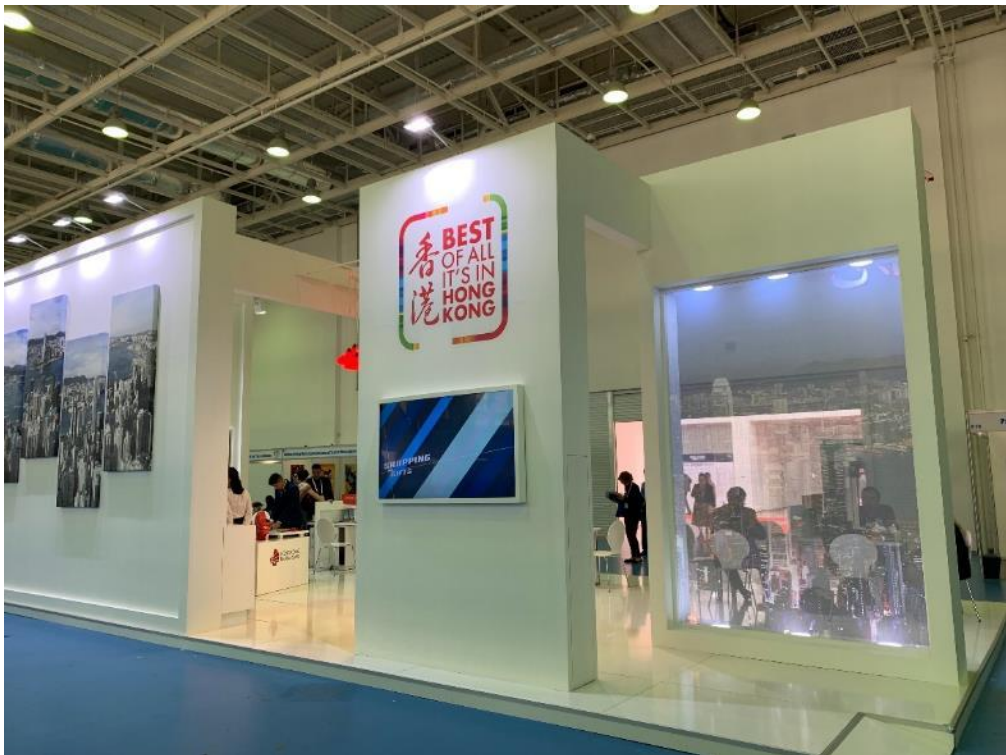
照片 14 PATA 香港館