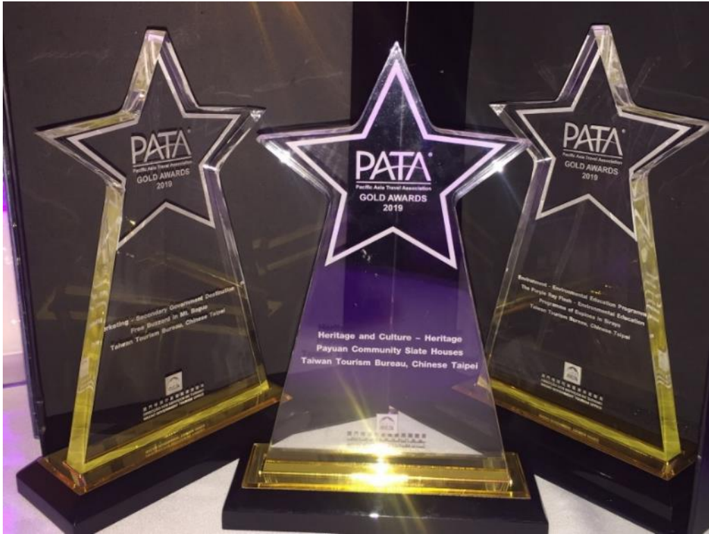
照片 7. 2019 PATA 臺灣獲得三獎殊榮：旅遊目的地行銷金獎、環境教育金獎及文化遺產金獎