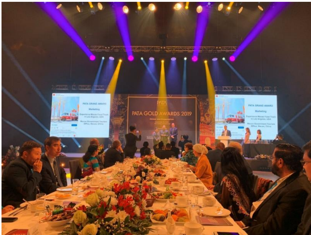
照片4. 2019 PATA 金獎頒獎典禮會場