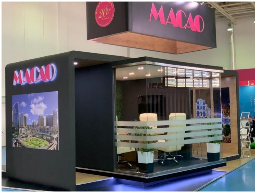
照片 13 PATA 澳門館