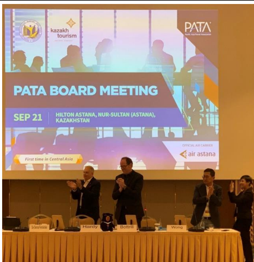
照片 16 PATA Board Meeting(臺灣喔熊玩偶端坐主席台)