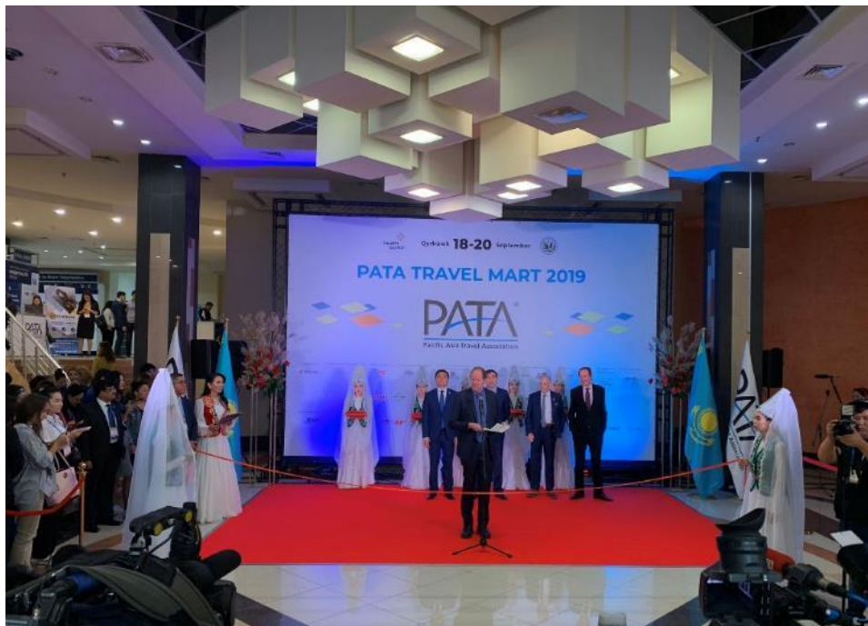
照片 1. 2019 PATA 開幕剪綵