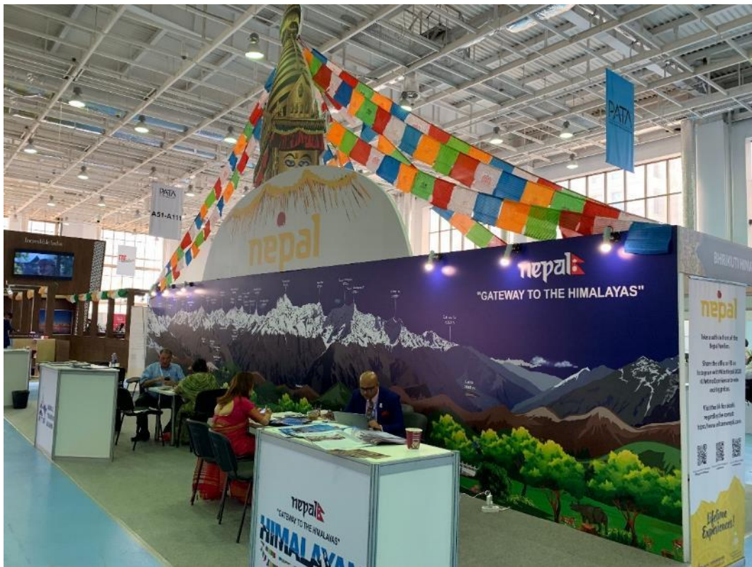
照片 8 PATA 尼泊爾館