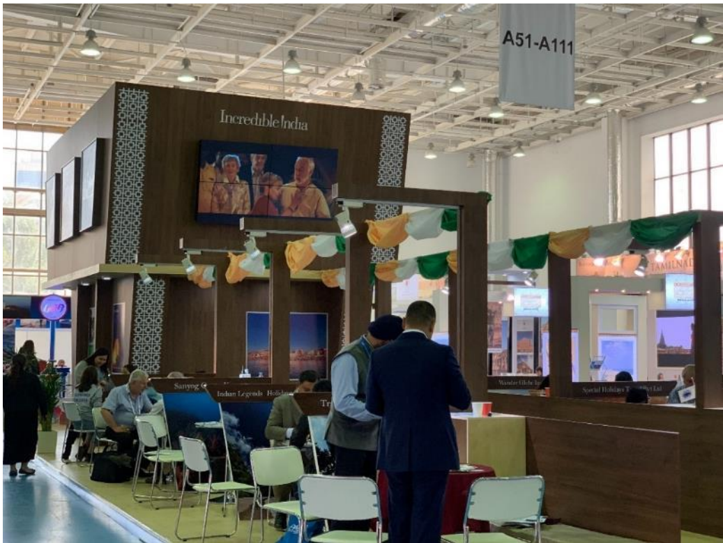
照片 10 PATA 印度館