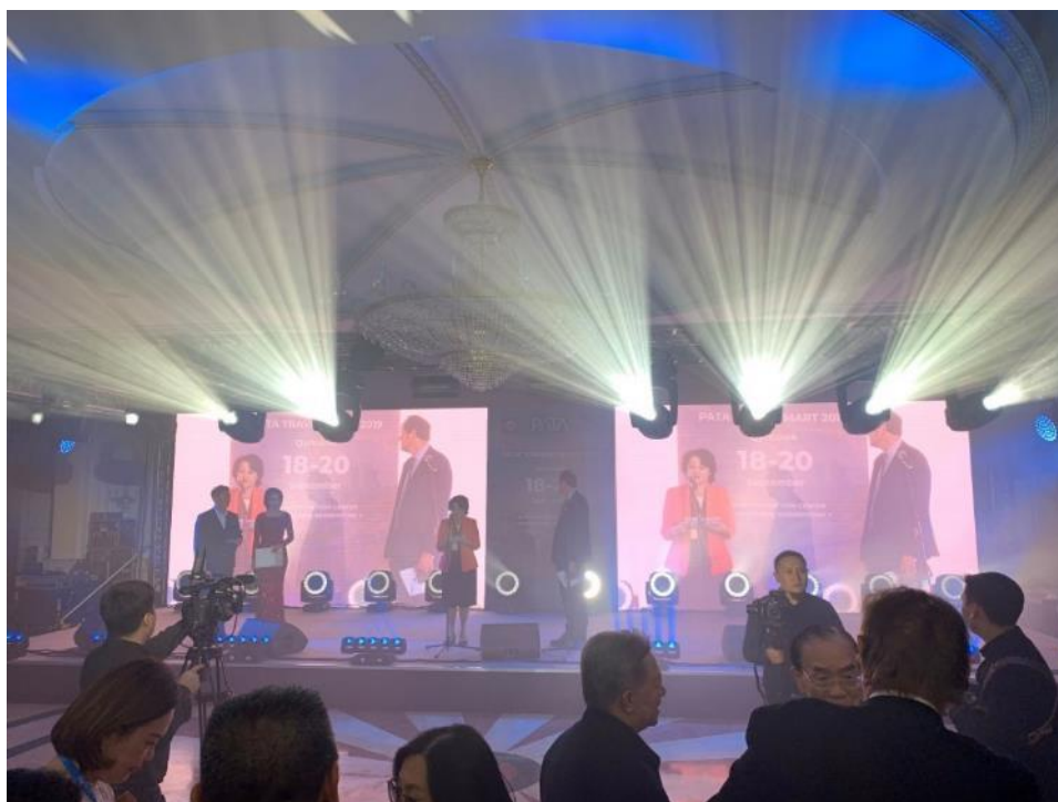
照片 2. 2019 PATA 開幕晚宴