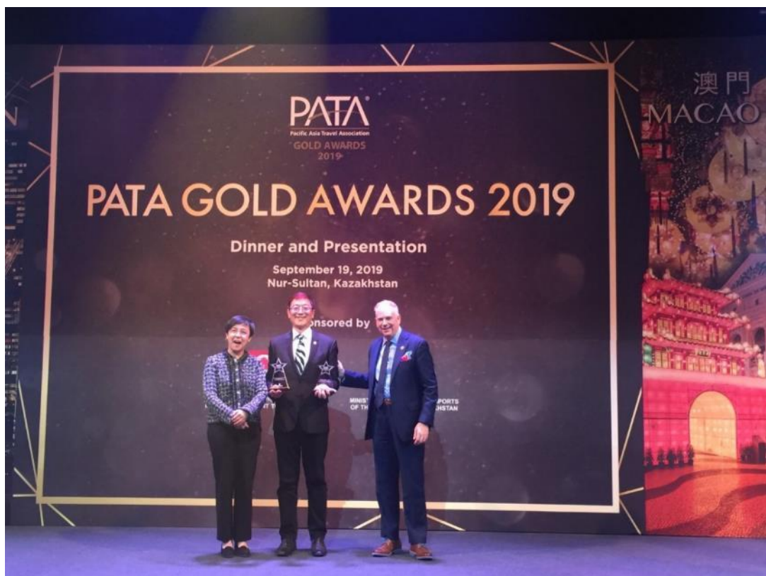
照片6. 2019 PATA 金獎頒獎典禮之臺灣獲獎照