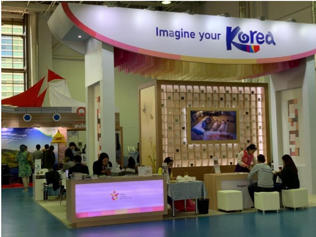
照片 9 PATA 韓國館