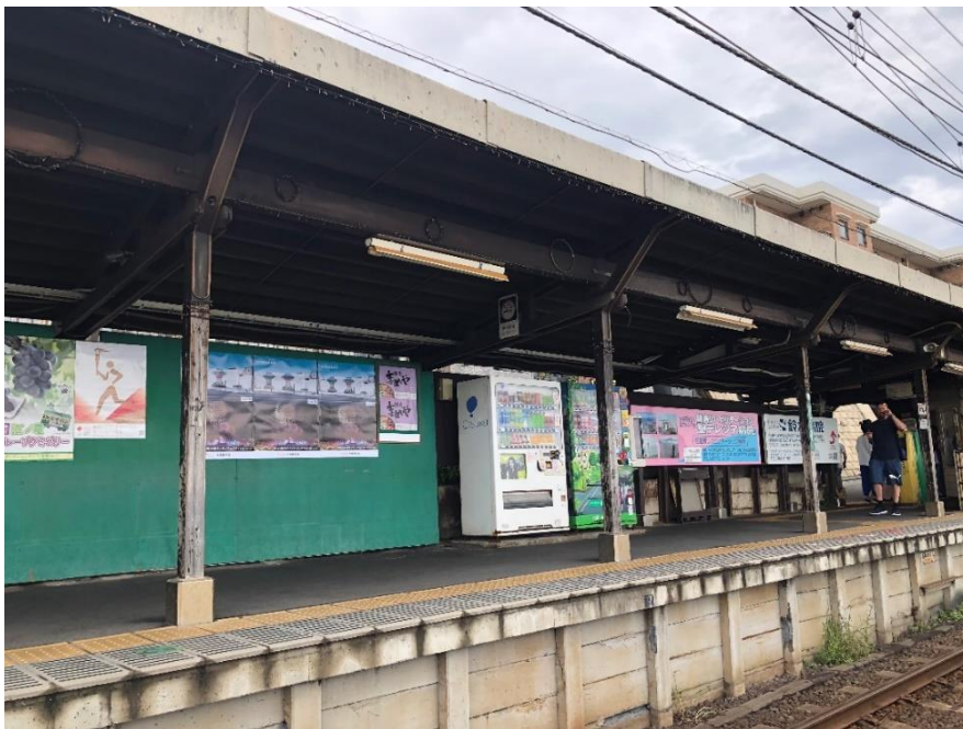
本局駐東京辦事處於江ノ島電鐵沿線車站刊登台灣燈會廣告