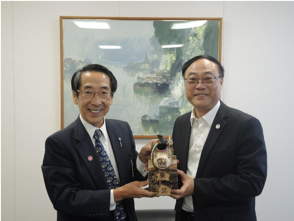
本局致贈根津社長以臺灣檜木製作的原住民木工藝品