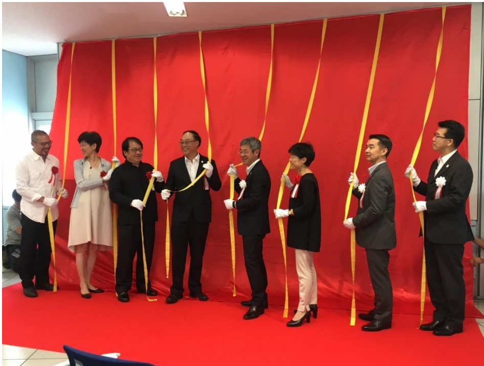
臺灣文化觀光廣告牆揭幕式臺日貴賓神情興奮倒數揭幕。