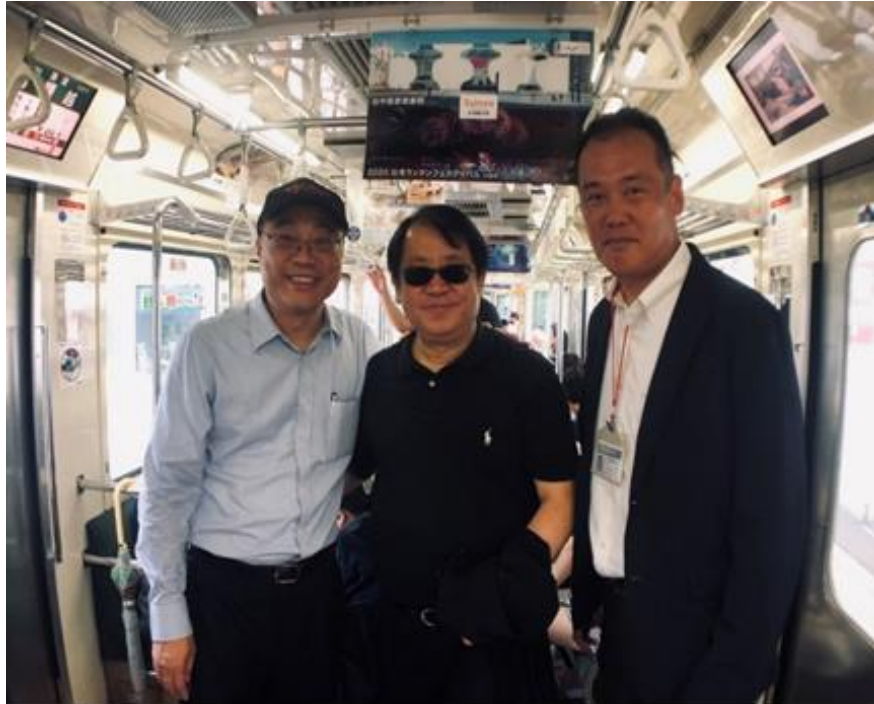
本局駐東京辦事處於車廂內刊登「2020 台灣燈會 in 台中」廣告