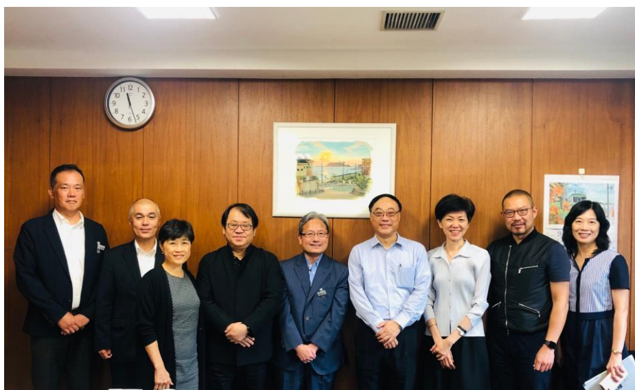
臺日與會代表合影留念