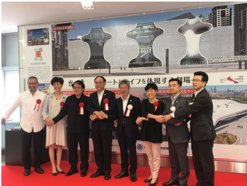
臺灣文化觀光廣告牆圓滿揭幕臺日貴賓牽手合影