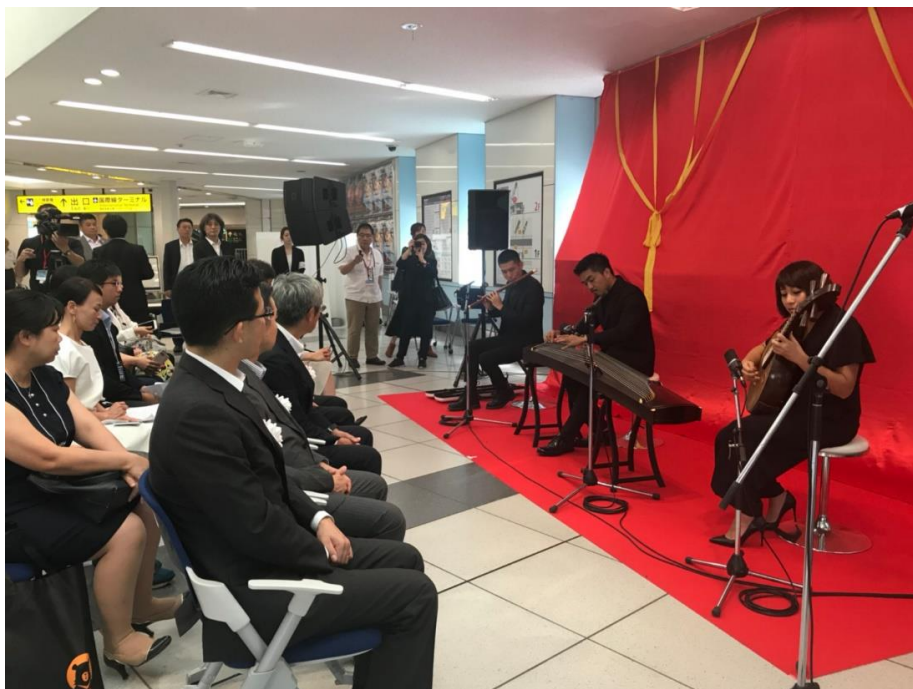
臺灣新生代表演藝術團隊「三個人 3peoplemusic」揭幕式前演出

本次廣告設計概念特別以日本建築師伊東豐雄設計的台中國家歌劇院為主呈現，同時也把擁有 30 年以上歷史知名的台北兩廳院，以及去 2018 年 10 月甫開幕即獲得國際高度矚目，且被譽為「史詩般的建築」的高雄衛武營國家藝文中心一起介紹給大家，邀請日本友人親自到臺灣，體驗充滿文化與藝術色彩的多樣觀光魅力。