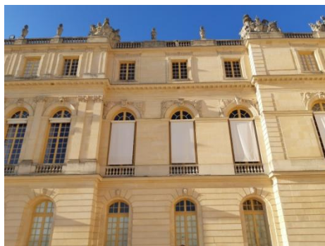
奧賽美術館與凡爾賽宮