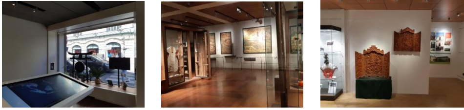
巴黎外方會的展場

下午的時候劉神父與三位代表外方會的人員，再加上我前往會議室開會，商討特展的內容。他們代表副會長，向館內感謝去年在館內推出的特展，他們也將法方所作的在期刊裡的同步報導翻出來。由於法國是天主教的國度，所以三位法方代表都表示希望能有多一點關於台灣文化的物件，不論是台灣原住民或是漢人宗教，對於法國民眾都具有吸引力。由於法國民眾對於天主教很熟悉，其實不需要在展場放太多與天主教相關的文物。此外他們也希望能夠多增加一些其他的神父的面板，原來的展場很小，僅介紹四位神父，法國的展區除了室內，還包含戶外面板，因此希望展出的內容能夠更豐富。