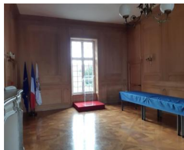
聖波德里翁的聖堂與市政廳展區