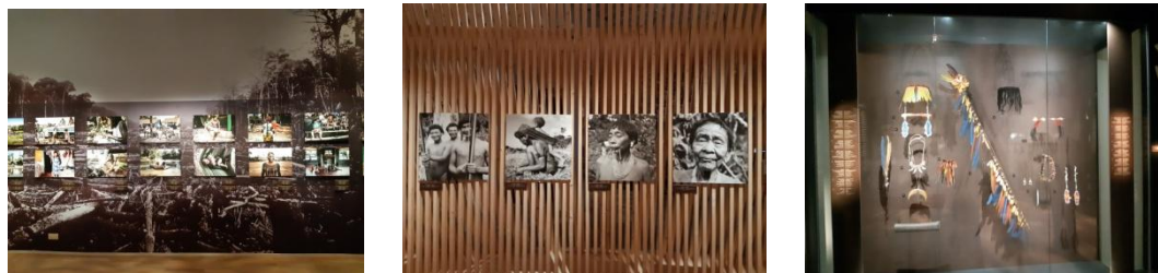
南特市的博物館參觀

南特市是布列塔尼的舊首府，因此藝文活動相當豐富，所以留在南特市參觀半天，後續不需要翻譯的人員陪同，所以李導演先回到巴黎市區。7月13日聖波德里翁的市長早餐宴，由劉神父代表出席，職與李導演都不再前往。由於時間緊迫僅參觀了安妮公主城堡裡的展覽，講述布列塔尼的歷史，安妮公主家族曾使用的家具、廚具、服飾等。安妮公主即位時僅有十二歲，當時神聖羅馬帝國派遣使者前往求婚，但是法國國王查理八世得知後，擔心領地落入他人手中而強行與安妮公主成婚。年僅十四歲的安妮公主因此嫁給法王保留領地，之後查理八世意外死亡，安妮公主在嫁給即位的路易十二。安妮公主共有十四個孩子，但是多早夭或是流產，僅有一個女兒存活，年僅七歲就許配給法王法蘭西斯一世，為的是保住布列塔尼公爵爵位。城堡裡的展示僅有法文，沒有英文輔助，但是有不少來自中國的文物，可以想像當時的貿易。