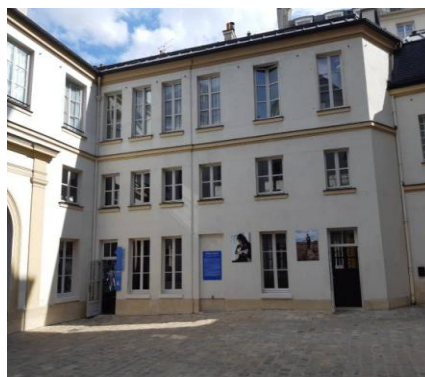
巴黎外方會的戶外展區