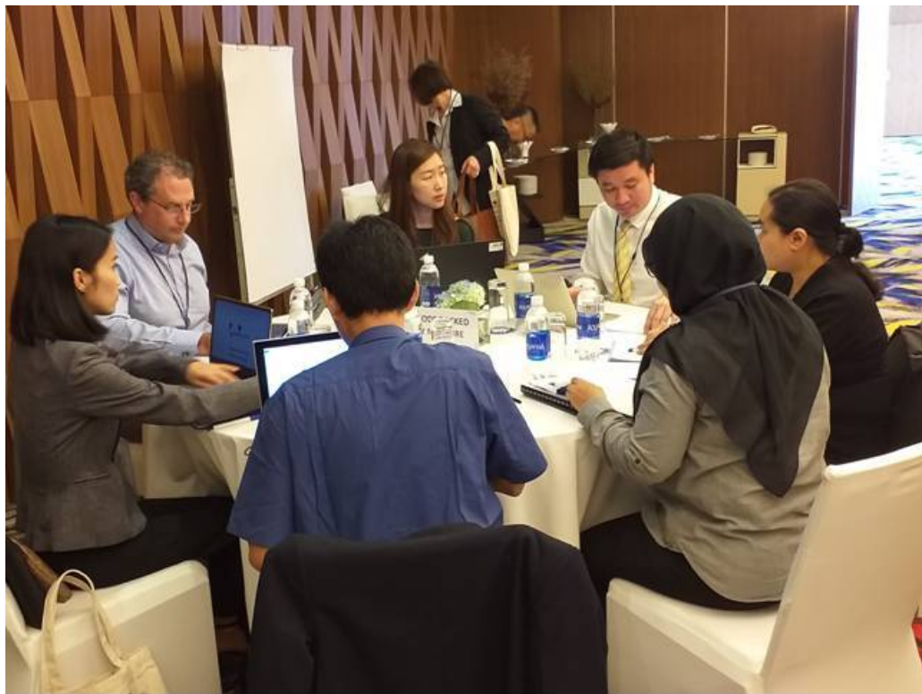
定量包裝商品工作小組討論