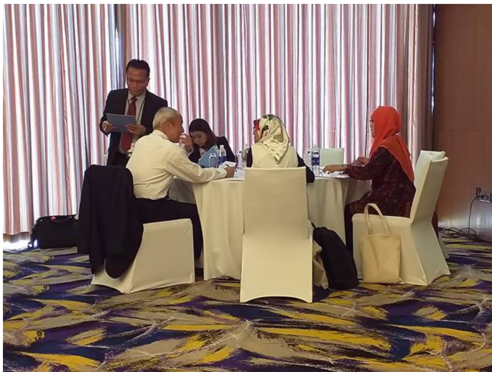
農產品品質量測工作小組討論