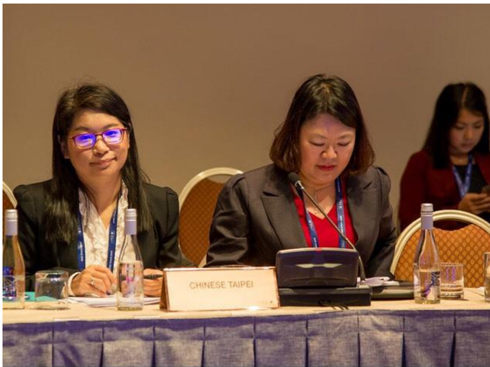
我國代表參與 PPWE 會議