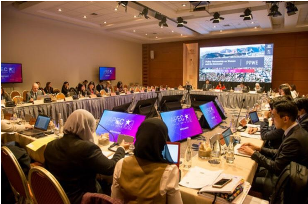
PPWE 第一次工作會議實況