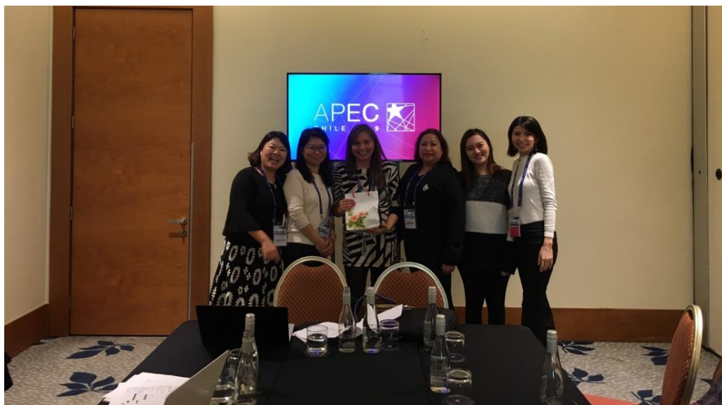
APEC 智慧農業性別化創新計畫工作小組