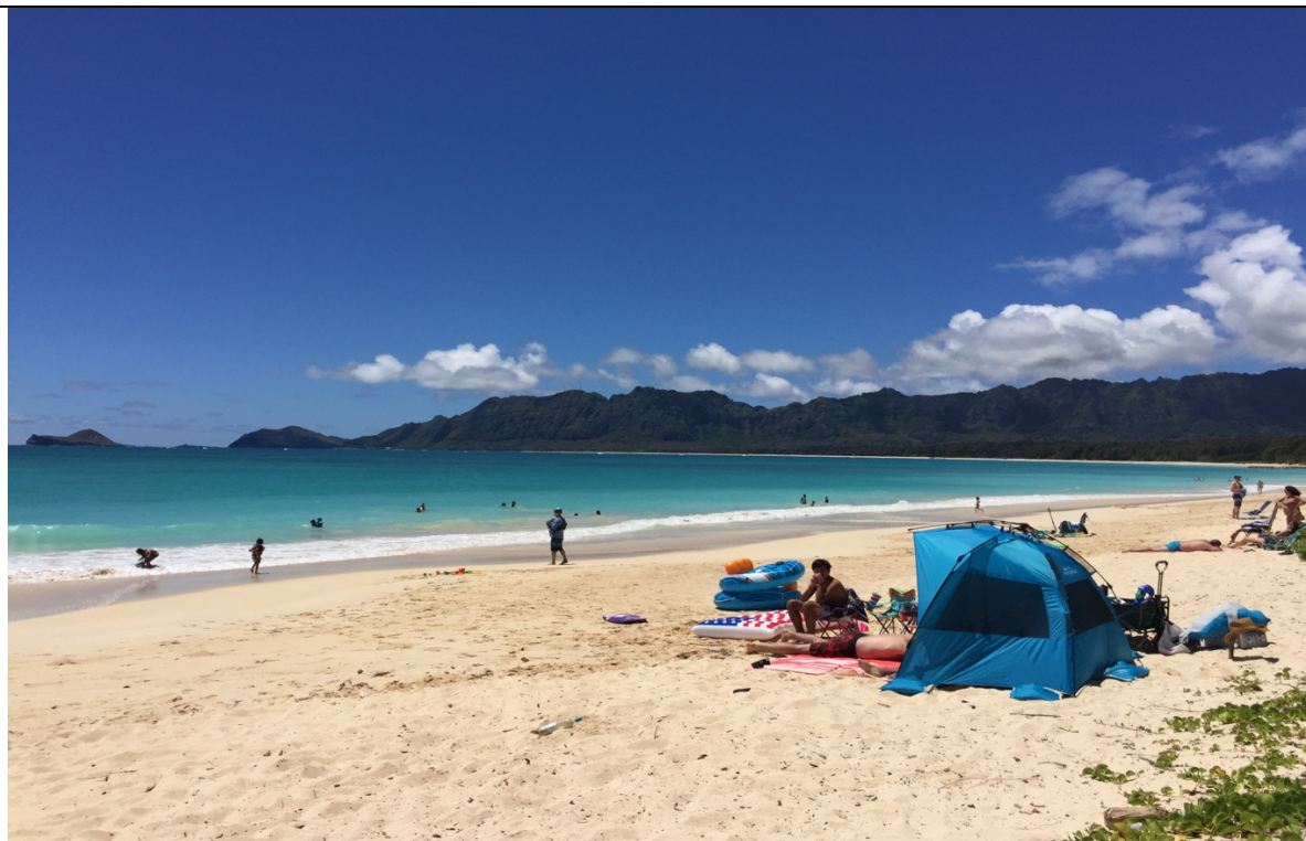
受訓翦影:營內海灘 （重視官兵營內生活設施，有效提升留營意願暨招募成效）