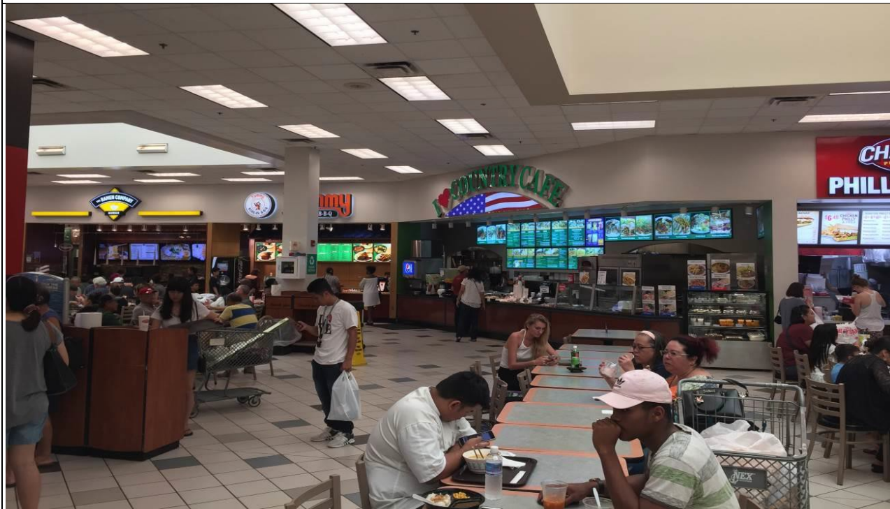
受訓翦影:營內美食街（免稅） （重視官兵營內生活設施，有效提升留營意願暨招募成效）