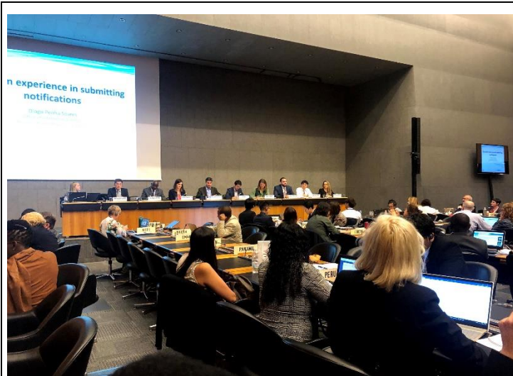
圖 1、透明化與工作協調研討會情形