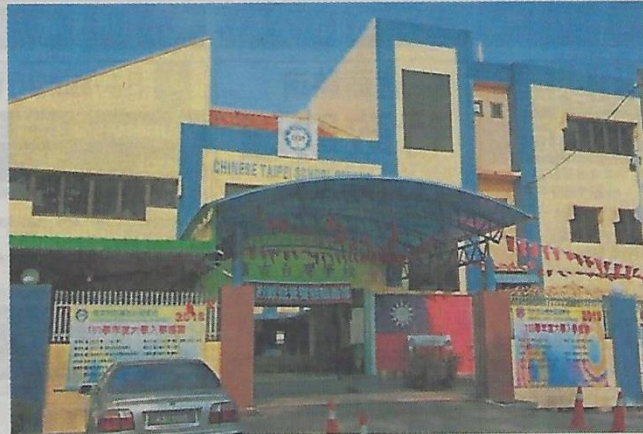
馬來西亞檳吉台灣學校於 2005 年搬遷至北賴才能園現有校園，隨著該校於 8 月 1 日停止辦學後，該校將正式走入歷史。

生却非常幸運，因為是有史以來最多嘉賓及最熱鬧的畢業典禮，許多校友及歷任校長教師皆從國外返回學校，見證學校圓滿退場的历史性時刻。