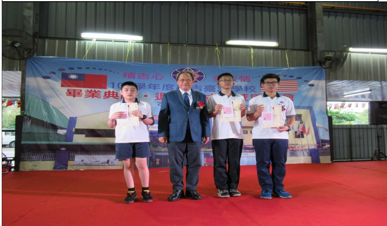
朱主任秘書（左二）與畢業生合影