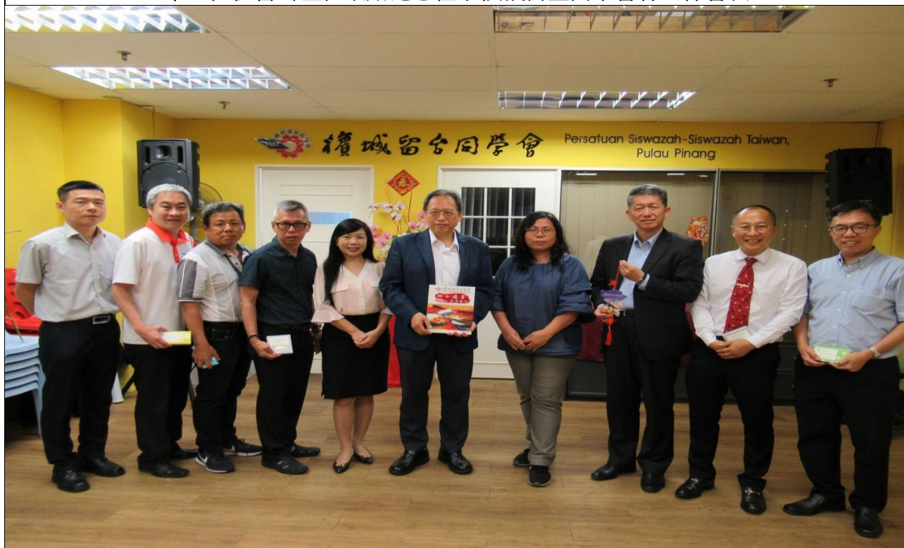
朱主任秘書（右五）與檳城留臺同學會理事代表合影