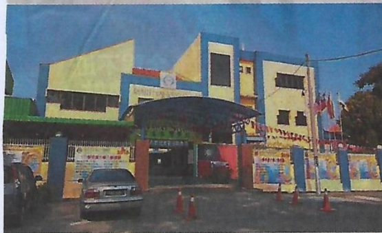
■马来西亚檳吉台湾学校外观。

（北海30日讯）前身是海外第一所台湾学校——檳城台湾侨校的檳吉台湾学校，今日熄灯了！