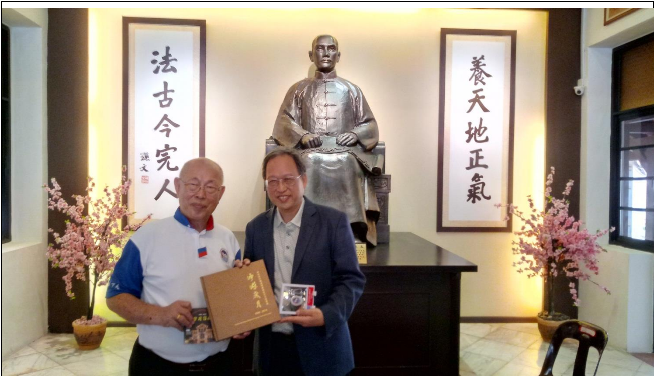
莊耿康館長（左）致贈朱主任秘書（右）紀念禮