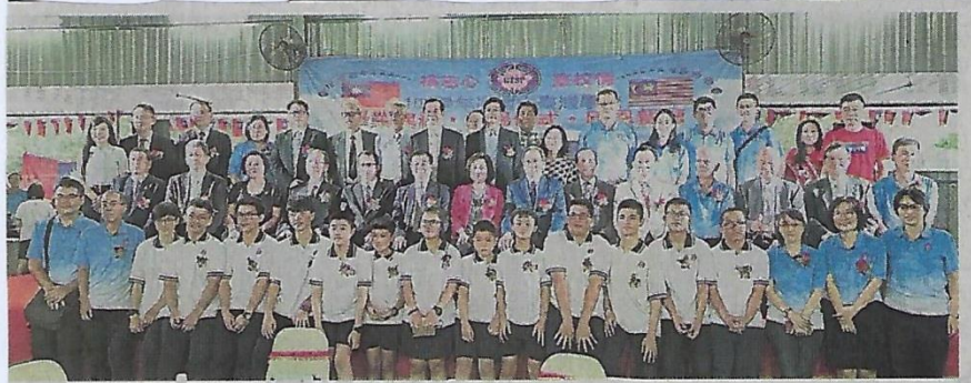
■14名毕业生与嘉宾大合照，留下历史性的一刻。