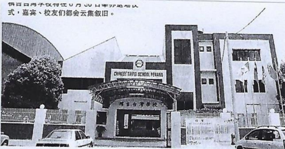
供日內子校特在日內30日舉行的儀式，嘉賓、校友們都會雲集歡慶。