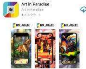
▲入口左側大螢幕 播放宣傳廣告短片及館方開發 APP 使用 AR 體驗