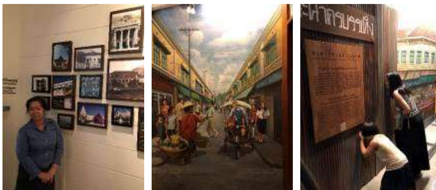
▲ 導覽人員簡介邦蘭鋪博物館的發展歷程

館舍規模精巧，處處可見其用心，頗近於台灣推動社區總體營造的理想，賦予社區博物館實踐塑造地方特色、凝聚社區意識、加強民眾參與等任務。然而，邦蘭鋪博物館在保存發揚地方特色同時，亦形象化地展示政府管理單位（財政部）的業務內容，提升民眾對政府的瞭解與認同感，不失為我國博物館所可茲借鏡的方式。