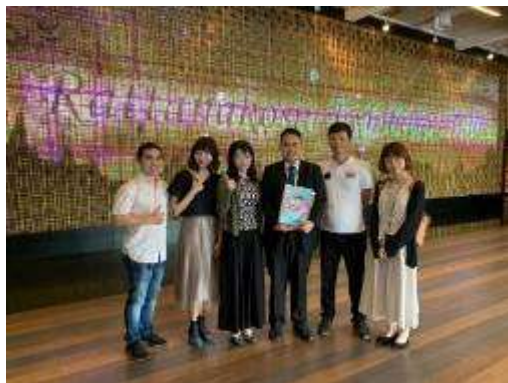
▲參訪人員致贈紀念品及與館方代表合影