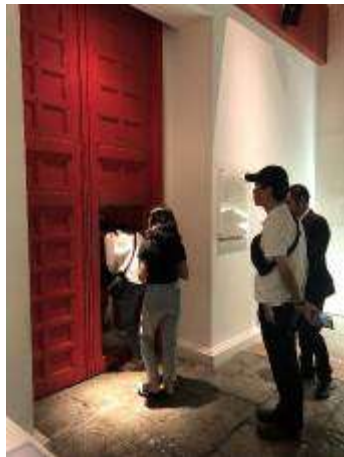
▼穿越狹窄的城門設計 進入皇宮生活展區