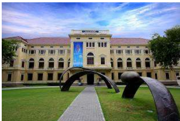
7 ▲ 建築外觀

他們有一間地圖室及沉浸式劇院，劇院中有一個長型螢幕，專門觀看泰國歷史的電影，鑑於該館並沒有館藏品，他們透過各種活動及博物館網絡吸引遊客，在泰國所有的公共教育服務中排名第一，該館每個展間都有著不同的主題，例如:「典型地泰國」、「曼谷」、「新大城」、「村莊生活」、「變化」、「政治與交流」、「泰國與世界」、「今日泰國、明日泰國」、「素萬那普的介紹」等等是為了讓泰國人民瞭解其國族身份、歷史及自身文化與鄰近國家文化的關係而創建的。