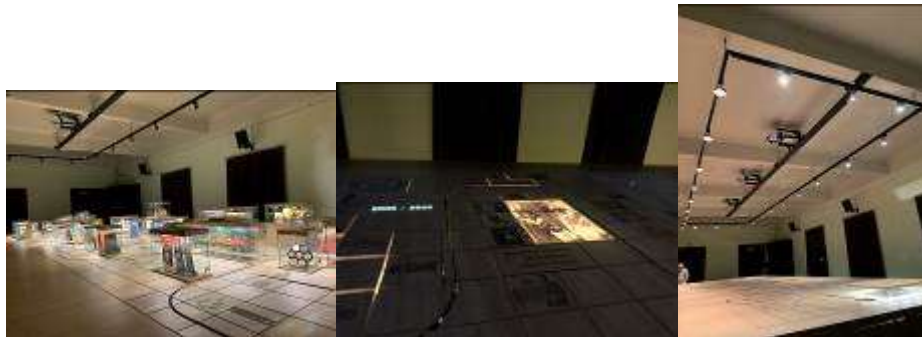
▲泰國歷史互動裝置的展間及其設備

館方人員表示，他們一年規劃兩檔主題展，也會有藝術巡迴活動，用五個貨櫃去各地巡迴展出，他們分為研究部門、場地管理、活動策畫、公關行銷及學術部門，他們與泰國各地博物館進行對接，相互合作及行銷，館內有 4 位策展人，策展人本身具備不同專業背景，相互合作激盪出不同的策畫主題，目前一年參觀人次為 20 幾萬人，預期未來地鐵開通後人數會明顯增長。