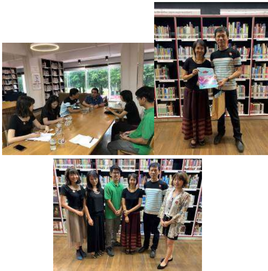
▲參訪人員與館方代表交流、致贈紀念品及合影