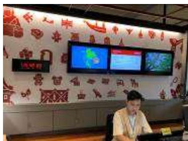
▲ 售票處及語音導覽租借櫃檯