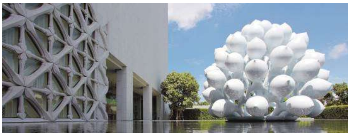
6 ▲充滿泰國傳統元素及現代藝術交融的入口右側的意象設計

展覽多數為常設展，這些泰國當地優秀作品是泰國的藝術能量是不輸世界其他國家及文化的最佳證明，也是該館最想傳達給觀眾的訊息。