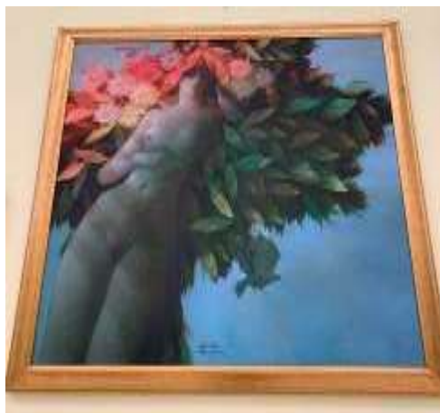
館長收集的第一幅作品《LADY》

硬體設備方面，該館全館均恆溫恆濕，因泰國天氣濕熱，展館以兩面牆維持內部乾燥以適合作品，展廳燈光以全場開燈方式，並未另外加設投射燈給予展件特別照明，館方用這種照明方式有兩原因，一為此方式是策展團隊認為最清晰的方法呈現作品，另一原因是給予所有藝術品均等的機會被呈現在觀者眼前，另外，每層展廳內均放置藝術家親手設計的座椅供民眾休憩，型態各異，添增該館的藝術氣息及生動活潑感。