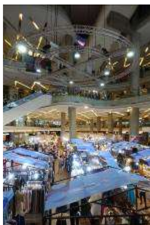
該館位於 The Esplanade 百貨商場內四樓

藝術天堂 3D 博物館是曼谷第一家 3D 藝術博物館，位於 The Esplanade 百貨商場內四樓，館內有兩層樓，分設六個展區，他們希望以一種全新的方式展示互動的 3D 藝術，該館除了每幅作品都能拍成 3D 影像以外，還有多幅 AR 效果的作品，只要民眾下載 ART IN PARADISE APP，就可以擁有會動的 3D 影像，似假似真、如臨實境的圖像及影像帶給觀者全新的藝術感動，該館的 3D 物件均為手繪，展示物件是以三維空間為主，觀眾可以拍照並觸摸畫作，照片讓觀者成為藝術作品的一部份，讓物件與觀眾融和在一起，在拍照的同時也激發他們的想像力，該館也展示了要如何享受 3D 帶來的奇幻視覺饗宴，意即觀眾不僅可以欣賞 3D 展件，還可以通過照片成為畫作中的主角，該館宣稱他們每一幅作品都是未完成品，當觀眾來拍照時，一瞬間作品就完成了。