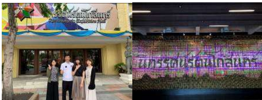
▲拉塔納科辛展覽館大門及入口互動感應裝置—山影與飛鳥意象

展覽館共九間展廳，每個展廳都有不同的主題，除了展廳外，該館於一樓設有一間 300 平方公尺的活動大廳供文化藝術活動使用，另有圖書館、紀念品商店及咖啡廳供民眾使用。