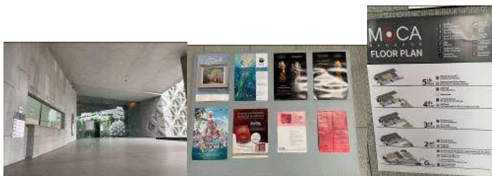
▲售票處、樓層簡介及佈告欄