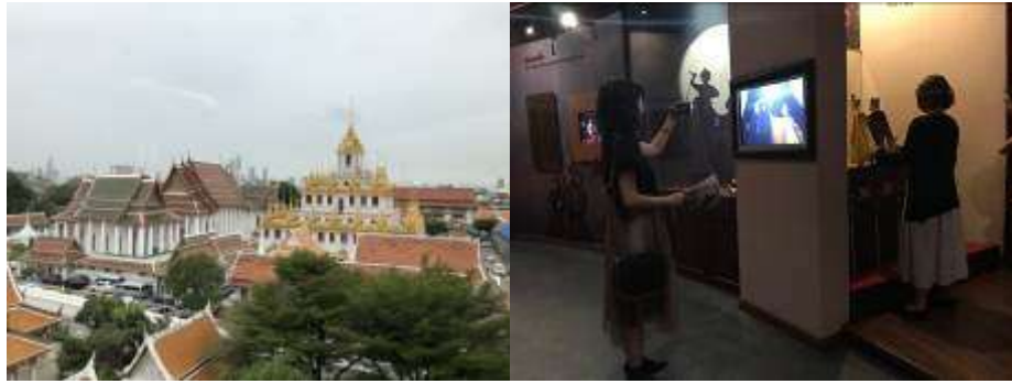
▲該館三樓觀景點望出去的景色及館內互動裝置