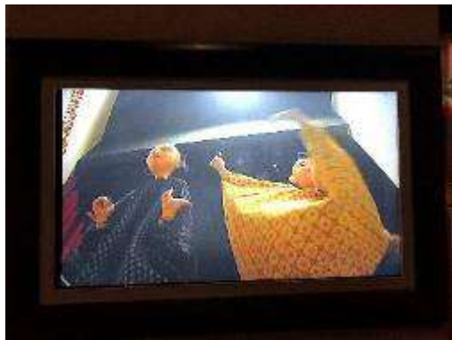
▲可親手操作泰國偶戲 並於螢幕上呈現