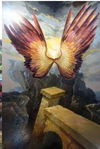
▲ 3D 物件實拍