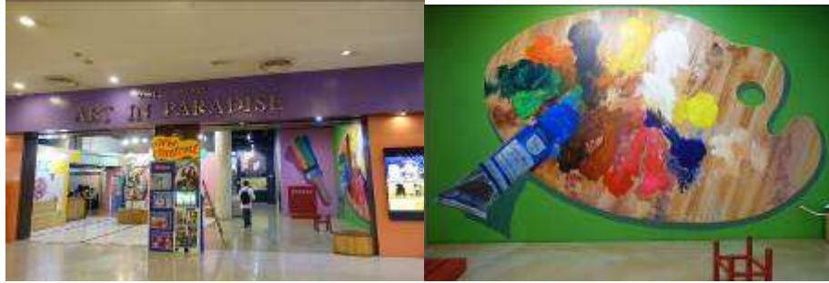
▲藝術天堂 3D 博物館門口及入口意象