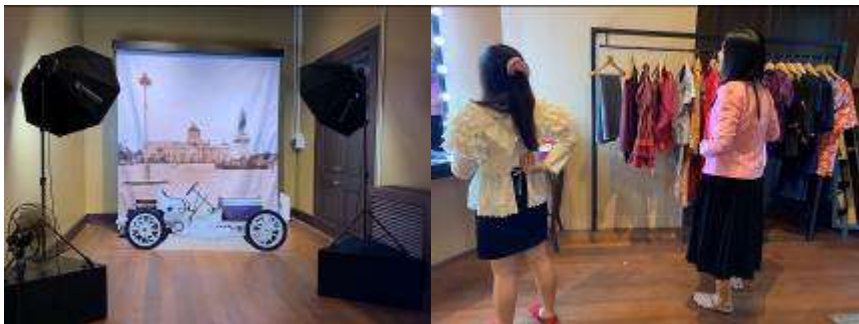
▲變裝體驗區(體驗泰國各時期的服裝特色)