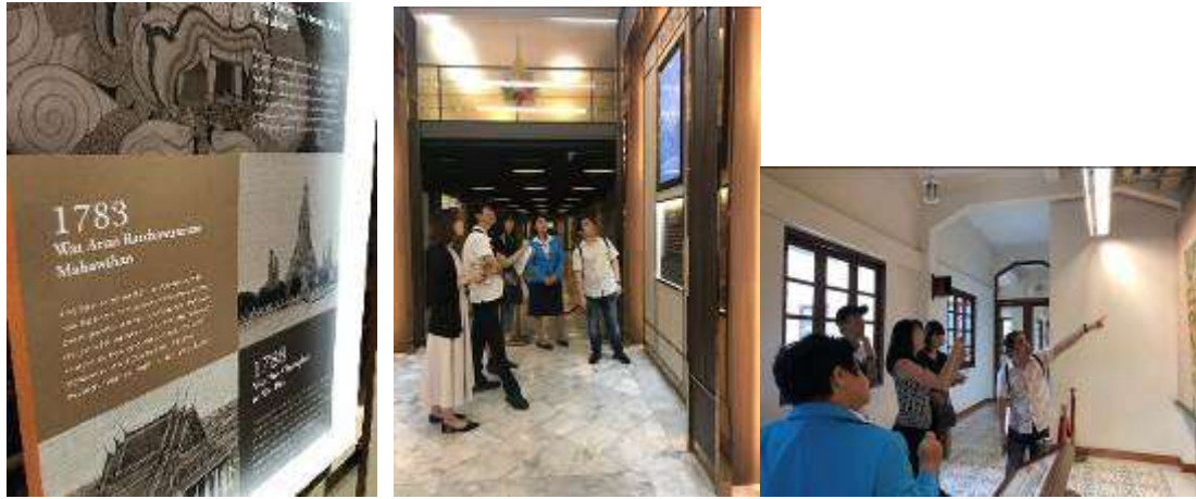
▲首先以時間軸搭配圖文呈現拉塔納科辛時代的歷史揭開序幕