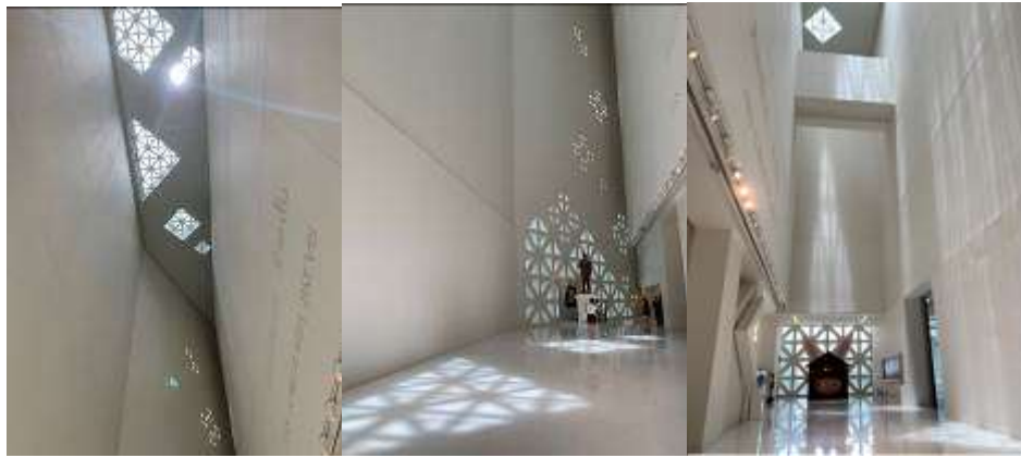
▲藝術是長遠的，但壽命是短暫的室內空間意象設計