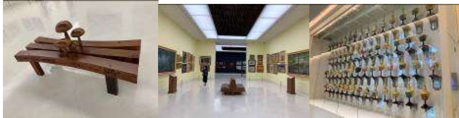
▲充滿設計感的椅子及館內的作品陳列及主要照明方式