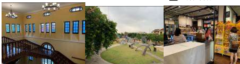
▲ 建築內部、園區及紀念品店