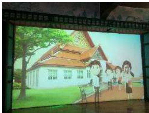
▲模擬舊式照相設備拍照 化身動畫主角走訪曼谷景點