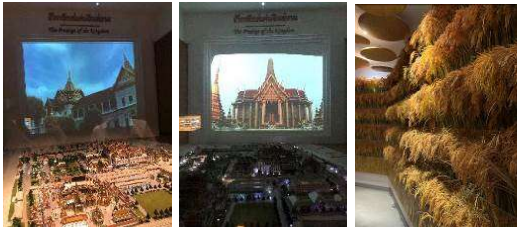
▲拉塔納科辛舊城一帶模型及影片介紹