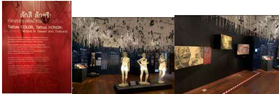
▲國立台灣博物館與暹羅博物館共同規劃的「文顏·文譽特展」(Tattoo COLOR, Tattoo HONOR)