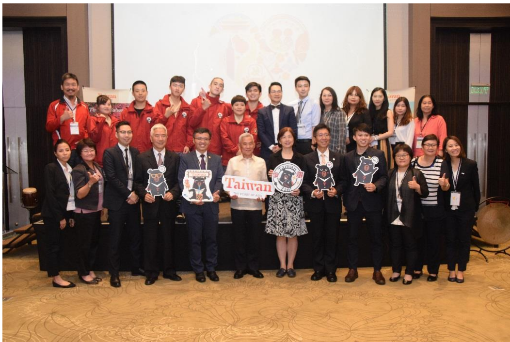
駐菲律賓代表與觀光代表團合影