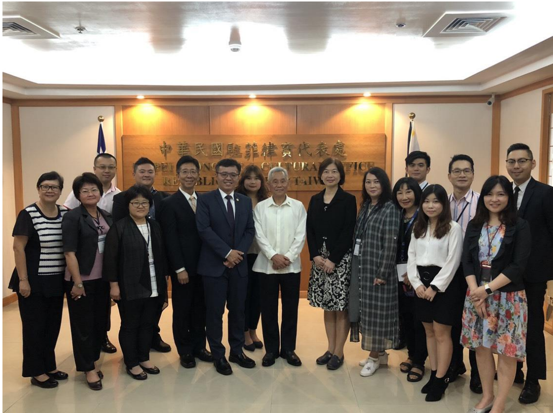
台灣代表團赴我駐菲代表處拜會