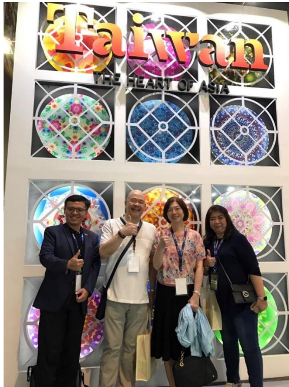
TME 旅展主辦單位代表至臺灣館致意