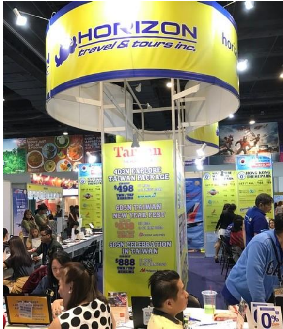
菲國旅行社將台灣旅遊產品列為銷售主力