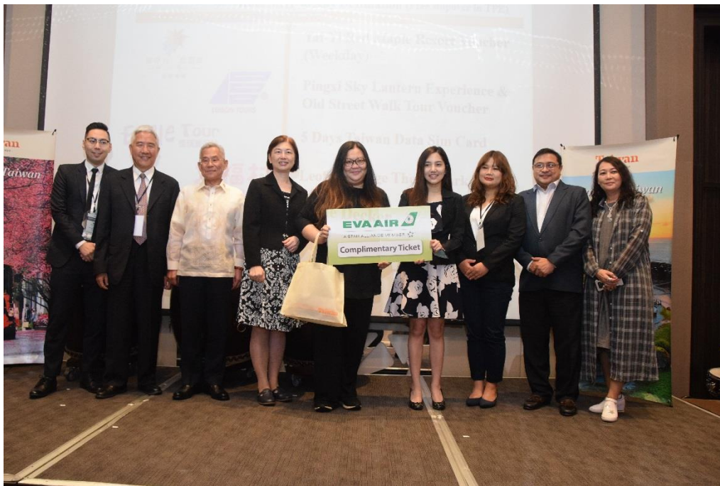
臺灣觀光推廣活動在全球不限點機票抽出後的歡呼聲中，圓滿結束