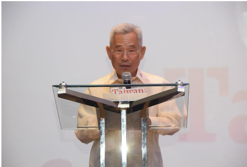
駐菲律賓代表處徐佩勇大使出席臺灣觀光推廣活動致詞