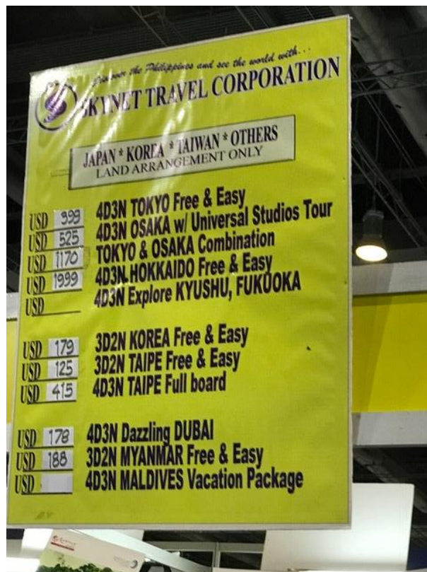
菲國旅行社將日韓台產品並列