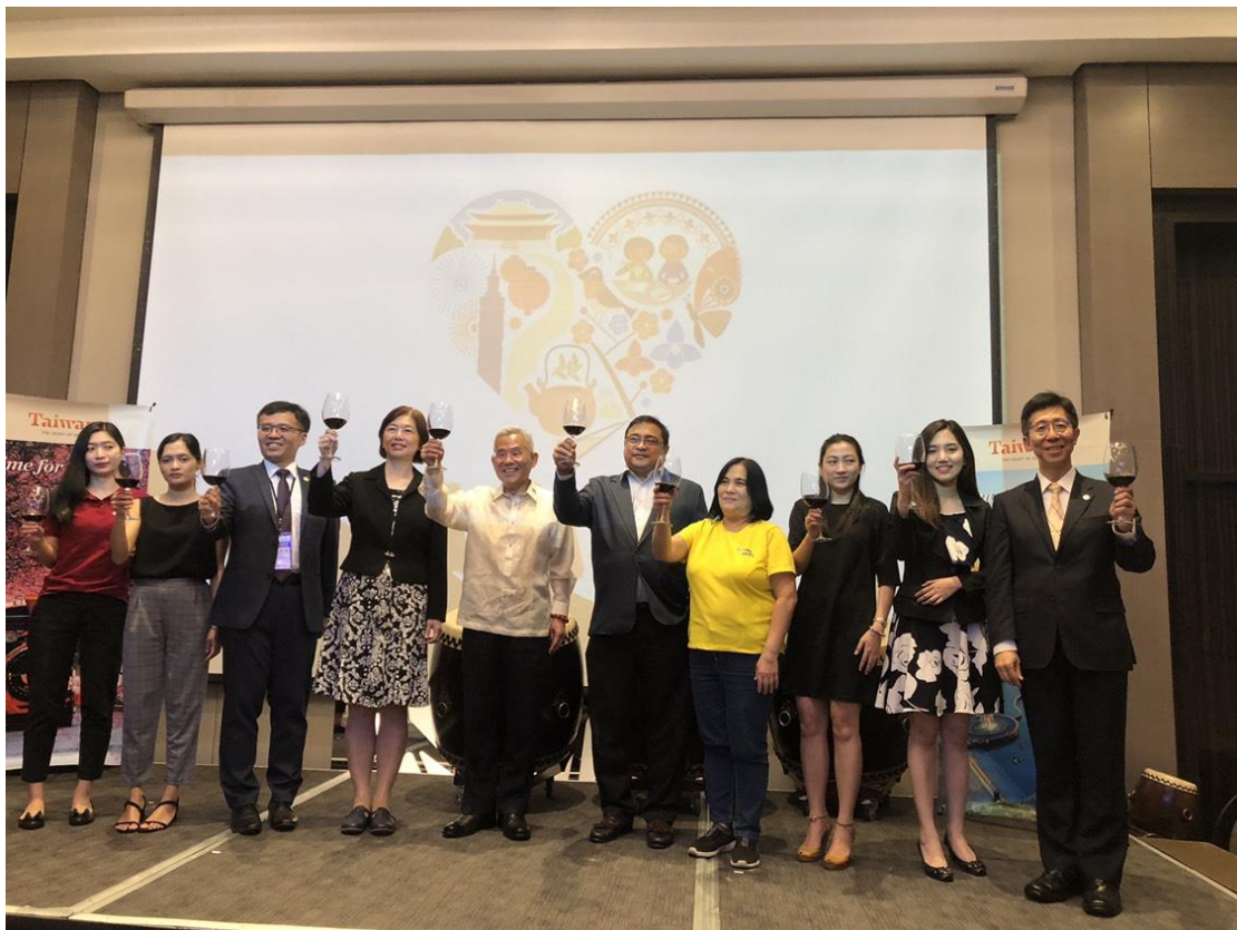
台菲雙方貴賓共同舉杯祝福未來兩國觀光榮景