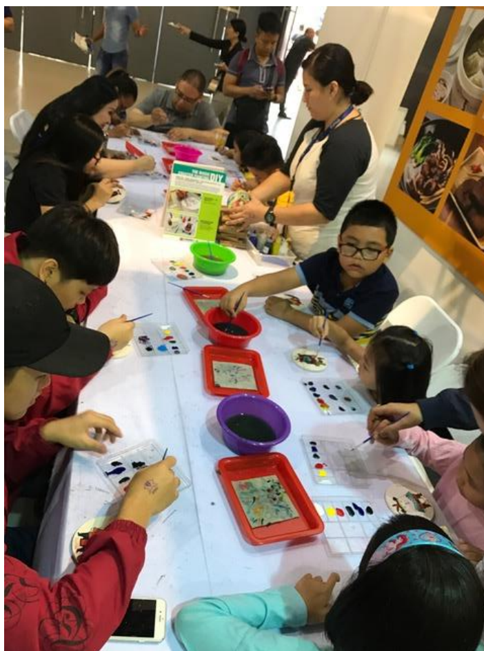
菲國民眾熱情參加TME旅展臺灣館DIY體驗活動