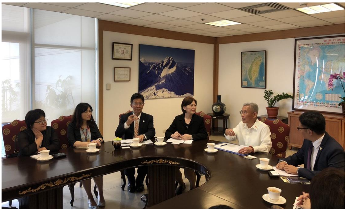
徐佩勇大使親切答覆代表團成員關心議題