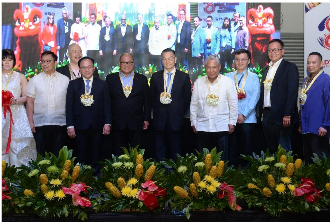
駐菲律賓代表處朱曦公使與各國貴賓出席 TME 旅展開幕典禮