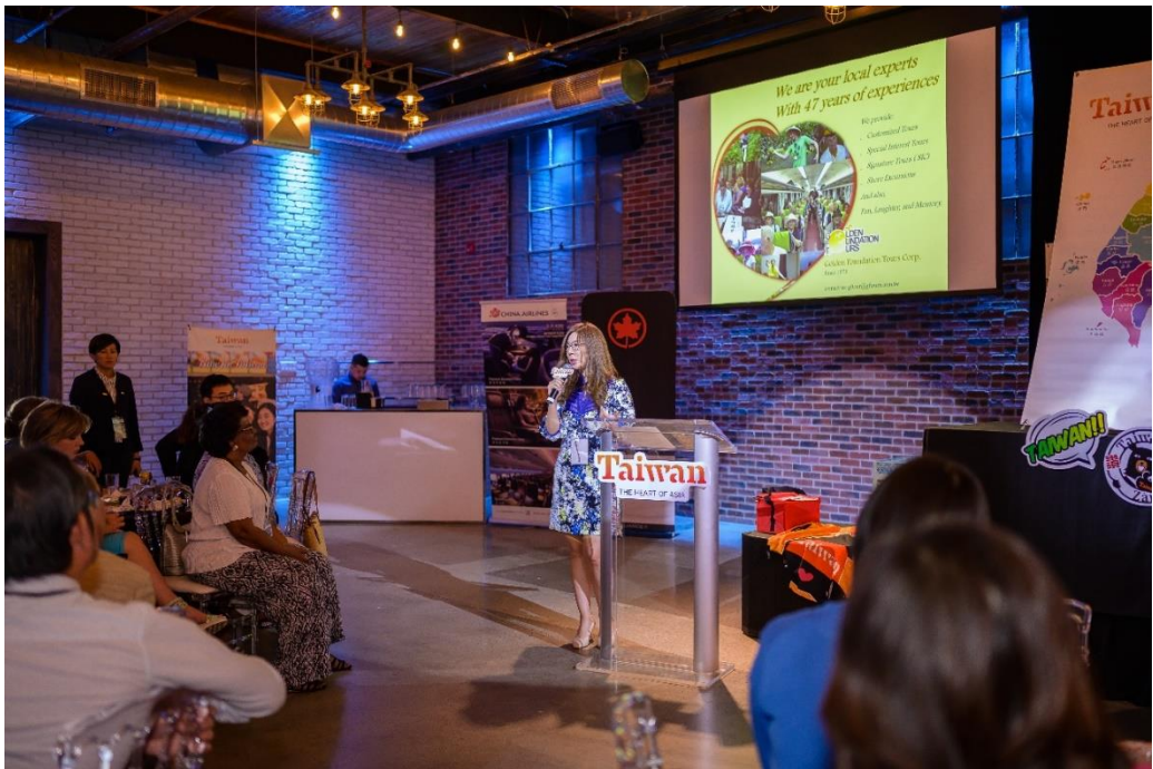
輪桌洽談前由臺灣代表團業者各自進行一分鐘簡介，建立當地業者基本印象