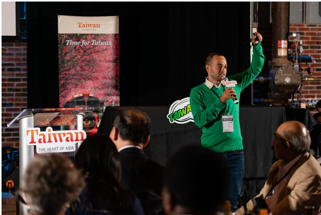
Youtuber 李小飛 (Asher Leiss) 配合當地人旅遊喜好 分享臺灣山川之美以及大自然旅遊之樂趣