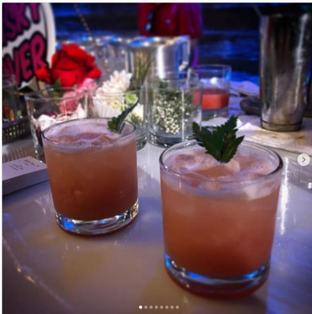
masayukihashimoto · 追蹤 EWG - Eglinton West Gallery

masayukihashimoto Do you @kavalanwhisky. Great #Taiwan #Whiskey. @aircanada #asiasalesteam attending @ttb_na to promote travel to Taiwan.