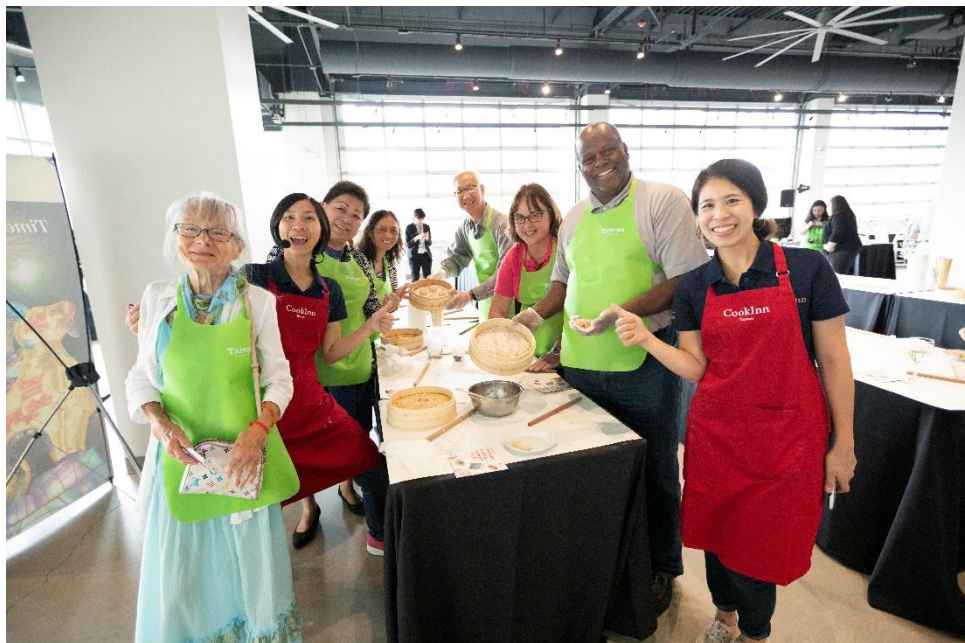
代表團及當地業者透過臺灣美食廚房體驗活動成功深化雙邊交流

另外特別邀請吧沐 Bar Mood Taipei 專業調酒師，以聞名世界的金車噶瑪蘭威士忌搭配臺灣特色材料，如冬瓜茶、烏梅汁、枸杞等，調出各式具臺灣風味的特色調酒，其獨特風味深受當地業者及媒體喜愛，現場供不應求。