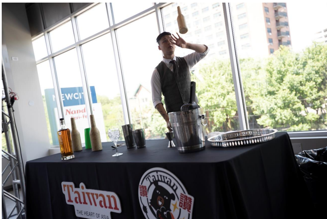
開場由「BarMood Taipei 吧沐」調酒師表演花式調酒，炒熱現場氣氛