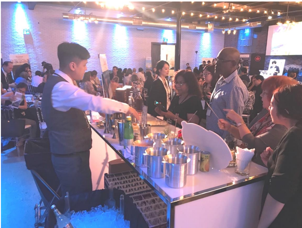
吧沐 Bar Mood Taipei 專業調酒師結合噶瑪蘭威士忌與臺灣在地食材 製作特色風味調酒，現場大獲好評