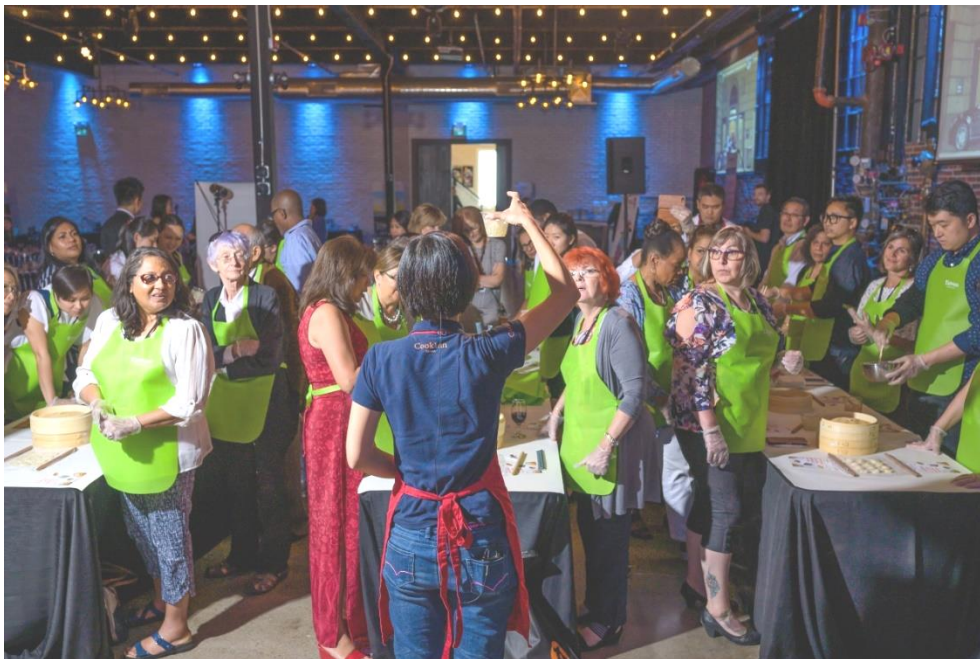
當地業者聆聽 CookInn Taiwan 代表講解臺灣傳統小籠湯包之製作步驟