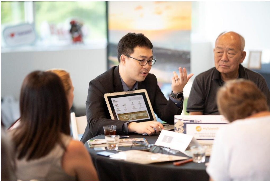
推廣會以臺灣小鎮意象佈置，雙方業者皆把握時間，積極進行業務洽談