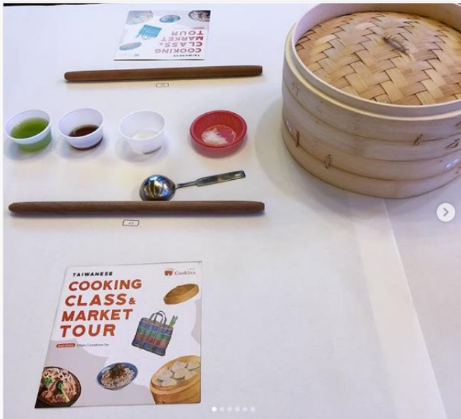
carina.tatravel · 追蹤 EWG - Eglinton West Gallery

carina.tatravel Had a great time at the Experience Taiwan event. Besides the beautiful mountainous scenery and rich cultural experience, Taiwan is also definitely a food lovers' paradise, with it's renowned night markets and many food festivals. . .