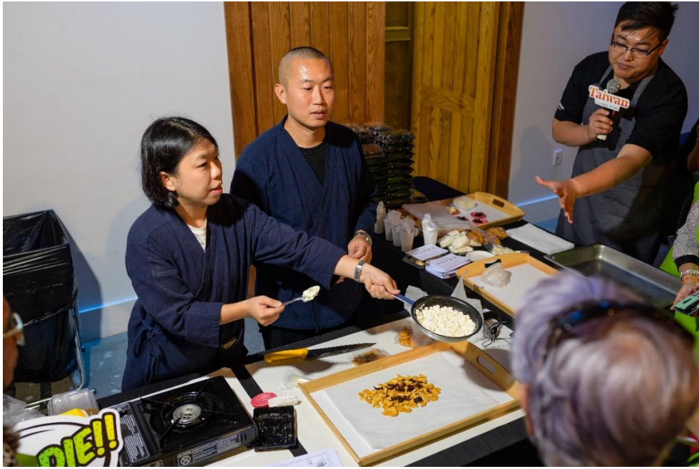
仙湖農場料理達人現場示範龍眼乾雪 Q 餅製作過程