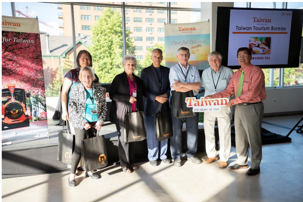
活動最後進行抽獎活動，並與得獎貴賓現場合影留念

活動尾聲舉辦抽獎活動，獎品由航空公司提供之機票搭配代表團成員提供之住宿券等旅遊產品，加上太陽餅、水果乾、溫泉面膜、金車噶瑪蘭威士忌等富臺灣味的精美小獎，贈送幸運貴賓，除了將現場氣氛炒熱外，也深化臺灣做為旅遊目的地之印象。