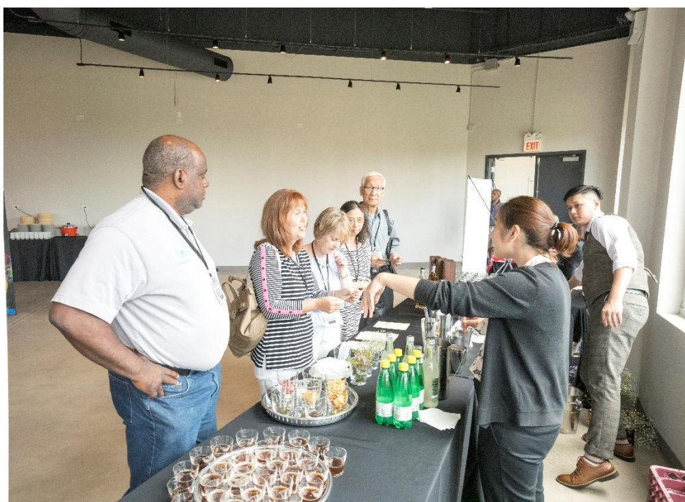
當地業者積極詢問，希望認識特色調酒中的臺灣食材