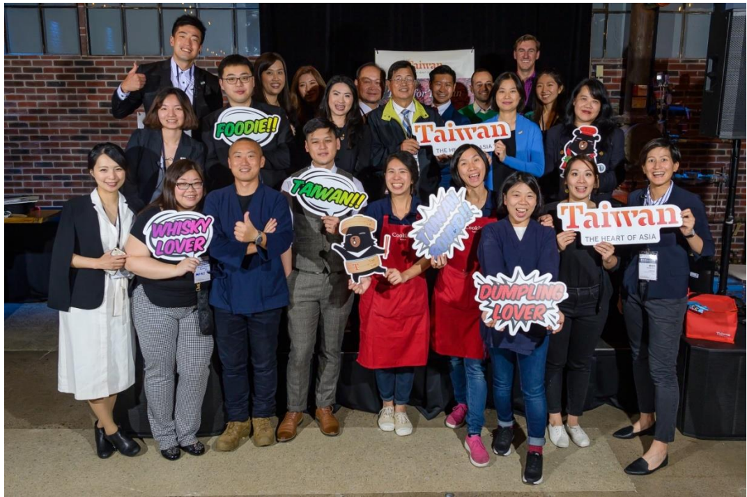
臺灣代表團於多倫多推廣會後合影留念