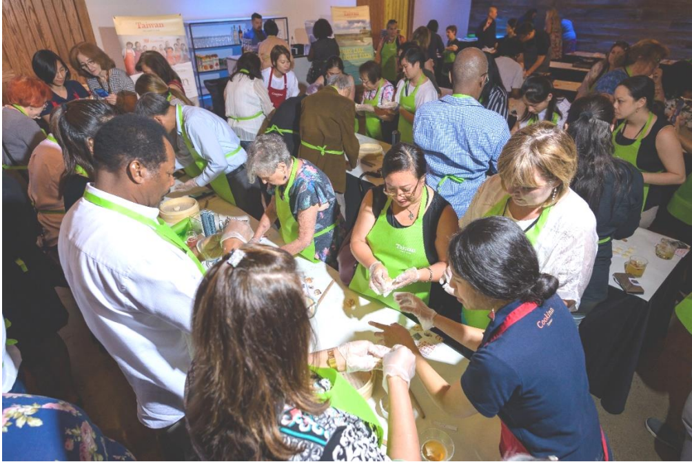
當地業者投入廚藝教室體驗，享受 DIY 臺灣料理的樂趣