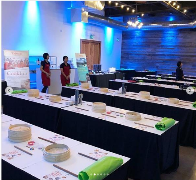
carina.tatravel · 追蹤 EWG - Eglinton West Gallery

carina.tatravel Had a great time at the Experience Taiwan event. Besides the beautiful mountainous scenery and rich cultural experience, Taiwan is also definitely a food lovers' paradise, with it's renowned night markets and many food festivals. .