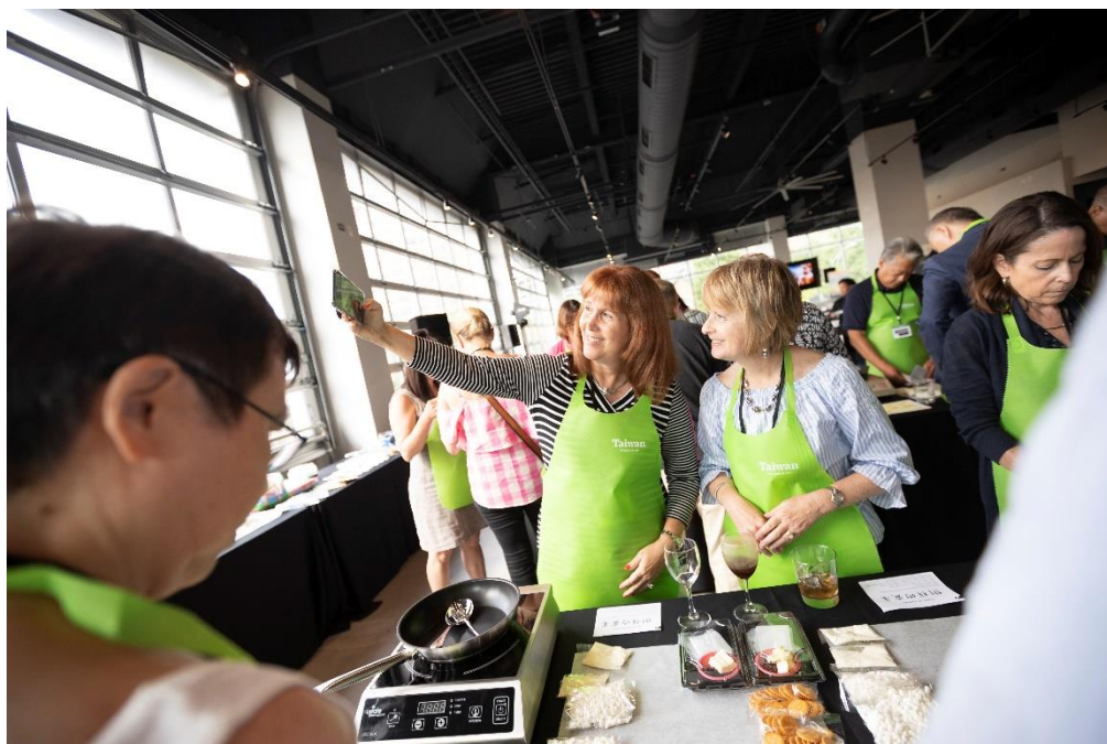
當地業者熱情投入煙燻龍眼雪 Q 餅製作，並於現場自拍留念