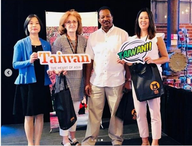
eglintonwestgallery · 追蹤 EWG - Eglinton West Gallery

#takemethere #amazingtaipei #taiwandream #honeymoondestination #eventaiwan #discovertaiwan #amazingtaiwan #torontotravels #lovetotravel #eglintonwestgallery #toronto