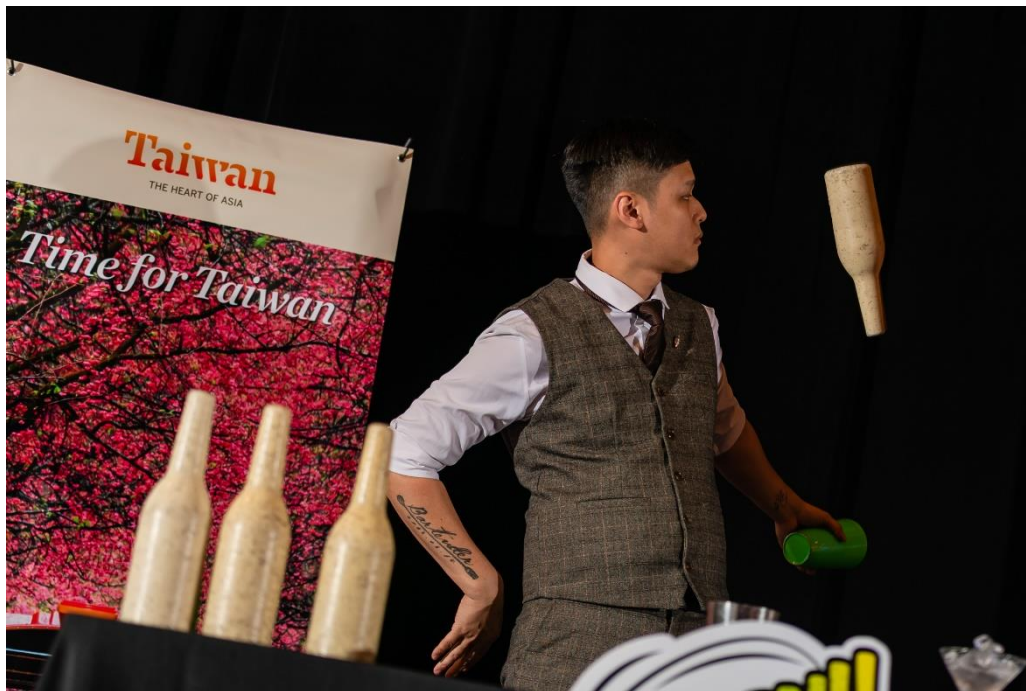
「BarMood Taipei 吧沐」調酒師帶來精采花式調酒表演，吸引賓客目光