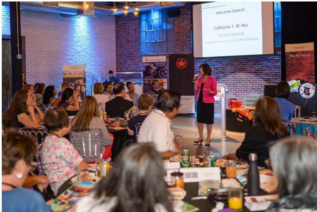
駐多倫多臺北經濟文化辦事處徐詠梅處長親臨多倫多活動現場