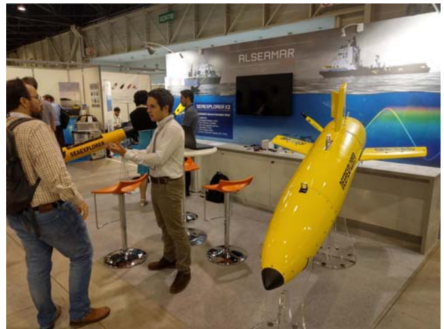
研討會展場所展示的 Sea-Glider