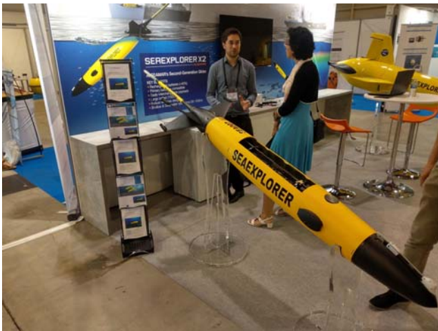
研討會展場所展示的 Sea-Glider