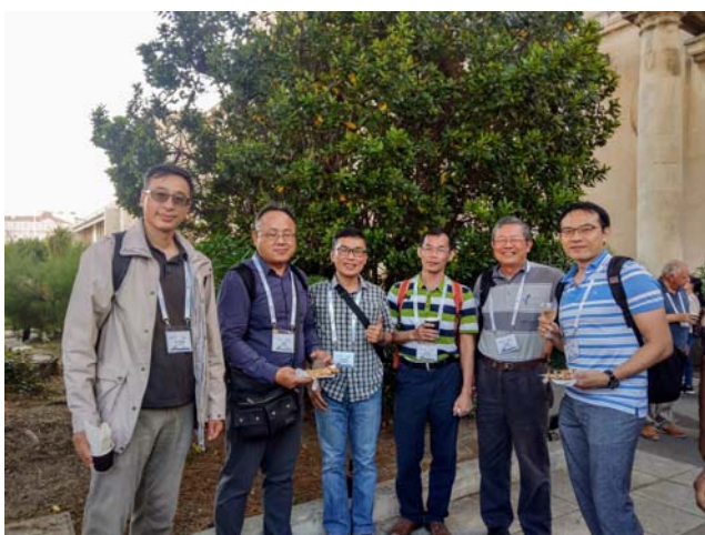
攝於 IEEE Oceans 2019 研討會會場