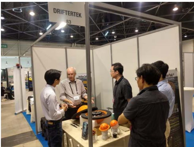
臺灣公司所參展的微型海洋浮標