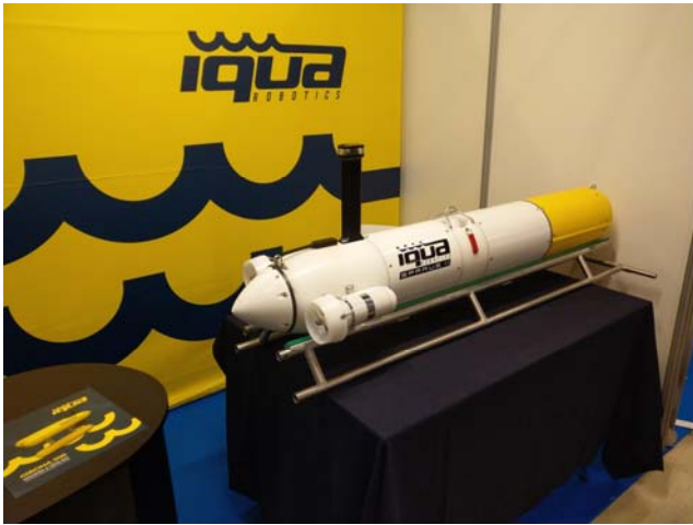
研討會展場展示的自主式水下載具