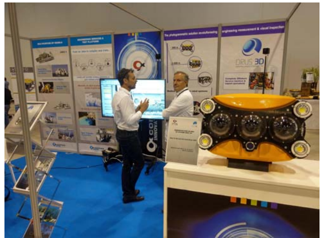
研討會展場展示可執行水下 3 維建模的 ROV