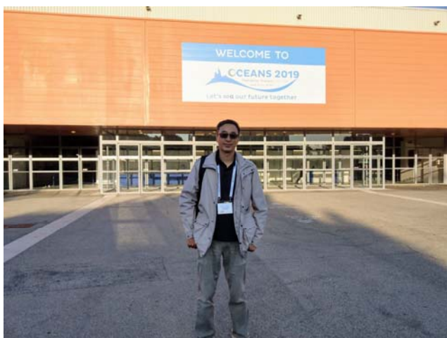
攝於 IEEE Oceans 2019 研討會會場