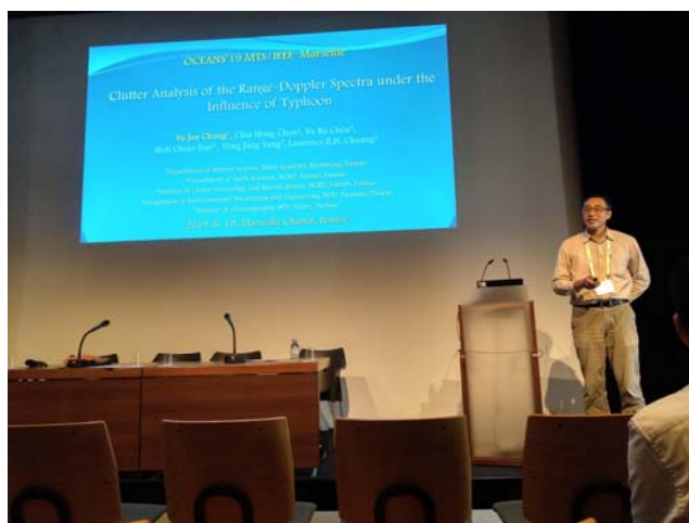
於 IEEE Oceans 2019 進行論文發表