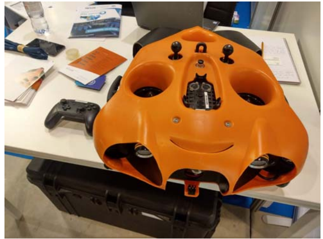
研討會展場展示的 ROV