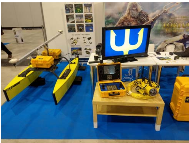
研討會展場展示的 ROV