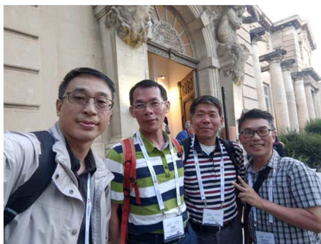
攝於 IEEE Oceans 2019 研討會會場