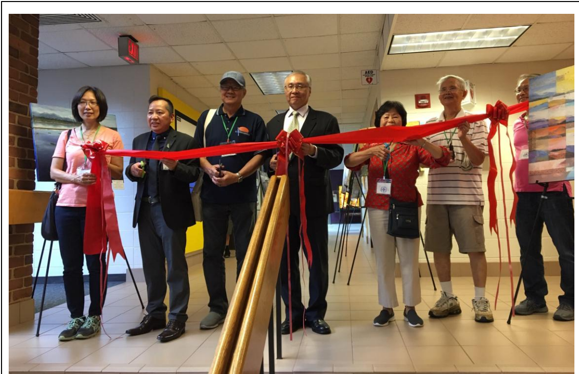
張主任秘書(中)於臺灣之美紀念畫展開幕式中剪綵