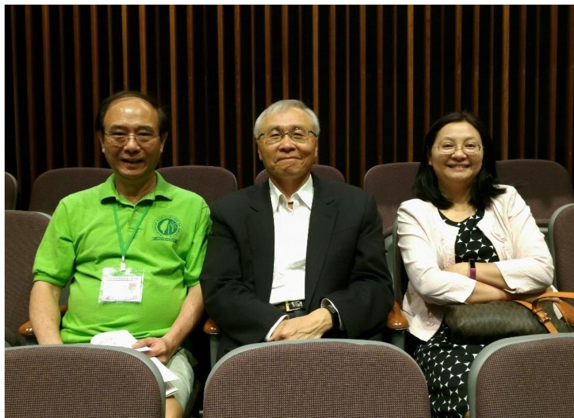
張主任秘書(中)聆聽夏令會講座