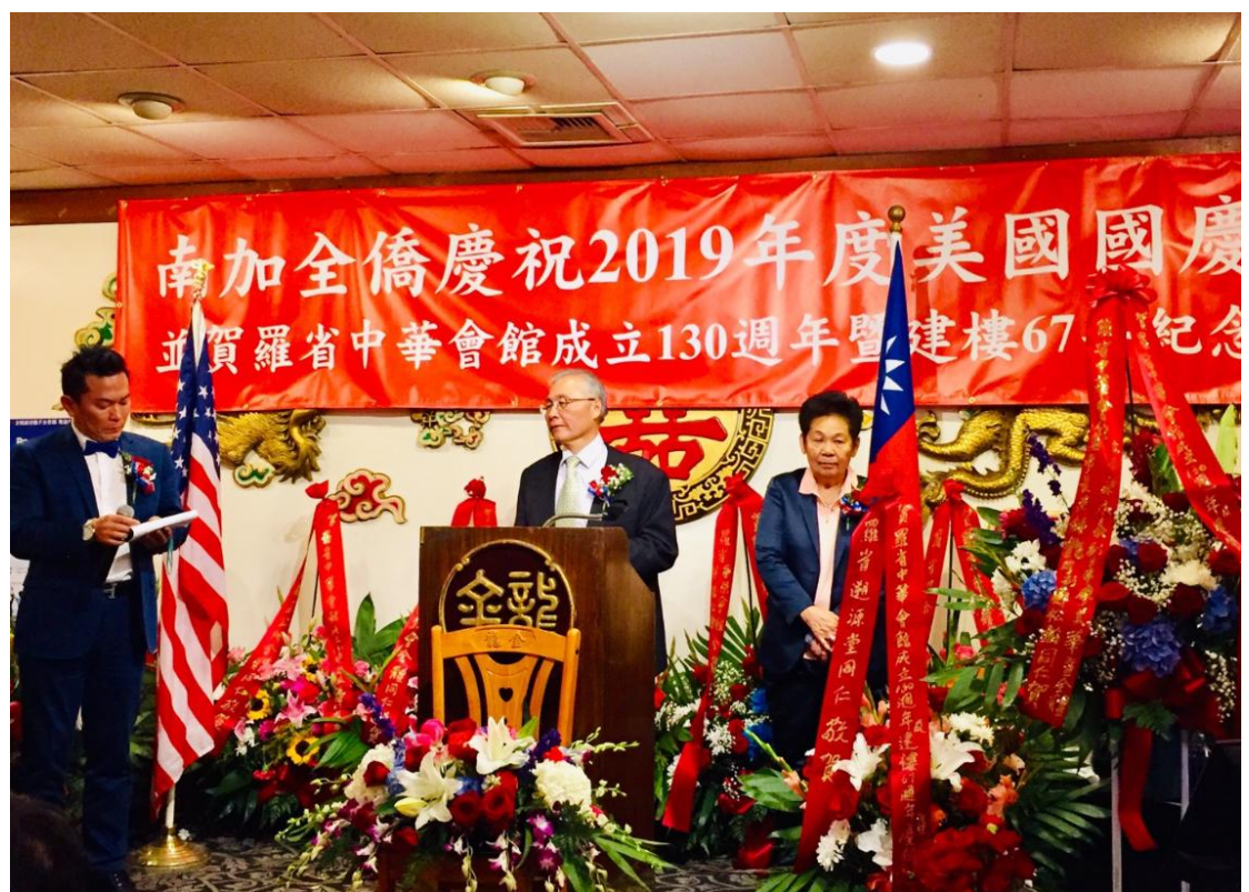
張主任秘書出席羅省中華會館慶祝美國國慶暨成立 130 週年/建樓 67 週年全僑餐會活動並致詞