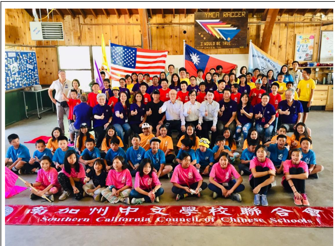
張主任秘書(中)訪視南加州中文學校聯合-2019年中華文化夏令營大合照