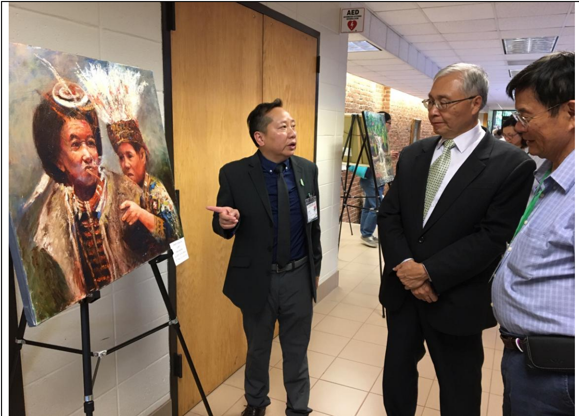
畫展策展人向張主任說明作者理念