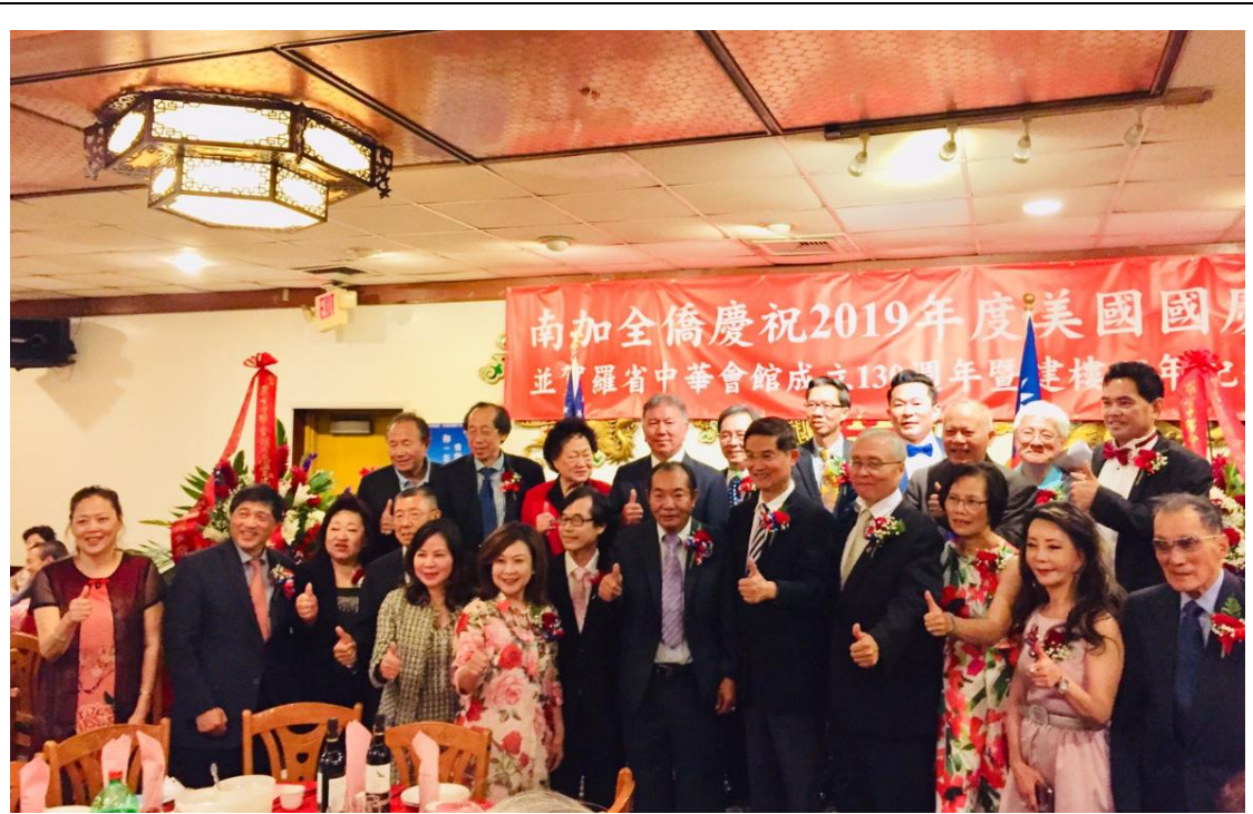
張主任秘書(前排右 4)出席羅省中華會館慶祝美國國慶暨成立 130 週年暨建樓 67 週年全僑餐會活動大合照