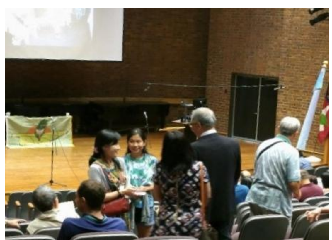
張主任秘書(右 2)與亞特蘭大臺灣同鄉會會長(左 1)交換意見