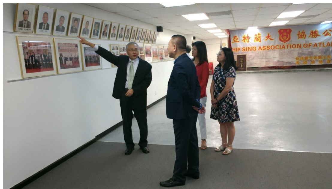
張主任秘書(左 1)拜會協勝公會