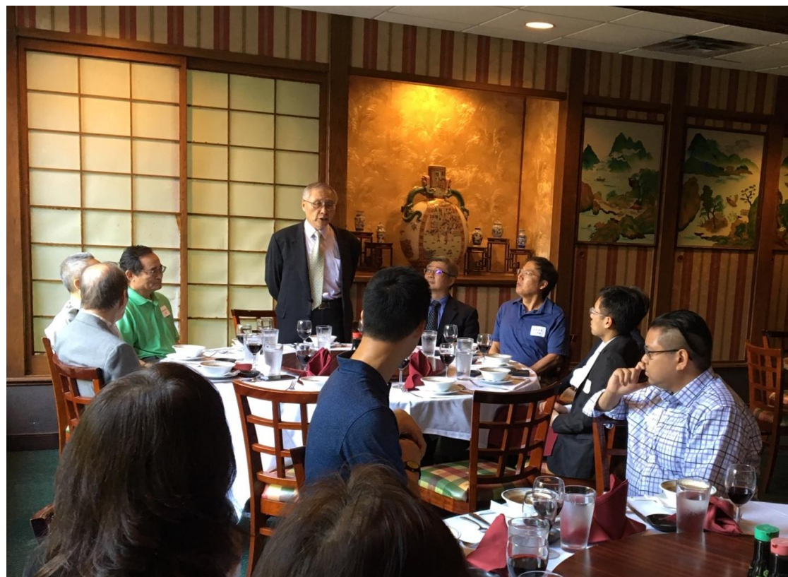
張主任秘書(立者)於亞特蘭大僑務榮譽職座談餐會致詞