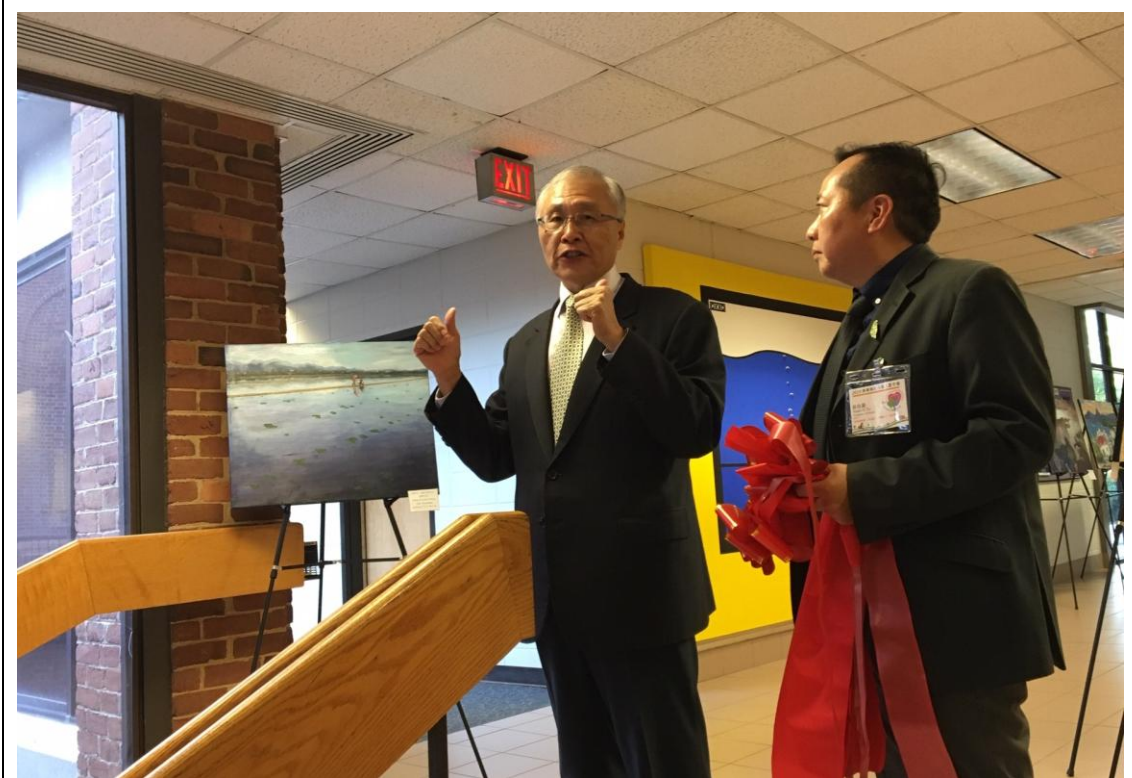
張主任秘書於畫展致詞