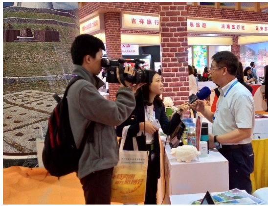
圖 9：廈門記者報導本會高山農場(1)