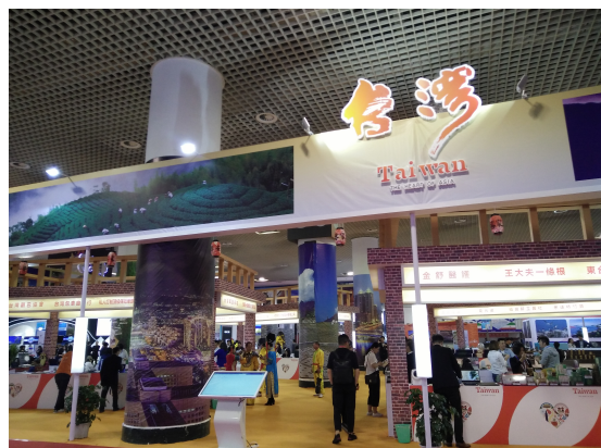
圖 2：2019 廈門海峽旅博會-臺灣展館