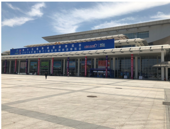
圖 1：廈門國際會展中心 C3 展館

於會展中心領取參展證件後，因臺灣展館攤位C07、C08展位裝潢工程尚在趕工還未完成，故先就展覽攤位周邊進行打掃、擦拭整理，把DM簡介及各項宣傳品初步試擺，待裝潢工程全部完成，明早提前至會場再加緊佈置就定位。於17:00前完成報到、貨品存放及初步佈展確認。