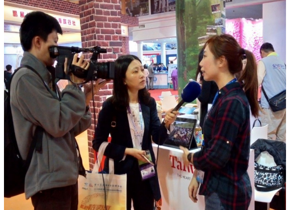
圖 10：廈門記者報導本會高山農場(2)