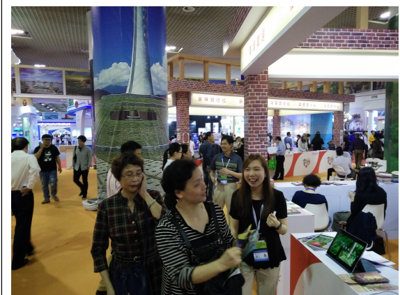
圖 8：行銷推薦輔導會屬各農場