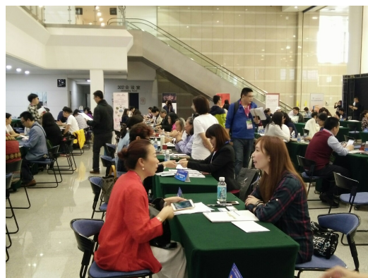
圖 12：業者洽談會及交流茶會