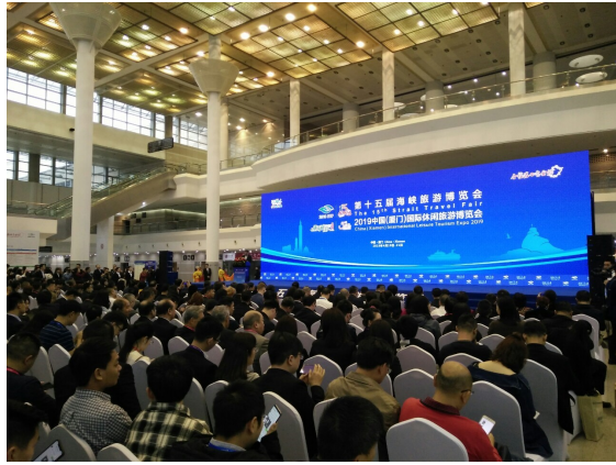
圖 3：2019 廈門海峽旅博會-開幕儀式