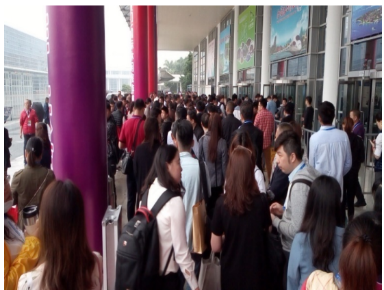
圖 5.旅展開幕首日人潮絡繹不絕