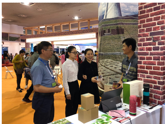
圖 7：行銷推薦輔導會屬各農場