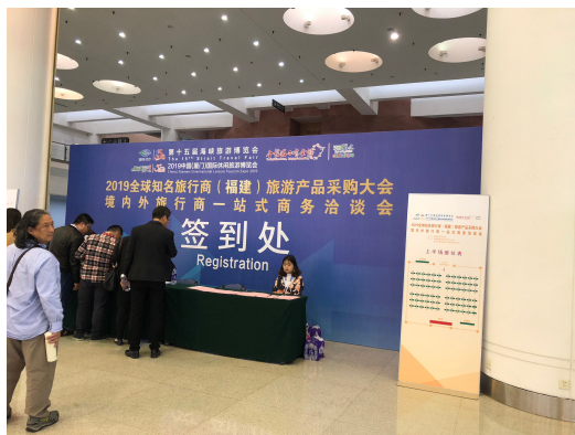
圖 11：業者洽談會及交流茶會