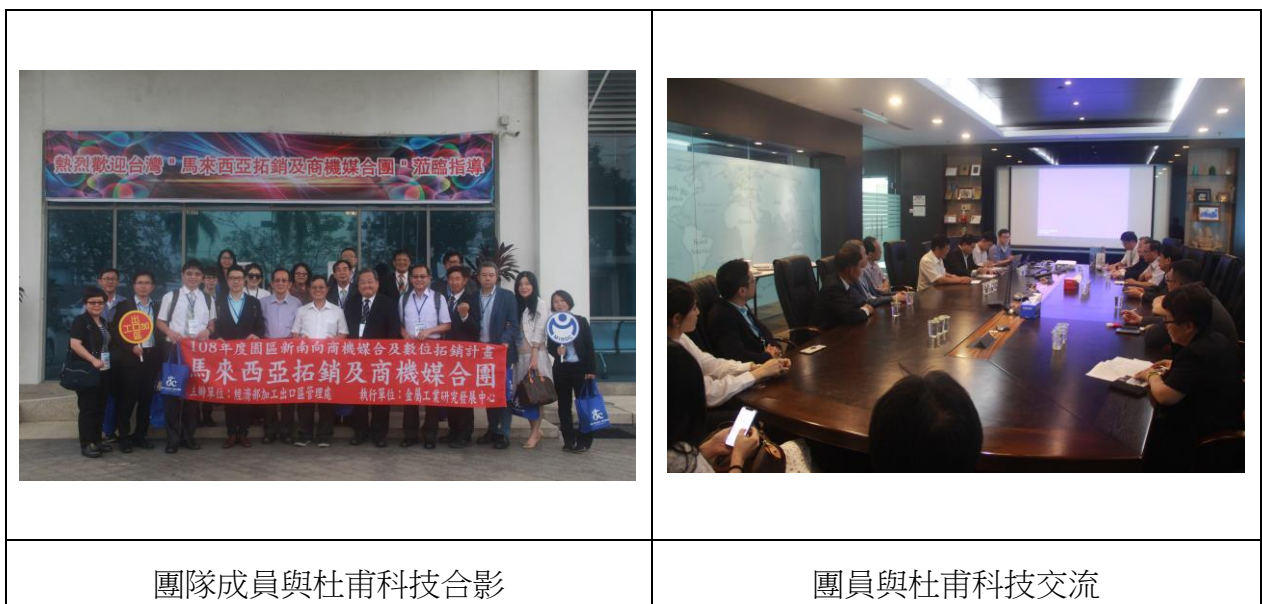
圖 2 杜甫科技參訪照片