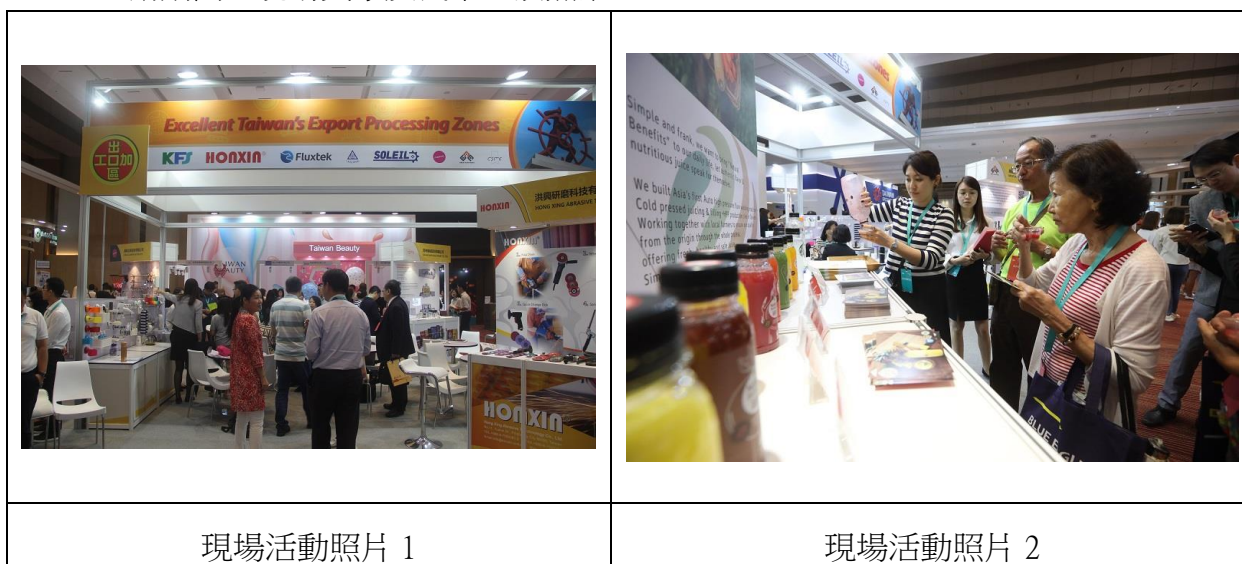
圖 6 加工出口區展攤洽談情形