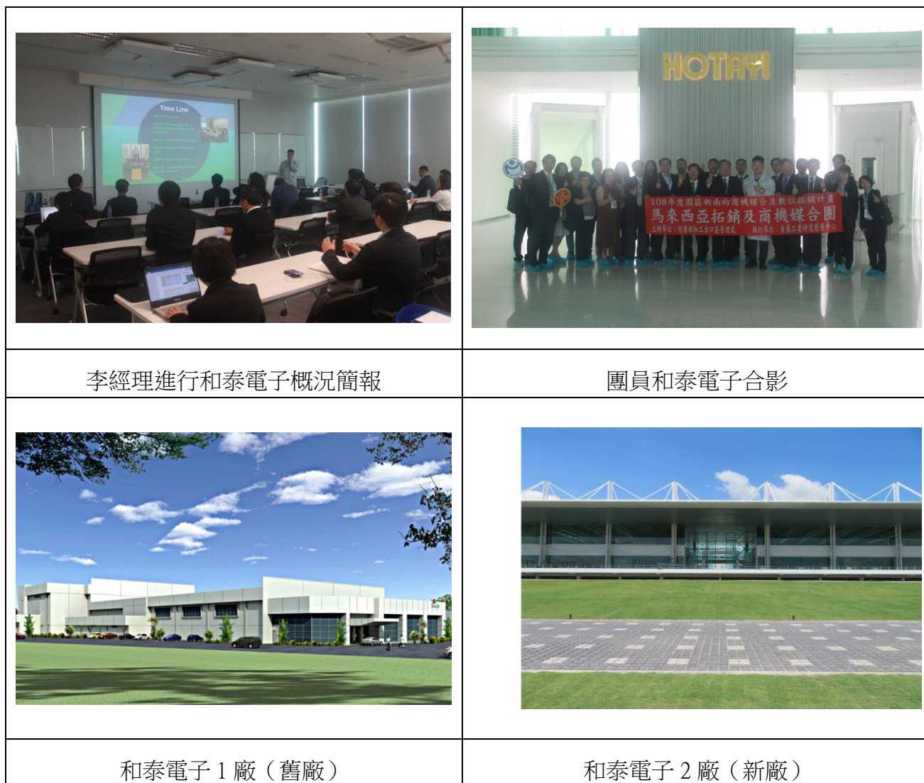
圖 1 和泰電子(Hotayi Electronic)參訪暨台商交流會參訪照片