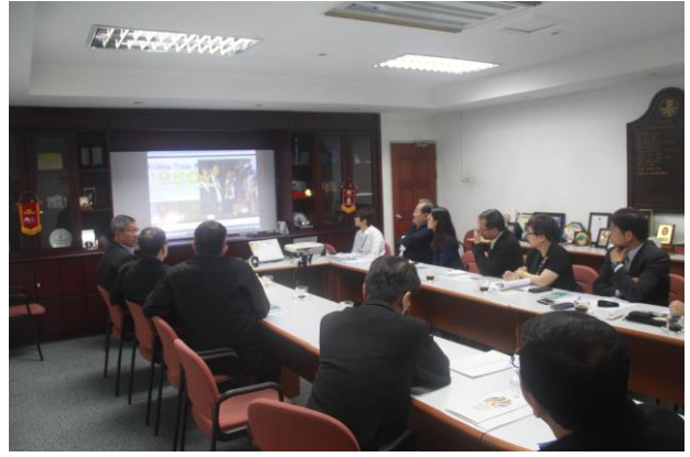
馬來西亞製造商聯合會簡報