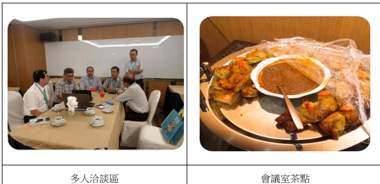
圖 7 設置專屬會議室