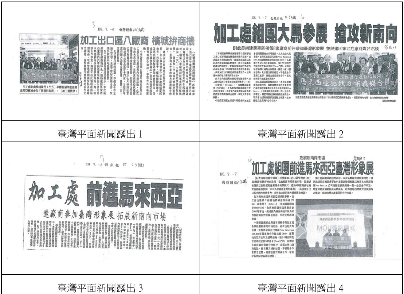
圖 10 馬來西亞拓銷及商機媒合團臺灣新聞露出