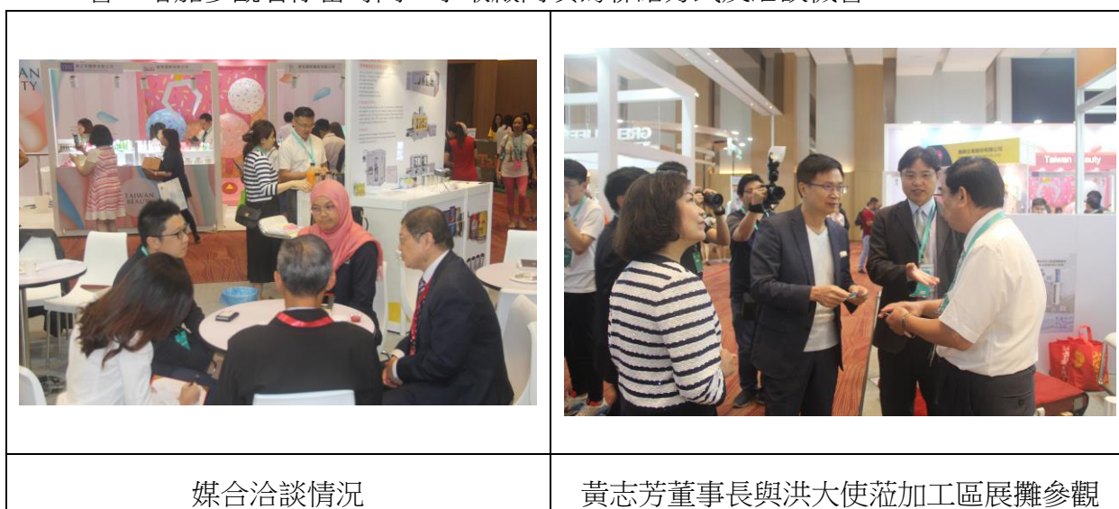
圖 8 媒合洽談區