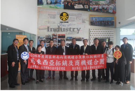
團員與馬來西亞製造商聯合會合照