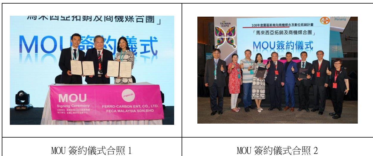
圖 9 MOU 簽約儀式

非卡已經進入新加坡、馬來西亞、菲律賓，持續熱烈展店中。以新加坡為中心輻射周圍印尼、泰國、越南等東協國家正積極洽談合作夥伴，持續拓展地方百貨公司及賣場通路。