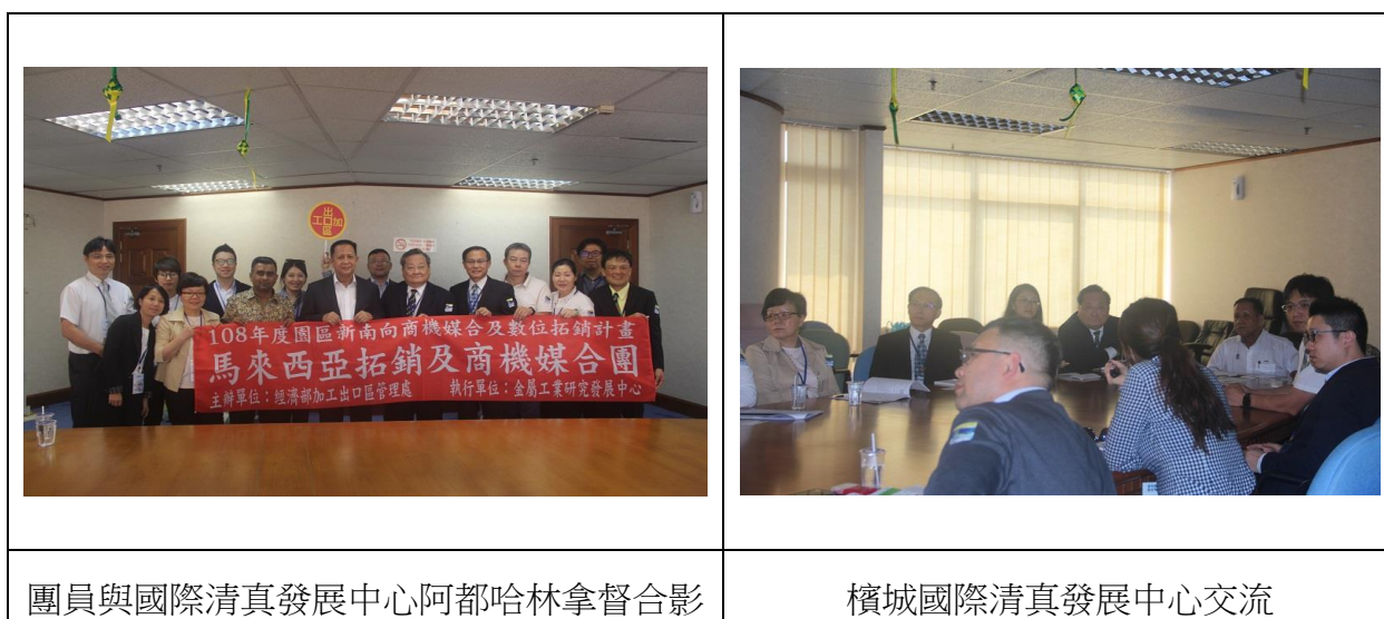
圖 4 檳城國際清真發展中心交流參訪照片