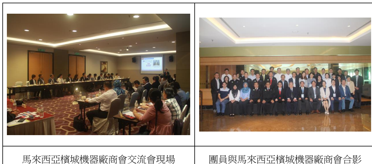
馬來西亞檳城機器廠商會交流會現場