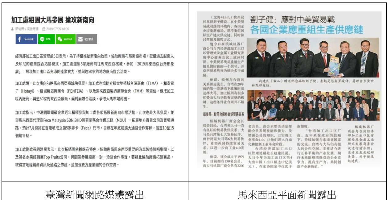
圖 11 馬來西亞拓銷及商機媒合團馬來西亞新聞露出