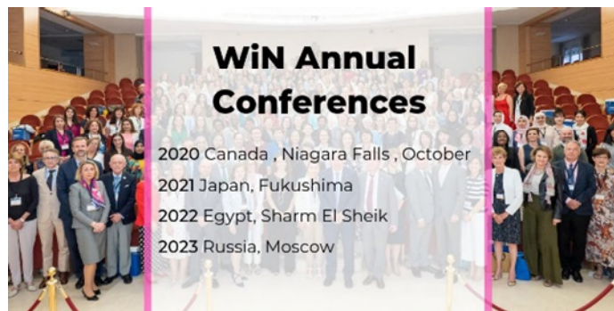
2020 至 2023 年 WiN Global 年會主辦國名單

明年全球核能婦女會年會，將由加拿大分會在尼加拉瀑布舉辦，2021 年適逢福島事故 10 周年，將由日本分會主辦，之後由埃及、俄羅斯分會接續辦理。