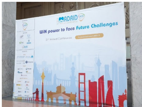
今年年會主題背板

首先在開幕典禮時有西班牙馬德里理工大學傳播副校長、西班牙生態轉型部部長、西班牙 TECNATOM 公司總裁、國際原子能總署署長、西班牙核安委員會顧問等出席，介紹了西班牙核能工業的現況以及西班牙推動綠能、致力於環境變遷等相關之議題。