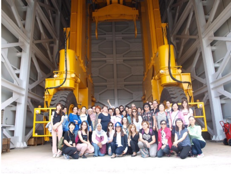
於阿爾馬拉斯核能電廠運送放射性廢棄物 盛裝容器的車輛前合影