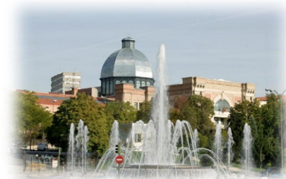
主辦單位 LOGO 及會議地點