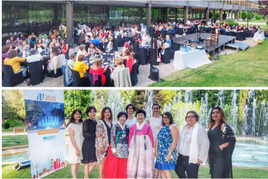
晚宴會場及盛裝出席的會員

交流，拓展核能外交，維持我國在全球核能婦女會所建立的人脈，確保我國在國際會議的能見度。