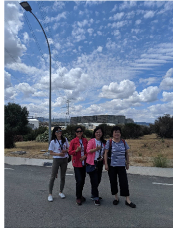
我國代表團成員貯存場前合照

壓水式的反應爐，每個機組有三個冷卻迴路，利用 Tajo 河的河水進行冷卻；一號機在 1981 年開始商轉、另一部機組於 1983 年商轉，由於 2 部機組分別運轉已有 38 年及 36 年，機組已漸老舊同時也面臨反核的壓力，由於運營許可將於 2020 年結束，是否可以延役繼續營運，除了西班牙的反核團體激烈的抗爭外，葡萄牙的反核團體也加入陣營，目前達成的共識是核電廠將於 2028 年關閉進行除役。