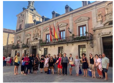
馬德里舊市區合影

今年大會的文化參訪部分，安排了托雷多(Toledo)古城及馬德里舊市區，托雷多是西班牙中部的一個自治市，位於馬德里西南約 70 公里，是托雷多省的首府，也是其所在的卡斯提亞-拉曼查自治區的首府。托雷多為卡斯提亞王國（後西班牙王國）的首都，它因其保存完好的基督教、伊斯蘭教和猶太教建築，在 1986 年被評為世界文化遺產，有哥德式、摩爾式、巴洛克式和新古典式各類教堂、寺院、修道院、王宮、城牆、博物館等古建築。馬德里舊市區被稱為奧地利的馬德里，其中有很多 16 和 17 世紀，當時哈布斯堡王朝統治西班牙時代建造的房舍，多是具有歷史價值紀念性的建築，我們用走的方式來了解這個城市發展的概況。從大會安排文化參訪行程中，可以體認到西班牙歷史是非常淵源的。