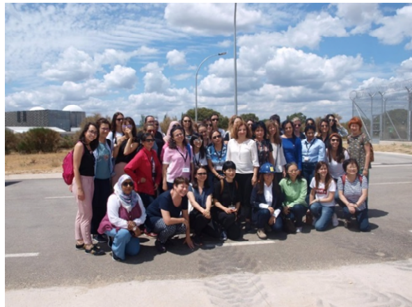
阿爾馬拉斯核能電廠乾式貯存場前合照

電廠後參訪了電廠的展示館，此行我們並未進入核電廠內參觀，而是到用過核燃料乾式貯存場，遠眺存放用過核燃料的水泥貯存桶柱(cast)，該廠區內的乾式貯存場外圍有 5 公尺厚的屏蔽圍牆，共可以存放 40 個貯存桶柱，每個桶柱可以存