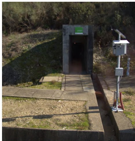
進入中階放射性廢棄物貯存槽掩埋設施下方監測孔道的入口及入口處設置的偵檢器

現場參訪時，我們分成兩組進行，先參訪了檢整減容的控制室，了解現場人員利用機械手臂操控的情況，接著乘坐遊覽車前往場內中階廢棄物貯存設施的下方，由檢測口進入該設施下方的通道，了解該設施排水、通氣的管道；之後再搭車前往場內參訪了低階及低階放射性廢棄物貯存設施。