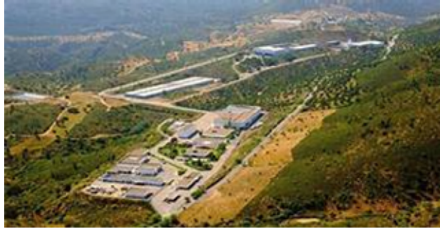
EL Cabril 放射性廢棄物處理及貯存場鳥瞰圖

國核管會將此放射性廢棄物貯存場，視為世界上最好的放射性廢物處置設施之一，稱其是其他國家類似中心的典範。此放射性廢物處置設施設有中階放射性廢棄物貯存場及低階極低階放射性廢棄物貯存設施以及減容檢整的設施。