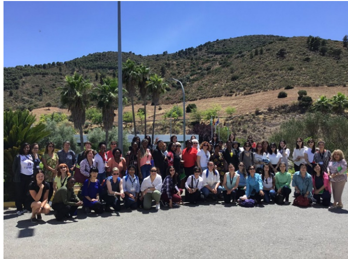
EL Cabril 放射性廢棄物處理及貯存場合影

本次核能婦女委員會會員共有 70 多人前往參訪，我們先搭乘火車再轉搭遊覽車，單趟車程約 3 個多小時。到達此次參訪的 EL Cabril 放射性廢棄物處置場，首先聽取設施工作人員的簡報，介紹該設施的概況，接著分組